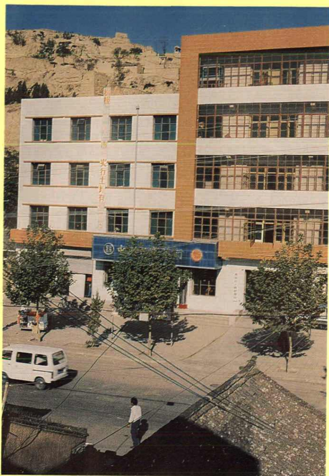
县土地管理局办公楼