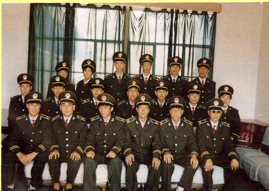
秦安县土地管理局全体职工