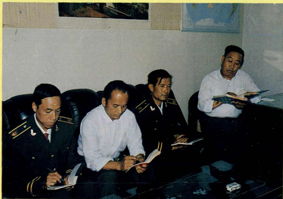
局领导及主编讨论志稿