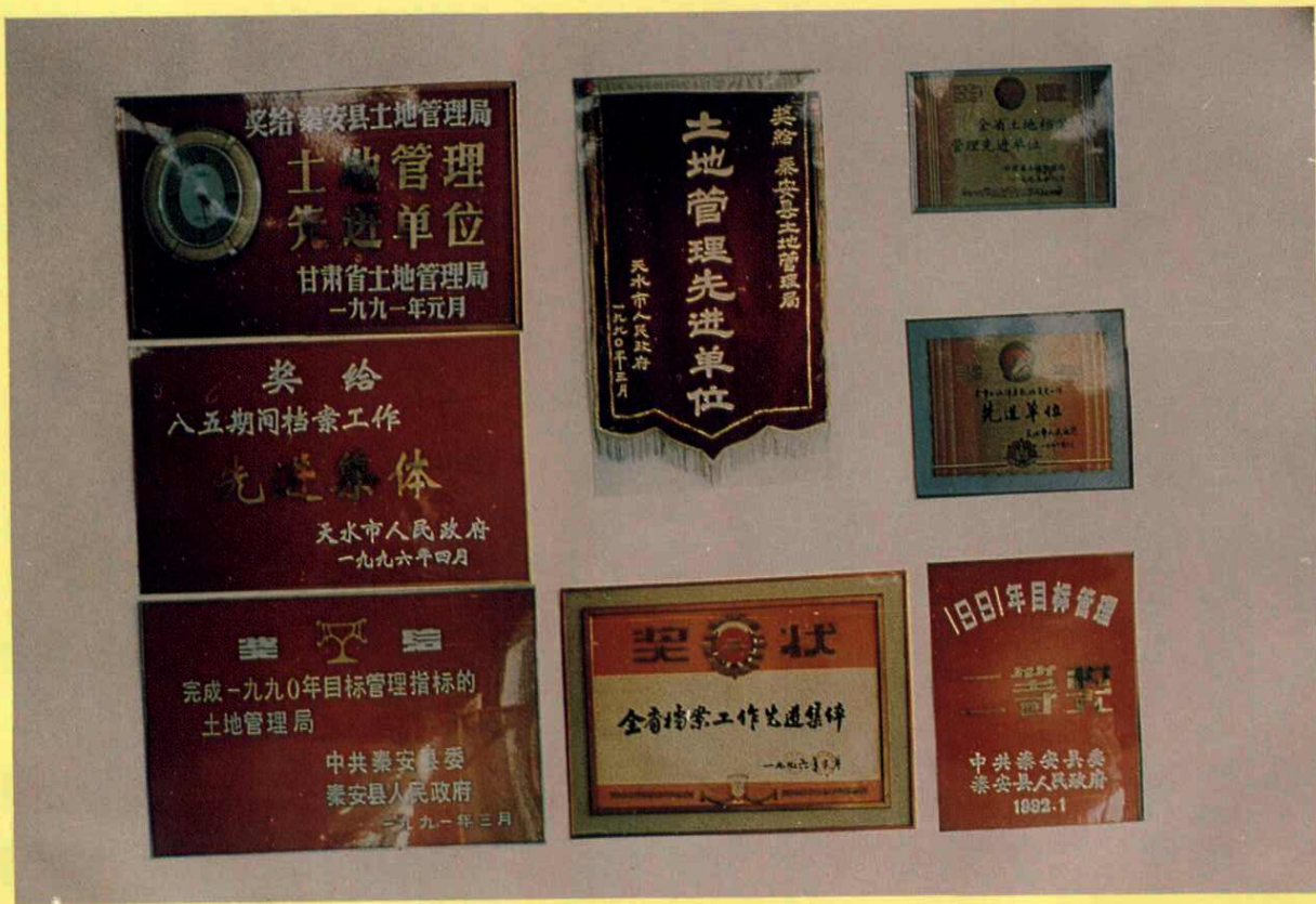
秦安县土地管理荣获的部分奖牌、锦旗