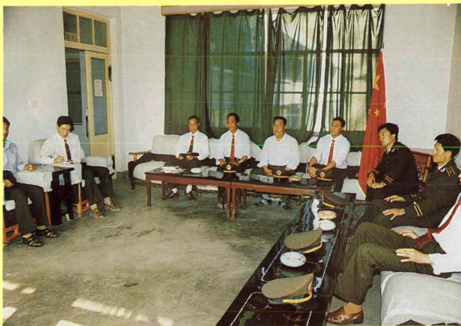
县土地管理局会议室一角