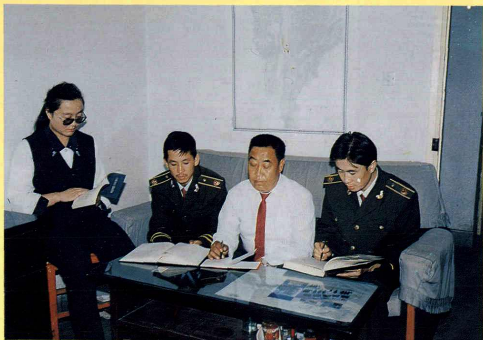
全体编辑正在商讨编志中的有关问题