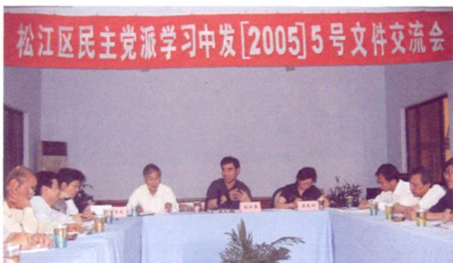
2005年5月，统战部召 开民主党派学习中发 [2005]5号文件交流会