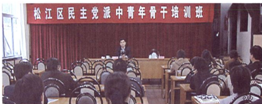
2005年11月，在区社会主义学院举办民主党派中青年骨干培训班