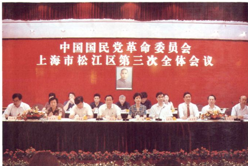
2006年6月，民革松江区第三次全体会议召开