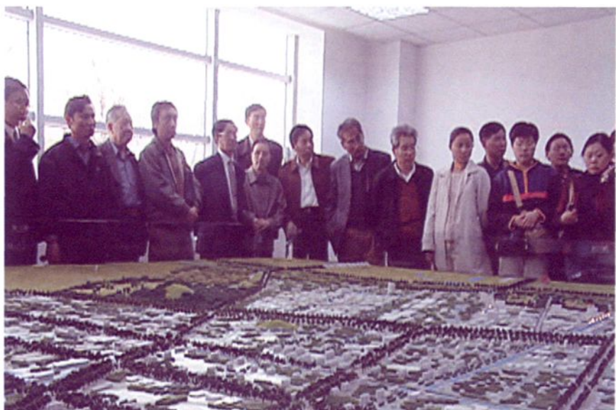
2004年4月，民主党派成员参观松江城乡建设规划模型