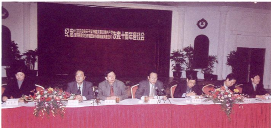
1999年12月，区委召开纪念《中共中央关于坚持和完善中国共产党领导的多党合作和政治协商制度的意见》发表十周年座谈会