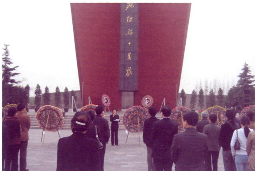
2005年4月，民主党派成员祭扫松江烈士陵园