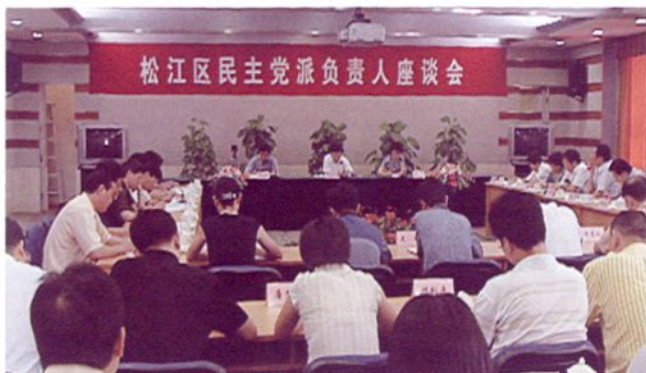
2006年7月， 区委召开民主党派 负责人座谈会