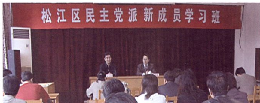
2006年4月，在区社会主义学院举办民主党派新成员学习班