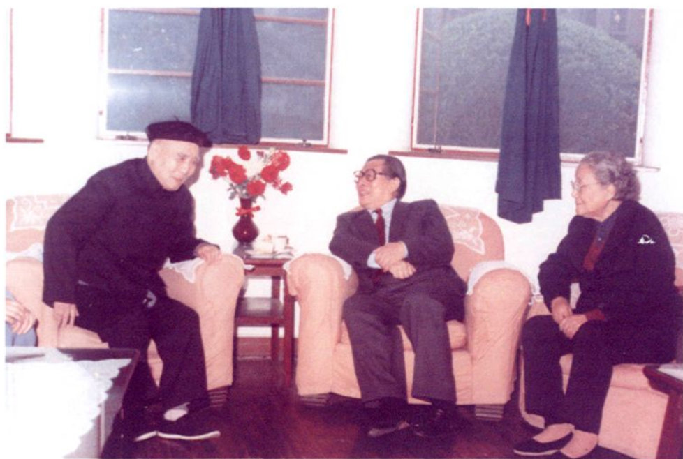
1986年11月，江泽民看望赵祖康