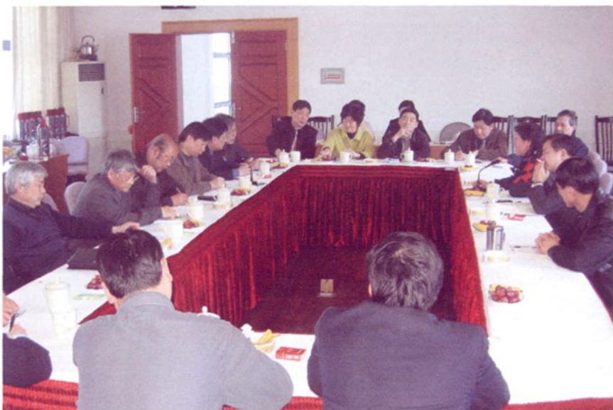
2005年3月，民主党派负责人在区市政局参加知情活动