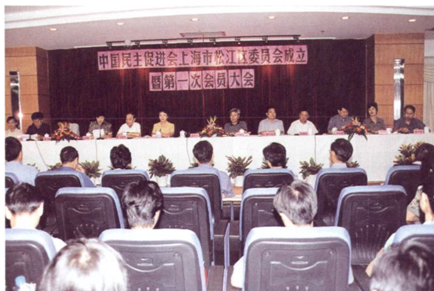
2001年9月，民进松江区委成立暨第一次全体会员大会