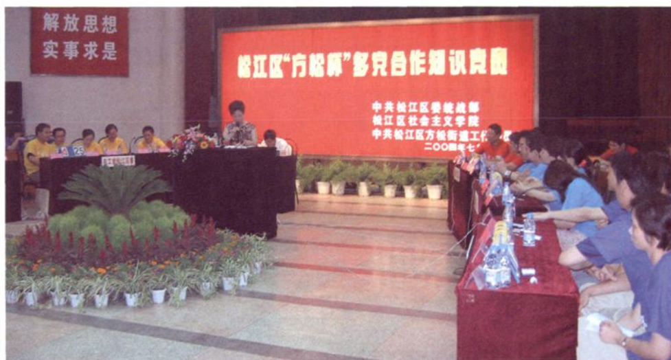
2004年7月，各民主党派选派代表参加“方松杯”多党合作知识竞赛