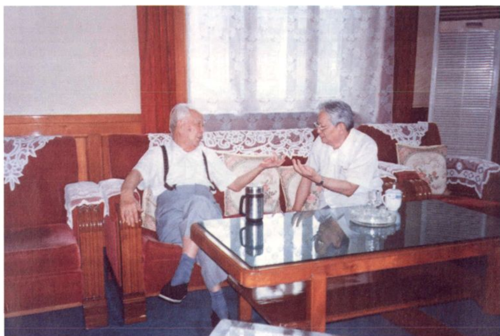
1995年8月，万里与杨纪珂亲切交谈