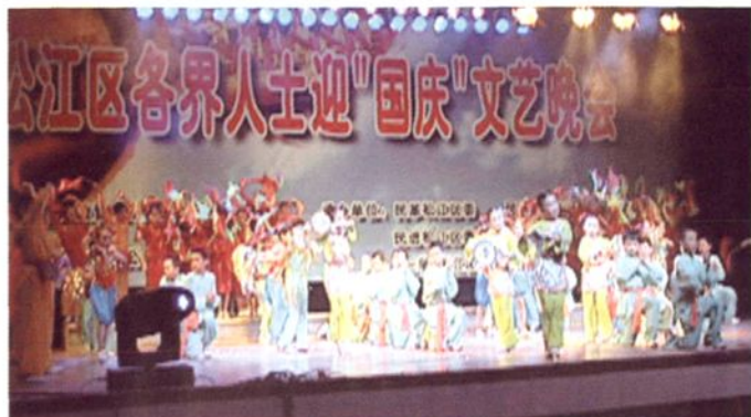
2004年9月， 统战部与民主党派 联合举行各界人士 迎“国庆”文艺晚会