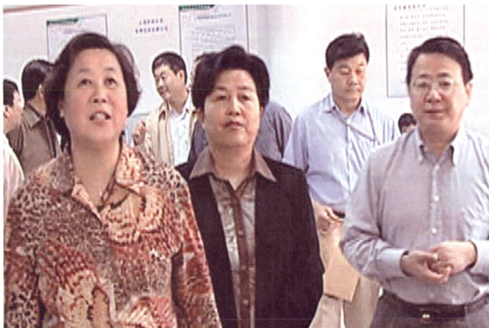
2005年5月，民建中央副主席张榕明(左一)来松指导工作