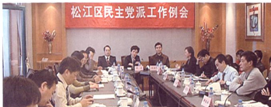
2006年12月，各民主党派负责人在工作例会上交流加强自身建设情况