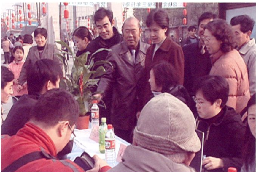
2004年12月，各民主党派成员走上街头为市民服务