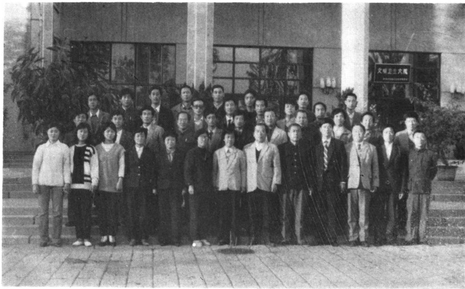
4. 保定市人事局全体人员合影