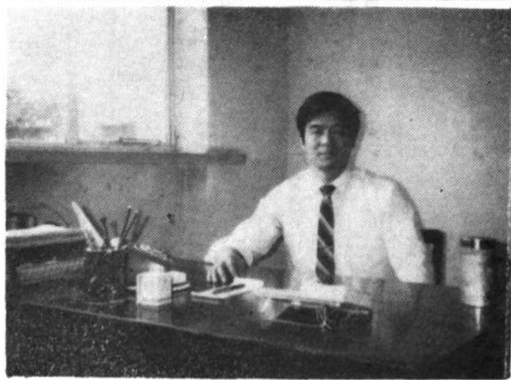
3. 保定市人事局副局长 赵洪涛