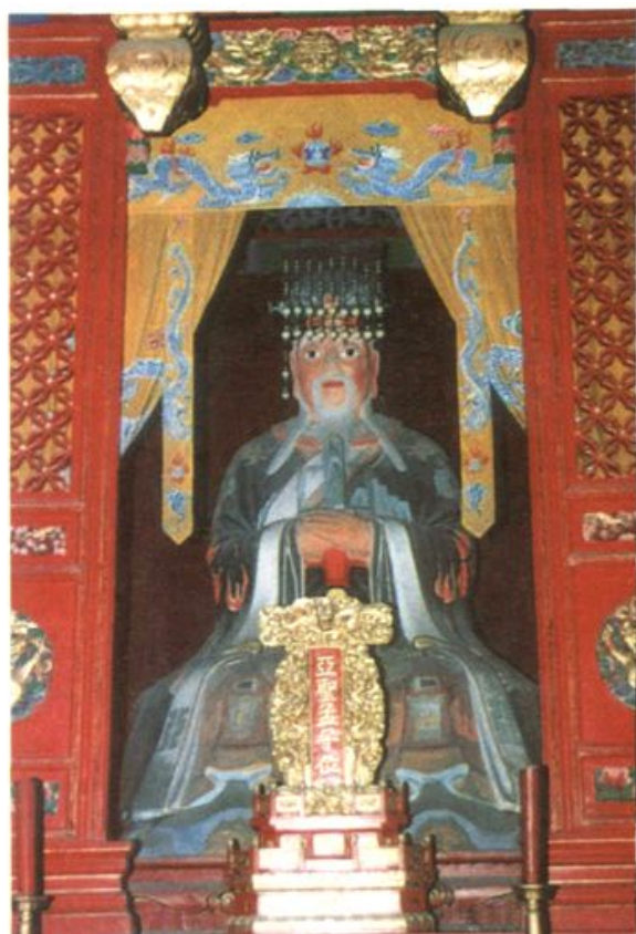
◀ 亚圣殿内孟子塑像