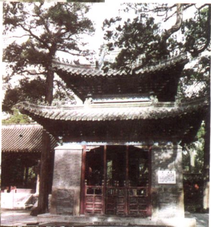
孟庙内康熙御碑亭