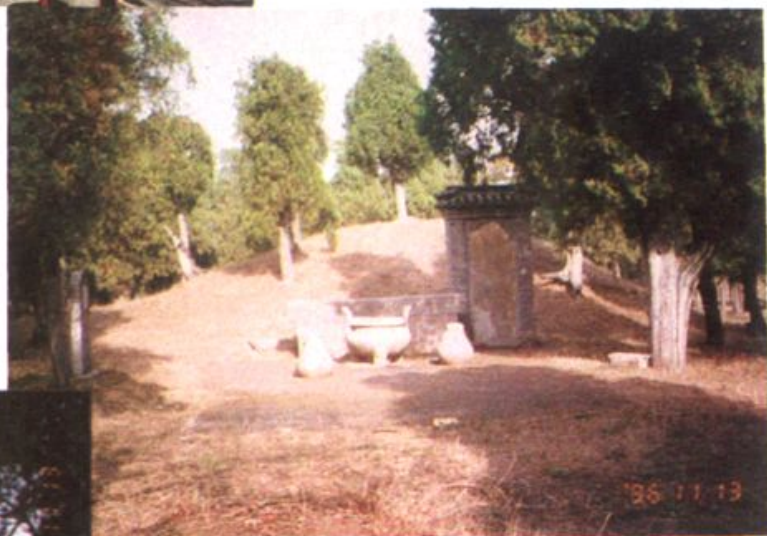
◀ 孟母林内孟子父母神位碑