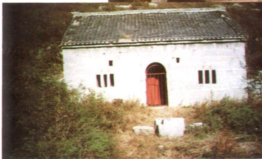
▲临淄公泉峪亚圣祠