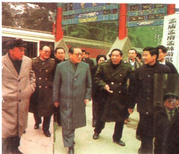
▲乔石同志视察孟府孟庙