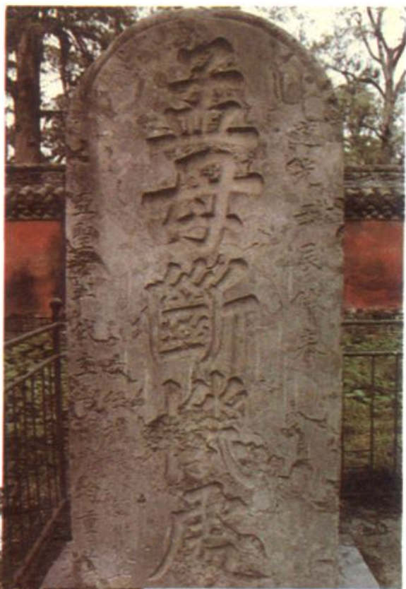
▶ 孟庙孟府之间的 过街亚圣坊