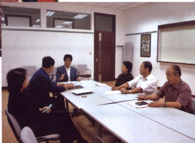
省委组织部副部长、老干部局局长王立平来校视察,同校领导班子成员交谈。