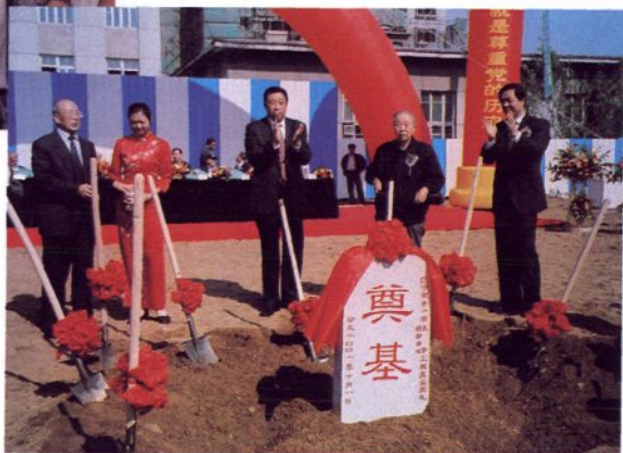
2001年10月1日省老领导郭峰(右二)、省委书记闻世震(右三)、省长薄熙来(右一)、省政协主席肖作福(右五)出席辽宁省老干部大学·活动中心工程奠基典礼。