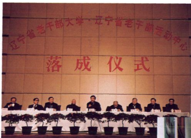
2002年12月26日省领导在辽宁省老干部大学·老干部活动中心落成仪式上。左起:赵新良、张锡林、张文岳、王光中、薄熙来、郭峰、孙奇、骆琳、李国忠。