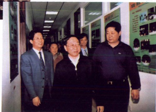
2004年9月27日省委副书记王万宾来校视察并观看图片展。