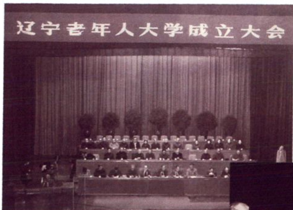
1984年12月10日辽宁老年人大学成立大会