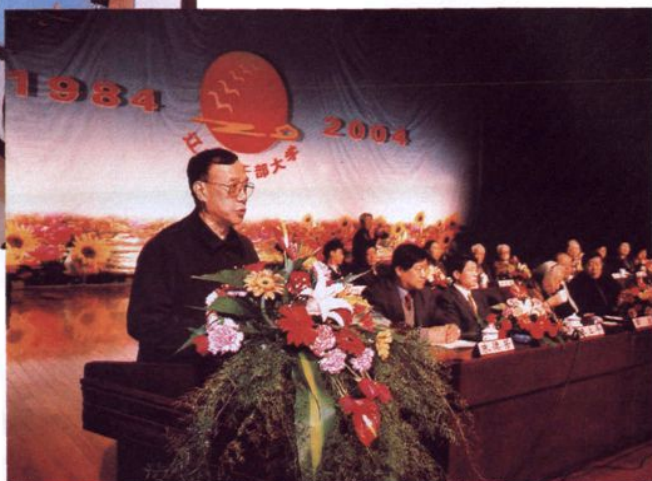
2004年12月10日省委副书记王唯众，在庆祝建校20周年大会上讲话。