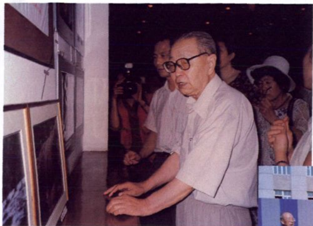
2001年6月11日原省委 第一书记郭峰参观学校书画、 摄影作品展。