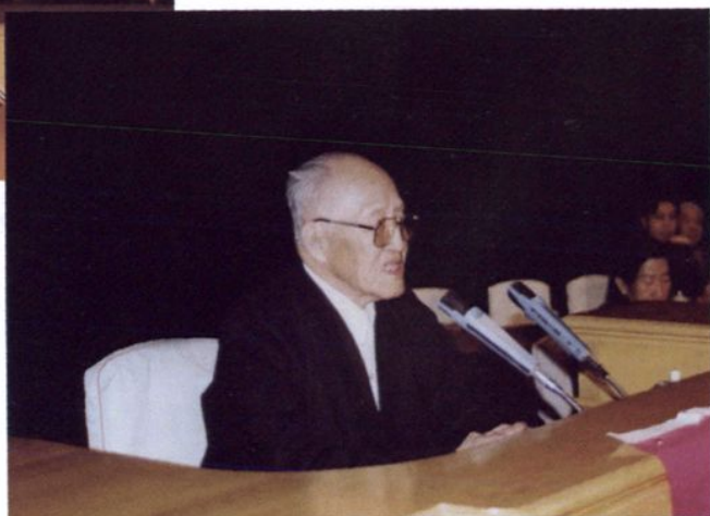
1995年12月6日省委副书记曹伯纯在建校10周年庆祝大会上讲话。 ◀