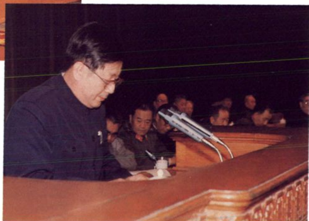
省委副书记孙奇在建校三周年大会上讲话。