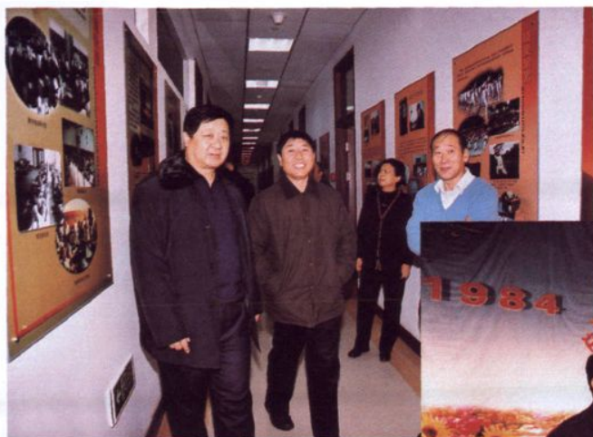
2004年12月7日省委组织部副部长王业卿(中)来校视察并观看图片展。