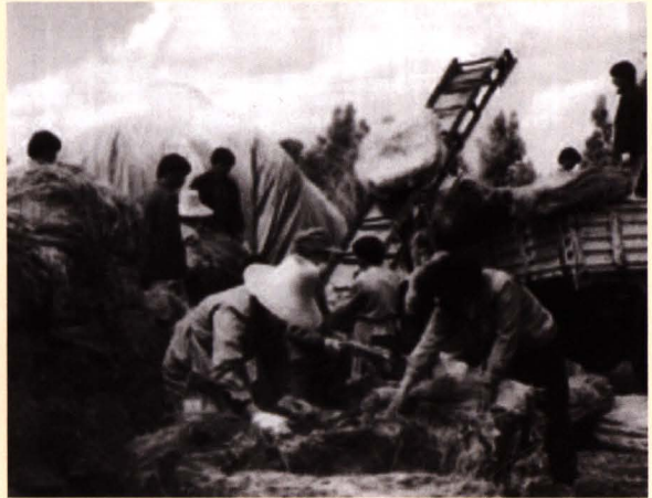
■ 昆明烟叶复烤二厂职工在货场堆码烟包