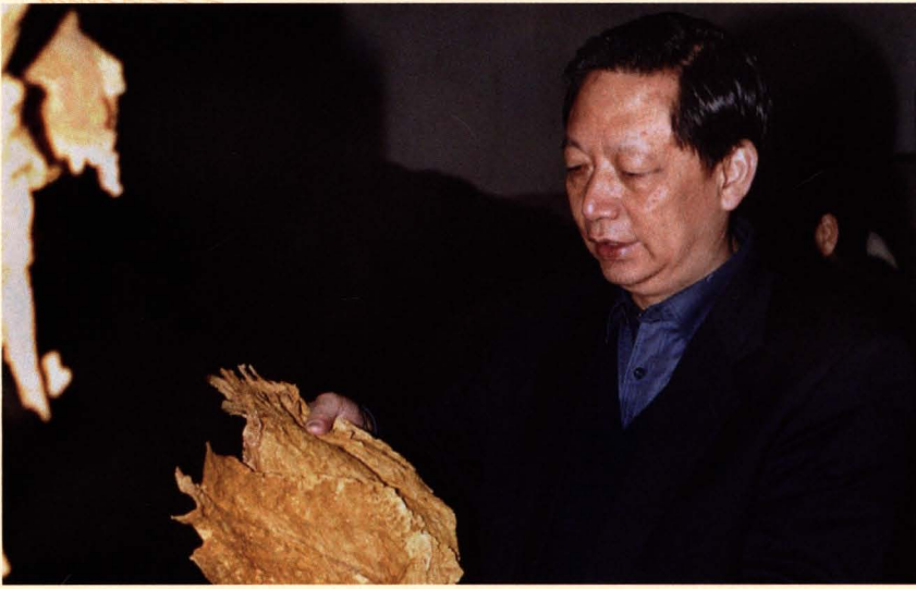
■ 国家烟草专卖局局长姜成康到公司视察