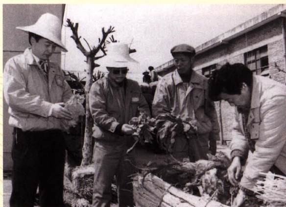
■ 昆明烟叶复烤二厂领导到储烟货场检查烟叶质量