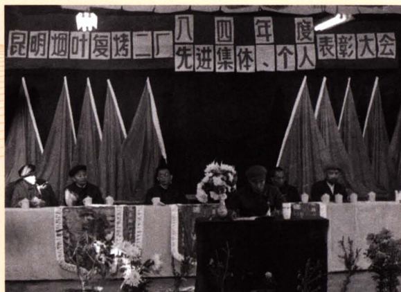
■ 昆明烟叶复烤二厂1984年度先进集体、先进个人表彰大会现场