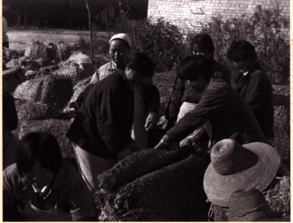
■ 职工在货场捡烟打包