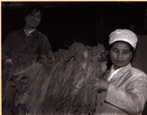
■ 串烟（图为：20世纪80年代，职工在串烟挂杆复烤）