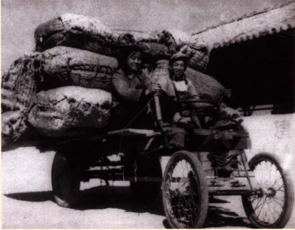
■ 昆明烟叶复烤二厂职工在货场运烟包途中