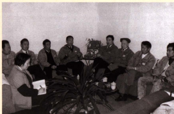
■ 昆明烟叶复烤二厂领导开会