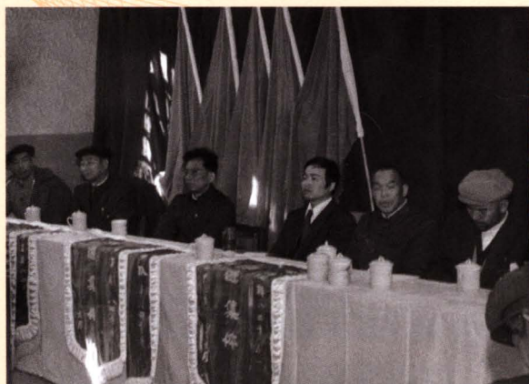
■ 20世纪80年代中期昆明烟叶复烤二厂大会会场