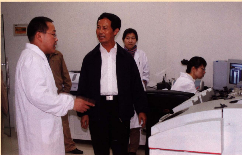
■ 原国家烟草专卖局副局长杨传德到公司视察工作