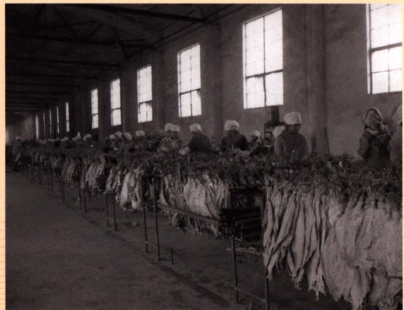
■ 摆烟把（图为：20世纪80年代复烤车间一角）