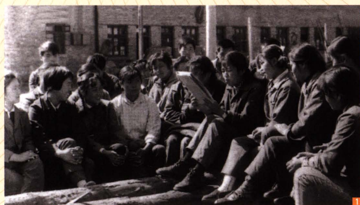
■ 1 20世纪80年代初，职工在货场组织学习