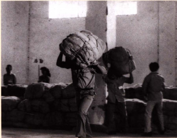
■ 20世纪80年代初，职工肩扛搬运烟包