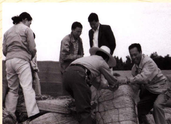
■ 昆明烟叶复烤二厂领导和职工搬烟包