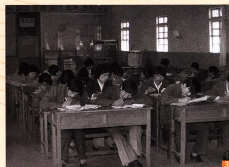
■ 3 昆明烟叶复烤二厂职工技术培训考试