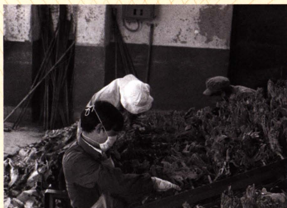
■ 昆明烟叶复烤二厂职工分拣烟叶