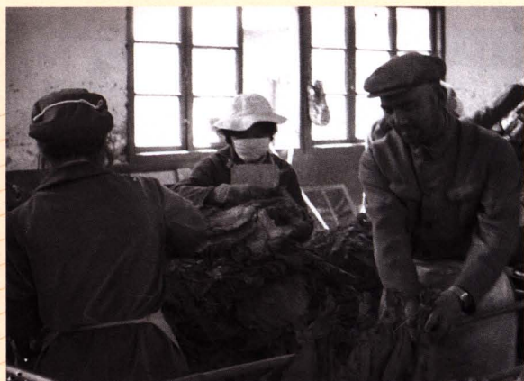
■ 昆明烟叶复烤二厂领导下车间与职工一起挂烟叶