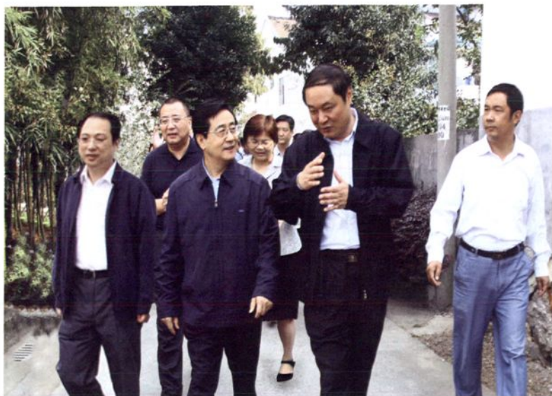
2008年10月17日，中共浙江省委书记赵洪祝（前左二），在省委常委杭州市委书记王国平（后左一）、省民政厅厅长吴桂英（后左二）、临安市委书记邵毅（前右二）、市长王宏（前左一）陪同下，在锦城街道横街村调研。