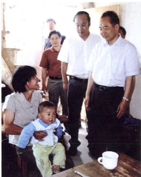
2006年5月，浙江省副省长王永明（右一），在昌北地区看望华光潭梯级水电站水库移民。