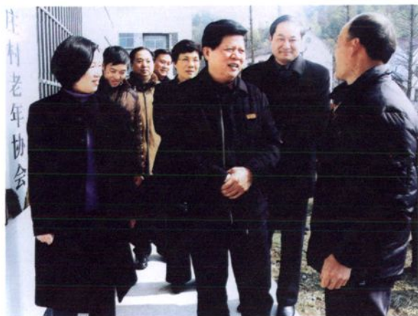
2008年2月20日，中共杭州市委副书记王金财（左二）、市委常委组织部长于跃敏（后右二），由临安市委书记邵毅（后右一）、市长王宏（后左二）陪同，在太阳镇调研村级组织换届选举工作。