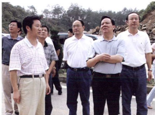
2005年9月3日，昌化、昌北部分地区遭遇特大暴雨袭击。5日，杭州市市长孙忠煊（前右一）由临安市委书记王坚（后右一）、市长方建生（后右二）陪同，在昌化镇视察灾情，指导抗灾救灾工作。