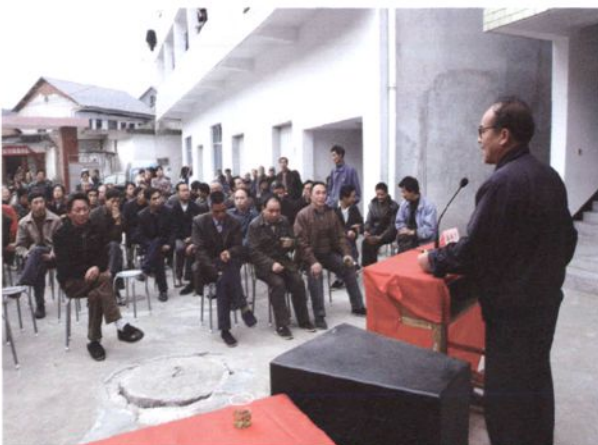
2008年4月1日，太阳镇景村村民委员会换届选举，竞选者在“自荐”与“竞职演讲”。