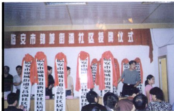
2002年8月20日，锦城街道举行11个社区授牌仪式。