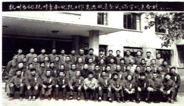
1982年10月，临安县出席杭州市优抚对象和优抚工作先进代表会议的代表合影。