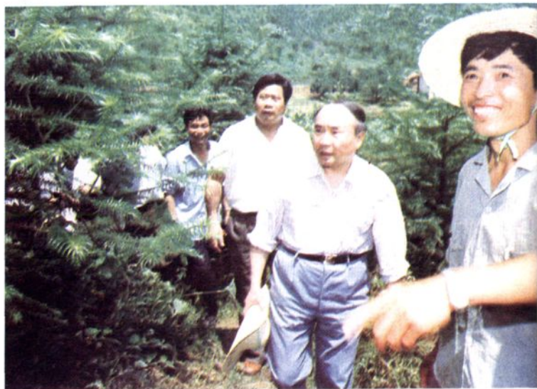
1993年7月8日，中共浙江省委书记李泽民（前右二）在县委书记管竹苗（右三）陪同下，调研横畈农村扶贫工作。

1999年6月27日，临安遭受洪灾期间，中共浙江省委书记张德江（左二）、省委副书记兼杭州市委书记李金明（左一）在临安市委书记谢春山（右二）、市长张建华（二排右二）陪同下，察看灾情，并在青山水库检查汛情。