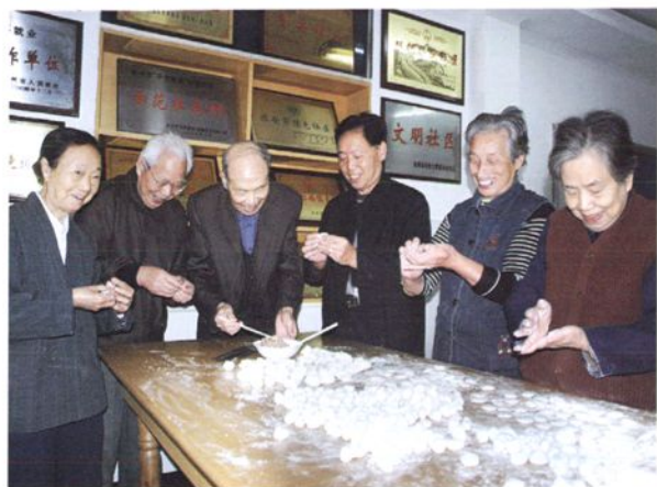
2007年“九九”重阳节，文昌阁社区的工作人员和独居老人一起包饺子，共庆节日。