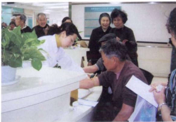
2007年4月，锦城街道文昌阁社区组织老年人体检。