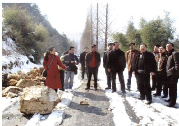
2008年2月4日，市委副书记、市长王宏（前右二）在高后线（高乐至后渚桥）太湖源镇碧淙段视察，指导因雪灾导致山体滑坡灾情处理工作。