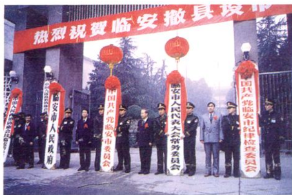
1996年12月28日，临安撤县设市换牌仪式在市人民政府大门前隆重举行。