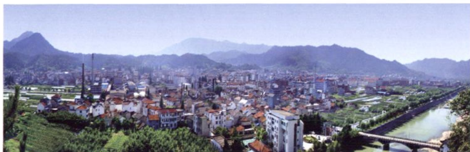
於潜镇（原於潜县治）