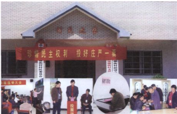
2008年4月，锦城街道横街村村民投票选举村民委员会和村经济合作社领导班子成员。