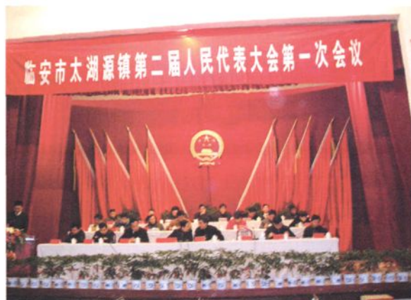
2007年3月，太湖源镇第二届人民代表大会第一次会议隆重举行，选举镇人民政府镇长、副镇长。