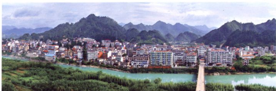
昌化镇（原昌化县治）