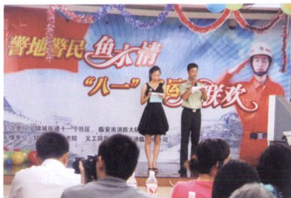
2006年，锦城街道11个社区和武警市消防大队共同举办庆“八一”建军节联欢会。