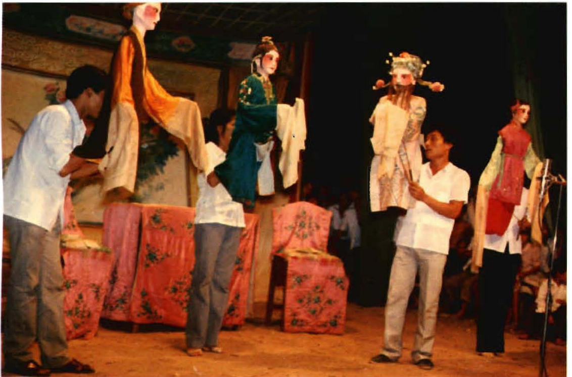
图为临高木偶剧团在演出