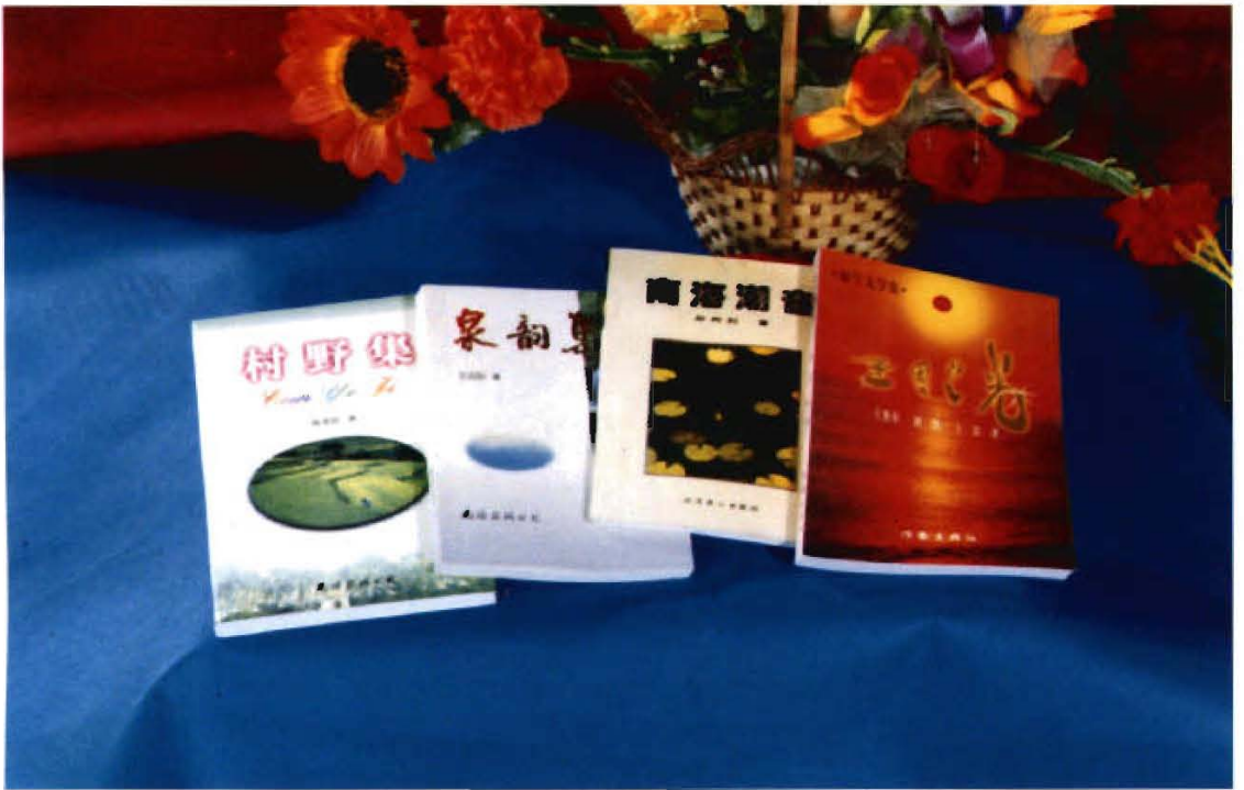
图为陈苏厚著的杂文集《村野集》，王应际著的诗集《泉韵集》，郑邦利著的诗集《南海潮音》，王贵章、唐凯、王宏著的报告文学集《圣园之光》