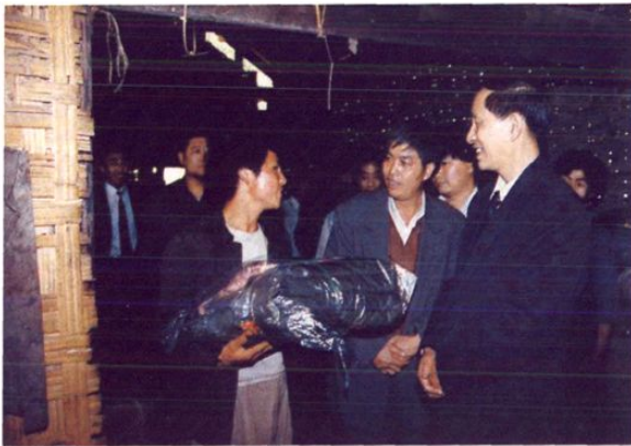
1997年3月30日,总行党组成员、副行长王文飞(右一)一行到贵州调研。当晚,省领导吴亦侠、王广宪、张佩良在贵州饭店会见王文飞副行长一行,双方就扶贫工作进行了交谈。4月2日,王文飞副行长一行深入到紫云县贫困农户家送温暖,鼓励贫困农户自立自强。右图为总行副行长王文飞代表总行向贫困农户捐赠物品。