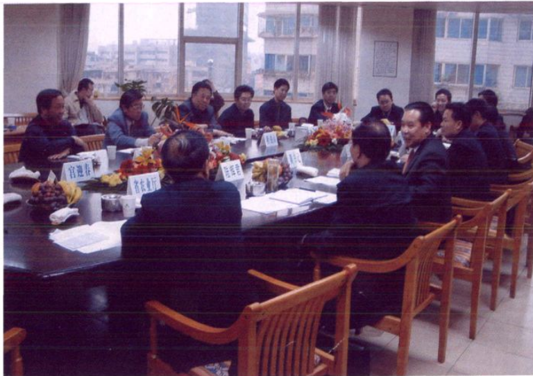
2003年4月,省委副书记黄瑶(左三)及省政府副秘书长、省直有关部门负责人应省分行邀请,前来省分行办公大楼会议室与总行副行长尉士武一行座谈。