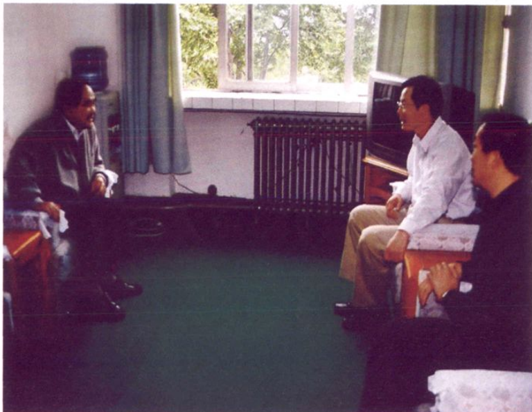
2003年5月，省委副书记、省长石秀诗（左一）与总行副行长刘梅生（左二）座谈，要求农发行在支持西部大开发中更好地发挥政策性银行作用。