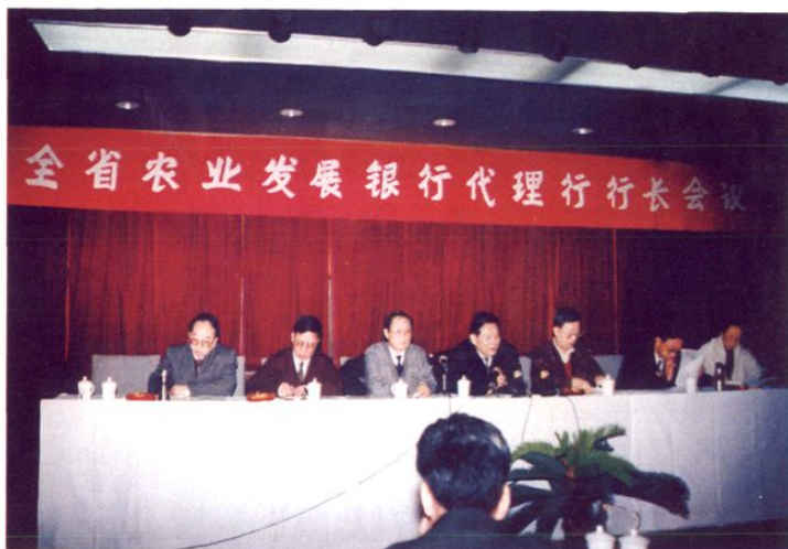
1996年2月1日，省委常委、副省长袁荣贵(左四)出席全省农发行代理行行长会议。