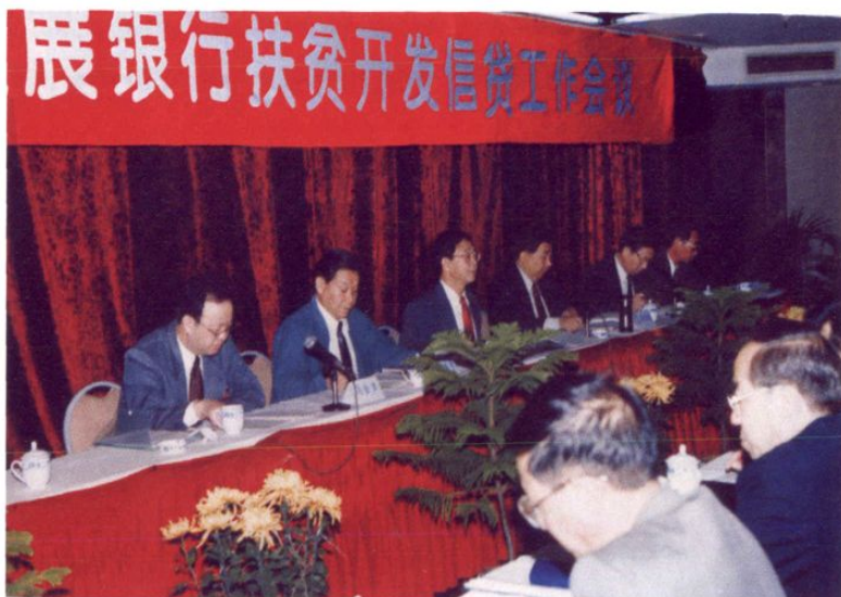
1996年10月31日，省委副书记、代省长吴亦侠（左四）、省委常委、副省长袁荣贵（左二）出席中国农业发展银行在贵阳市召开的全国扶贫开发信贷工作会议。主席台就座的还有总行行长朱元樑（左三）、副行长马金声（左一）等。