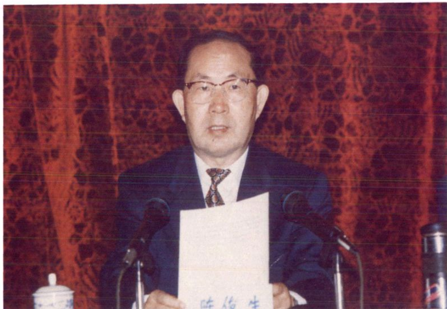
1996年10月31日至11月1日，中国农业发展银行在贵阳市召开全国扶贫开发信贷工作会议。国务委员、国务院扶贫开发领导小组组长陈俊生同志到会并作重要讲话。