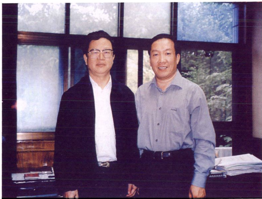
2003年6月11日，省委书记钱运录(左)听取农发行贵州省分行工作情况汇报后，对农发行在支持贵州农业和农村经济发展中所做的工作和取得的成绩给予了充分肯定，勉励贵州省农发行再接再厉，进一步加大对贵州农业和农村经济的支持力度，为贵州经济社会发展做出更大的贡献。