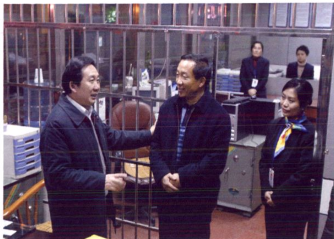
2004年12月31日，副省长顾庆金同志(左一)亲切看望农发行贵州省分行干部职工。