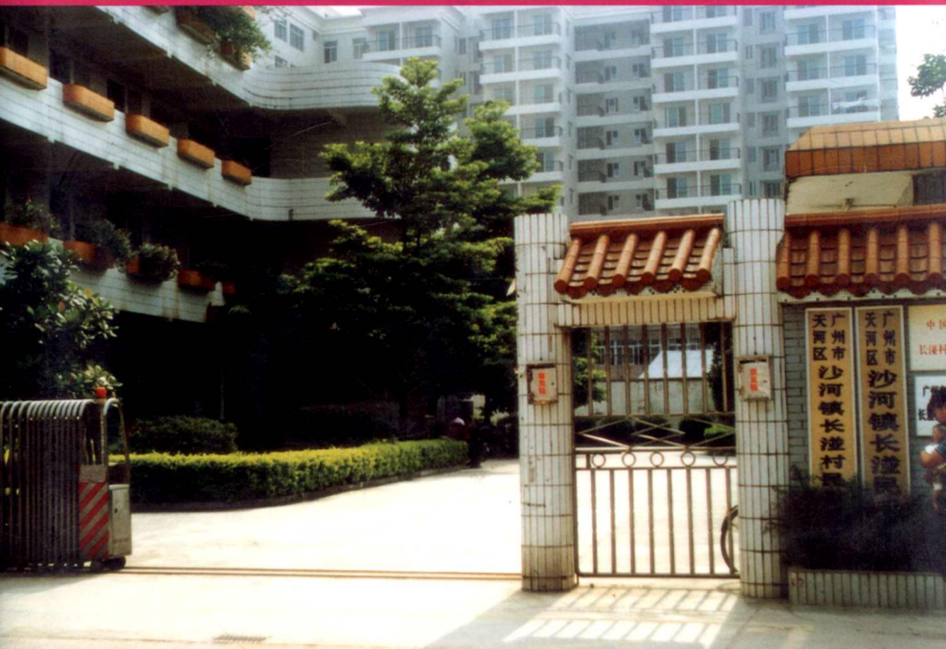
长湴村委会办公楼