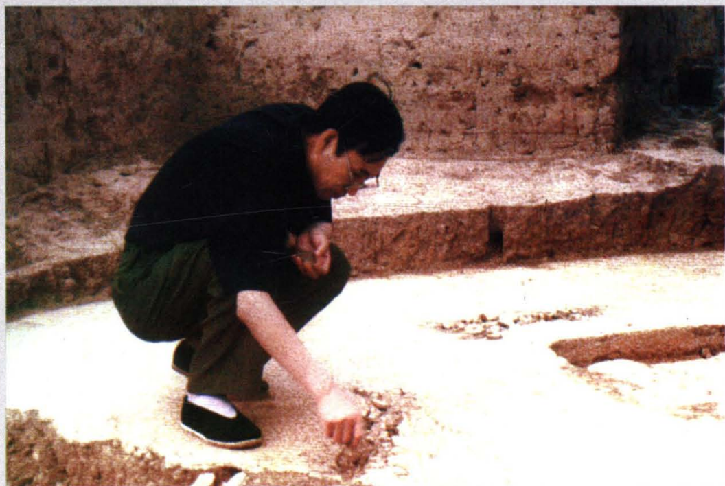
在陶寺考察古城址