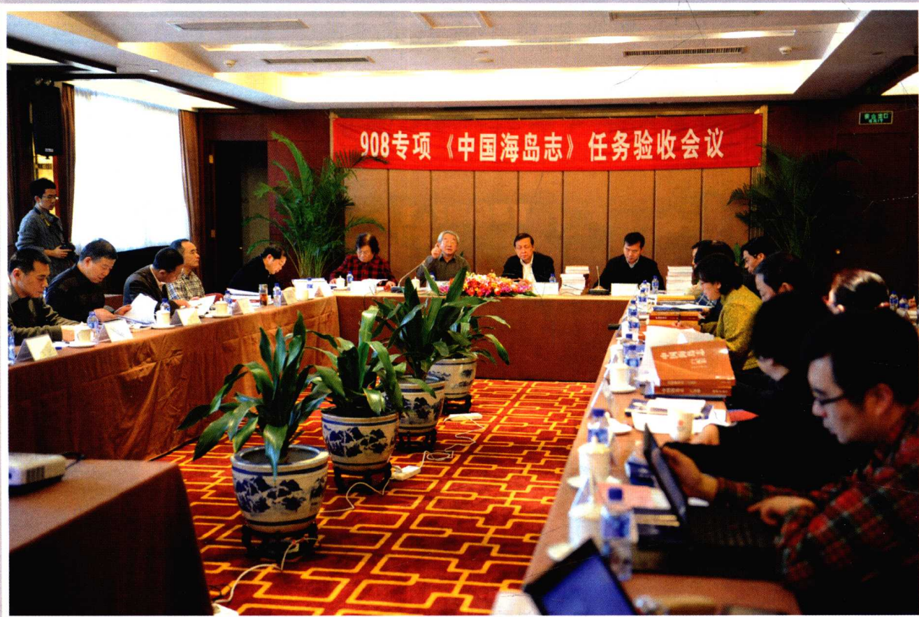
《中国海岛志》验收会议现场