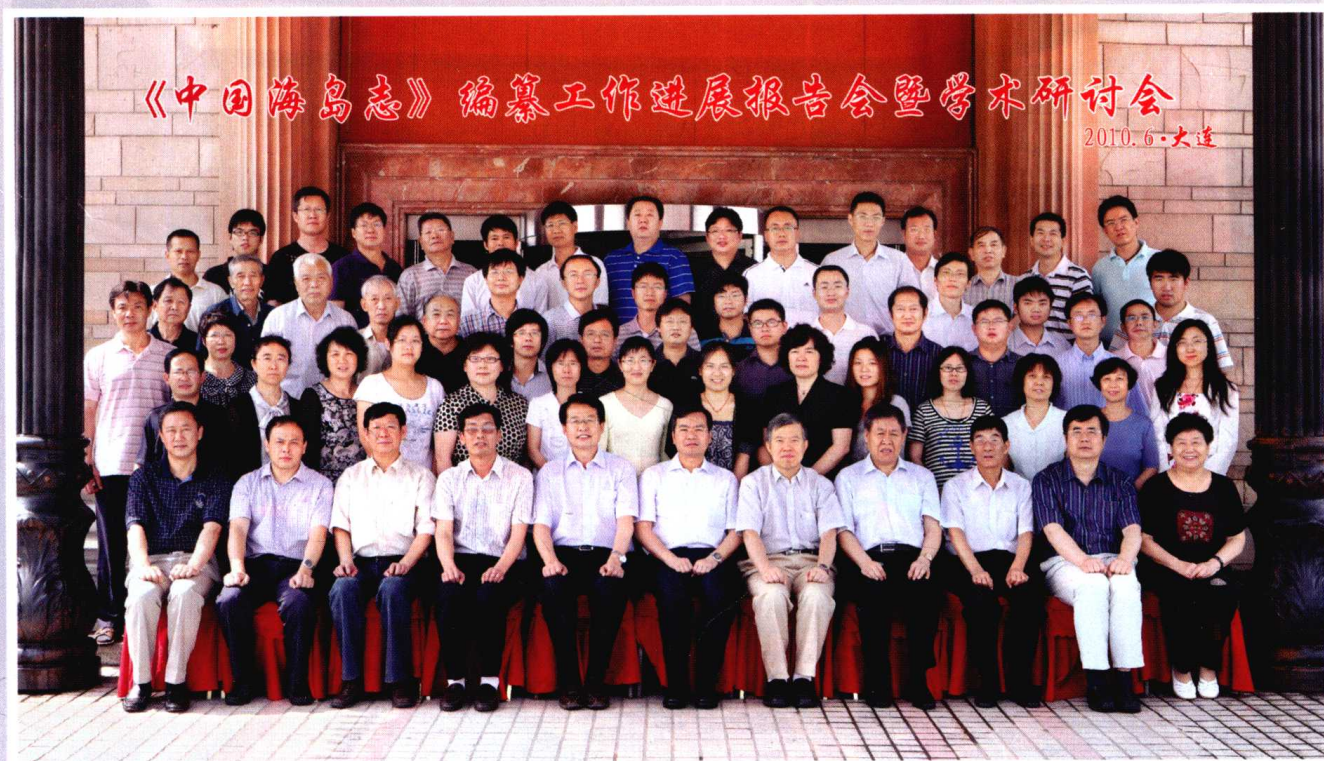
《中国海岛志》编纂工作进展报告会暨学术研讨会与会人员