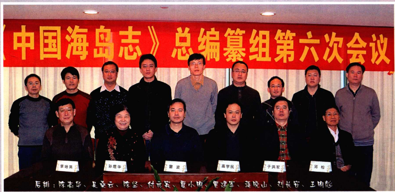
《中国海岛志》总编纂组第六次会议