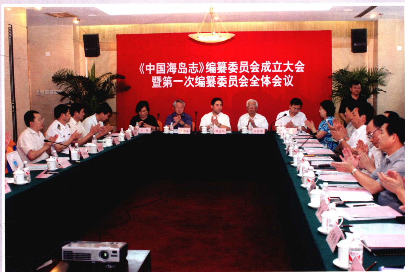
《中国海岛志》编纂委员会成立大会会议现场