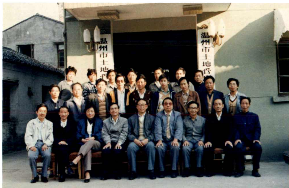
国家土地管理局局长王先进（前排左5）来温州调研土地使用制度改革