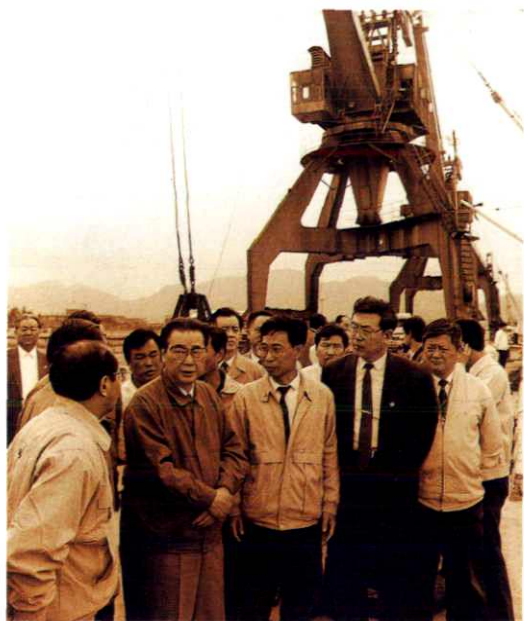
李鹏视察龙湾万吨级码头