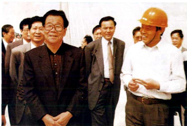
李瑞环视察温州大桥