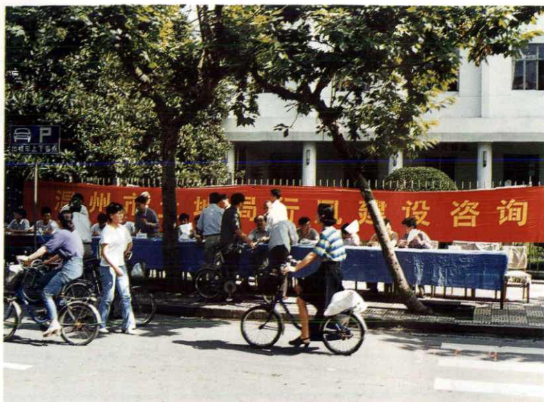
温州市土地管理局行风建设咨询活动