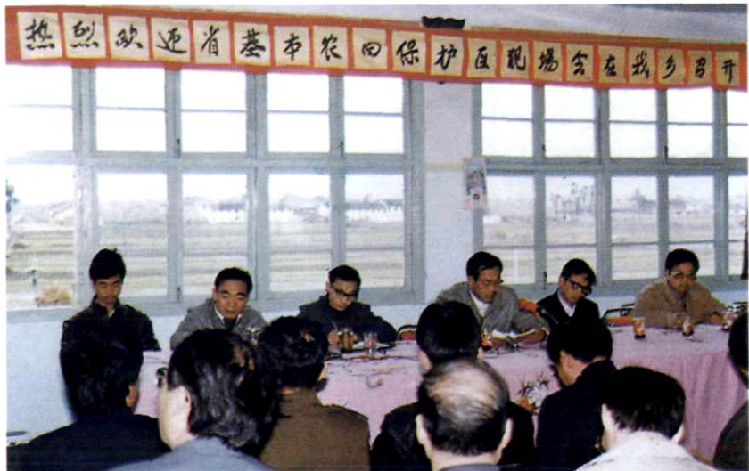
全省基本农田保护区现场会