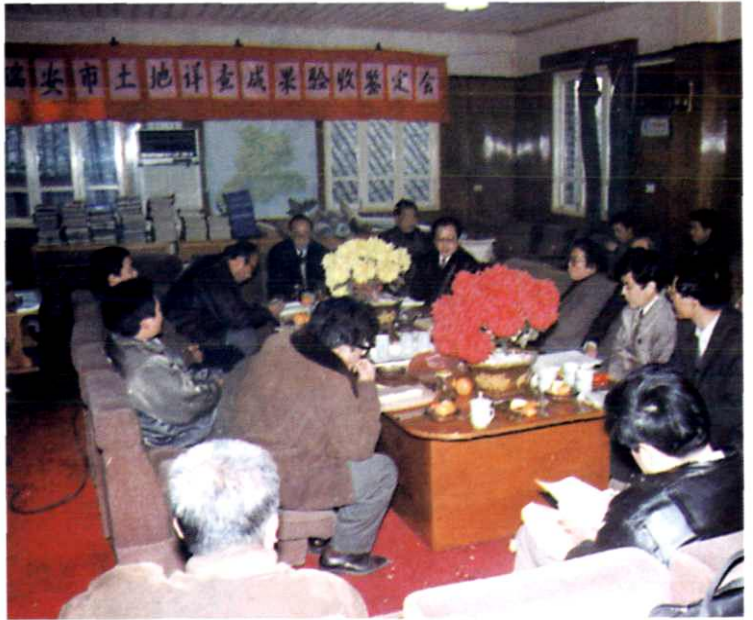
土地详查成果验收鉴定会