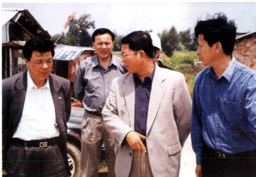
国土资源部副部长李元(右2)、省国土资源厅 厅长王松林(左1)和温州市长钱兴中(左2)视察 永兴土地整理工程