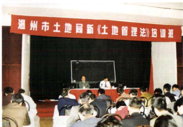
温州市土地管理局新 《土地管理法》培训班