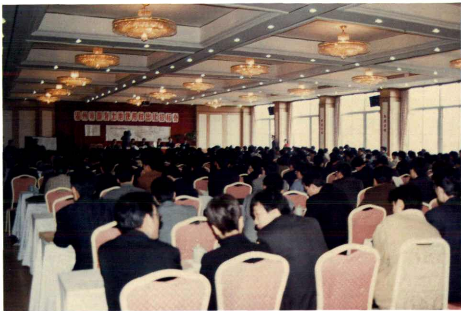
温州市土地管理局国有土地使用权出让招标会