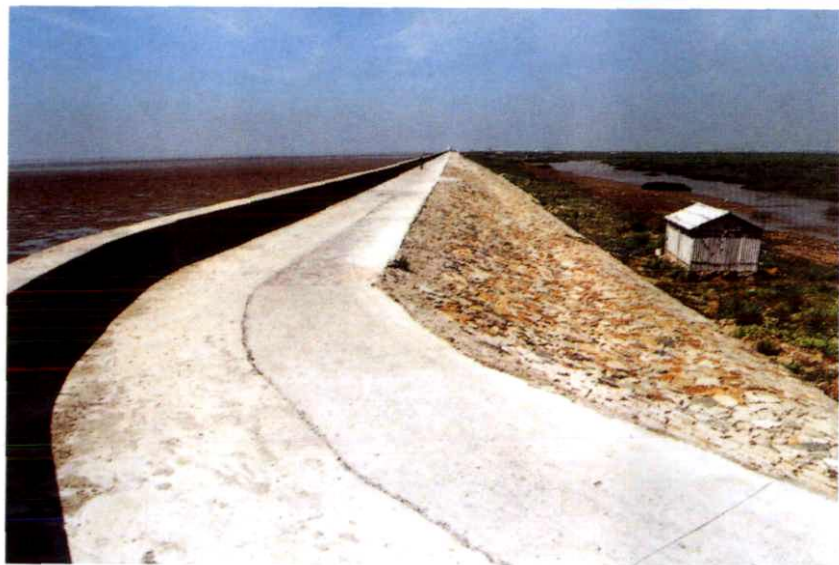
瑞安丁山促淤一期(梅头)围垦工程