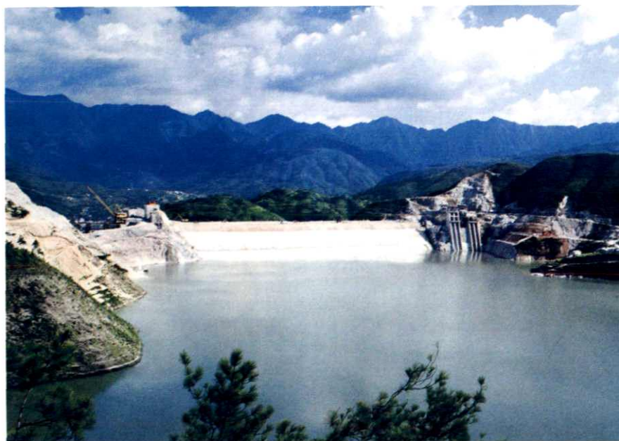
珊溪水利枢纽工程