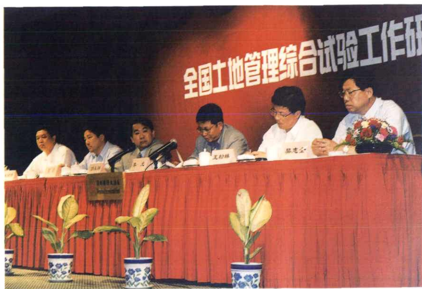
全国土地管理综合试验工作研讨会在温州召开 (右3为国土资源部李元副部长, 右2为省局王松林局长, 右6为市局朱铭源局长)