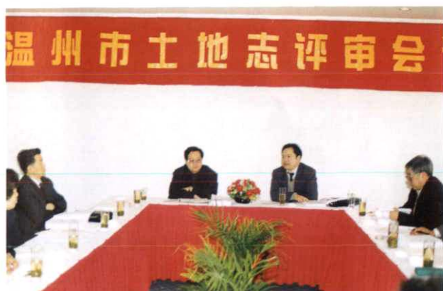
《温州市土地志》评审会