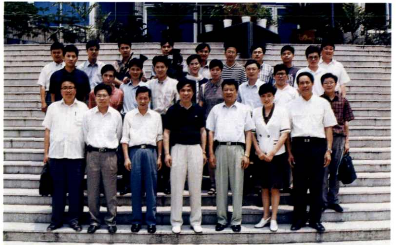
市局组织土地管理千里行新闻采访活动，全体成员合影于局大楼前