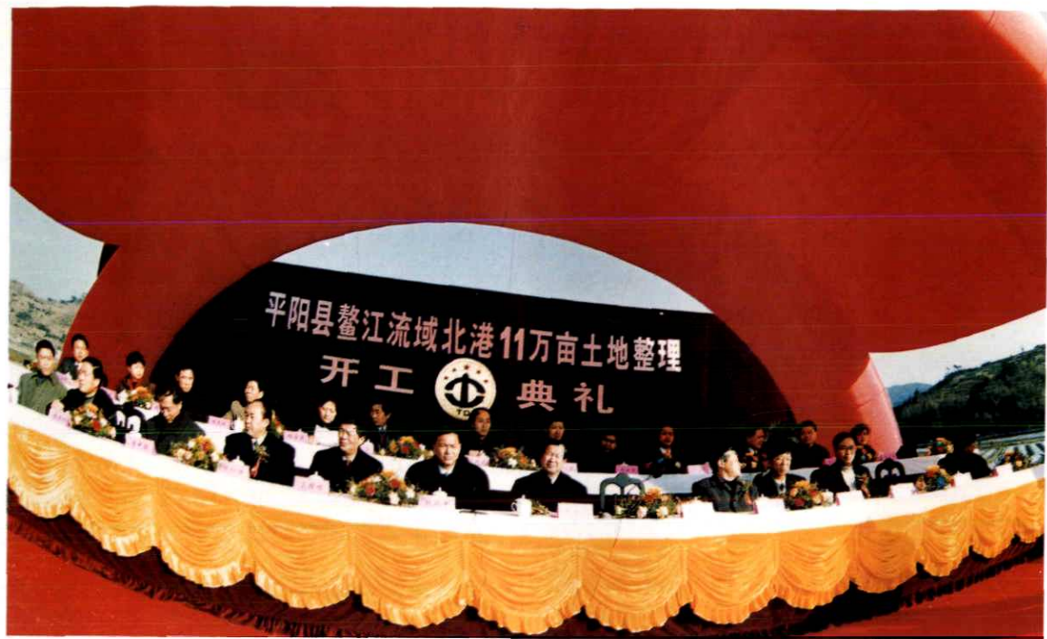
国家土地整理重点项目——平阳县鳌江流域北港 11 万亩土地整理工程开工典礼（右 5 为浙江省副省长章猛进，右 6 为温州市市长钱兴中，左 5 为浙江省国土资源厅长王松林）