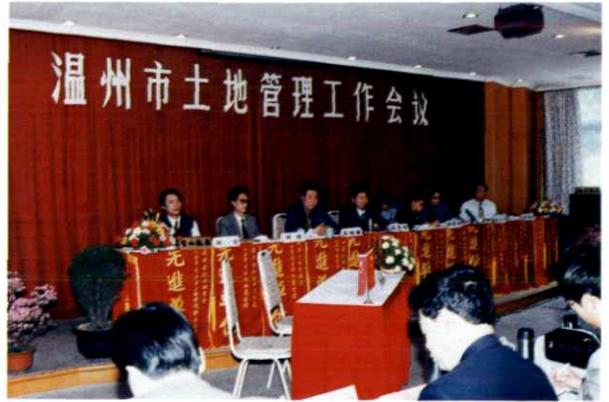
市土地管理工作会议并发奖