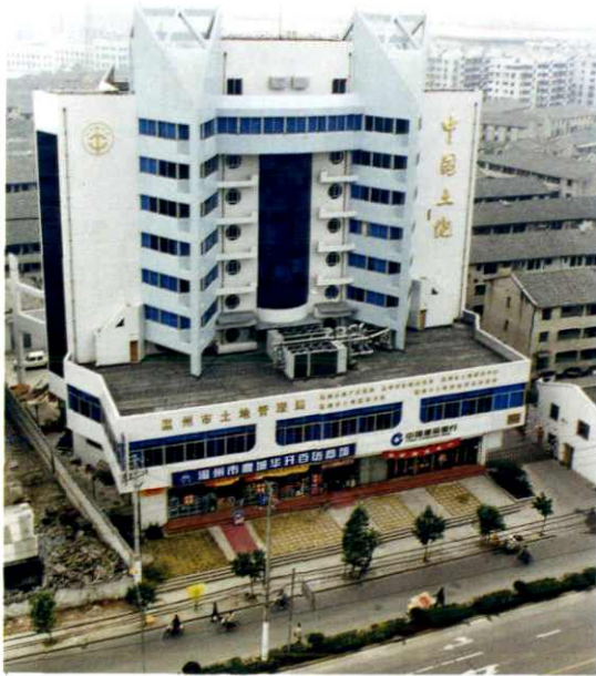
温州市土地管理局大楼