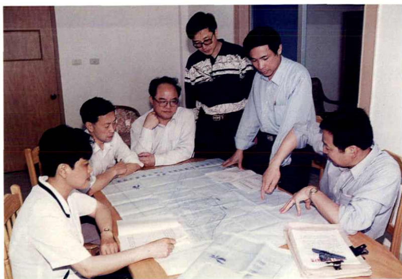
市局局长亲自主持建设用地项目会审