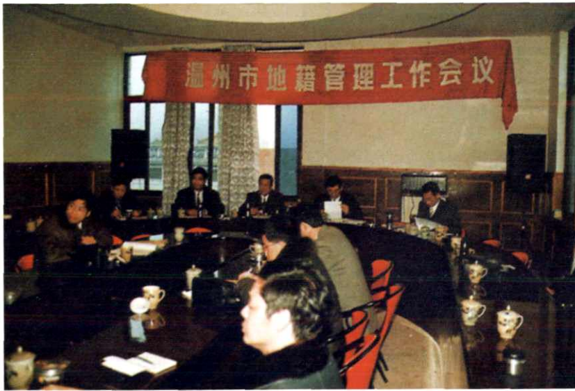
温州市地籍管理工作会议