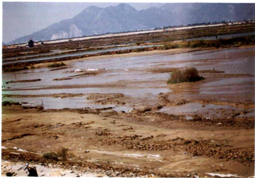
瓯海永兴围涂工程