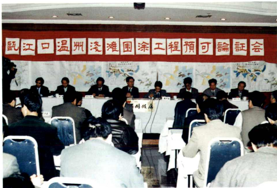
温州浅滩围涂工程预可行性论证会