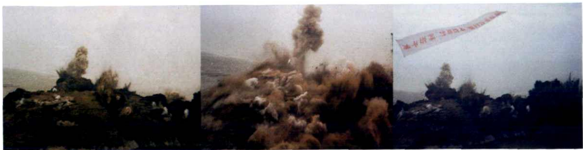
网鼻寮山爆破现场