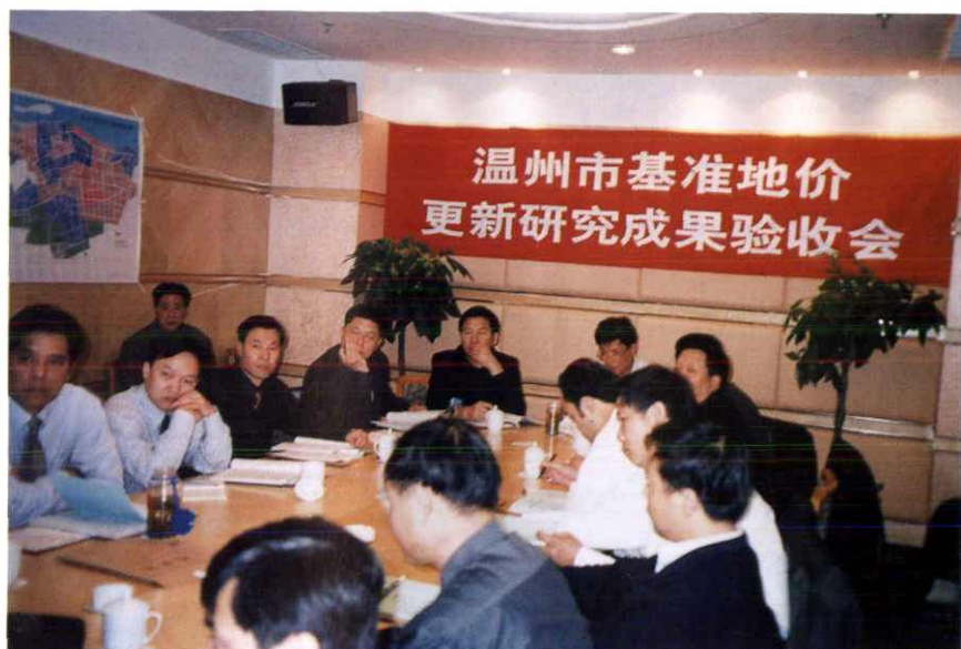
温州市基准地价更新研究成果验收会