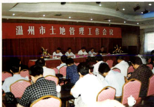
全市土地管理工作会议