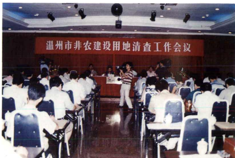
温州市非农建设用地清查工作会议