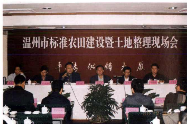
市标准农田建设暨土地 整理现场会