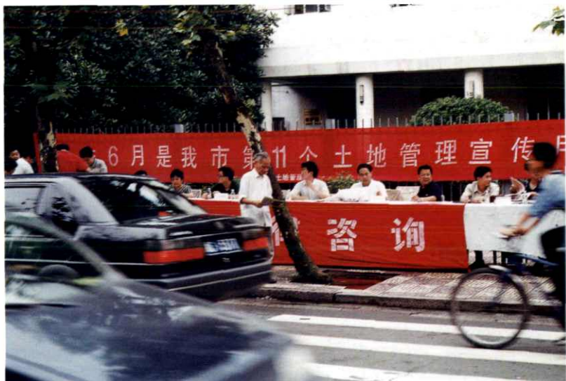
『6·25全国土地日』法律咨询活动