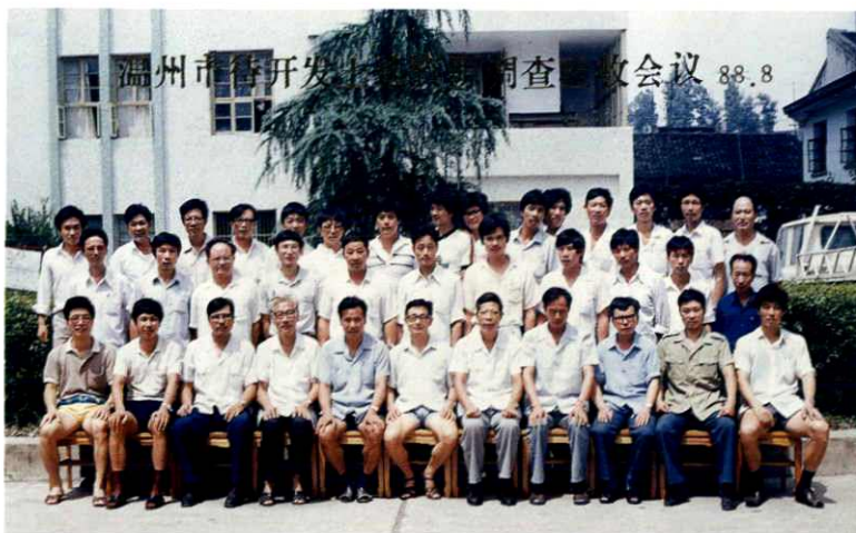
市待开发土地资源调查验收会议