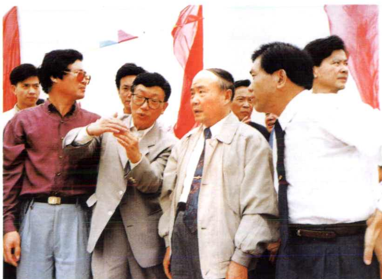
省领导李泽民(左3)、刘锡荣(左2) 等三次赴温州海塘视察