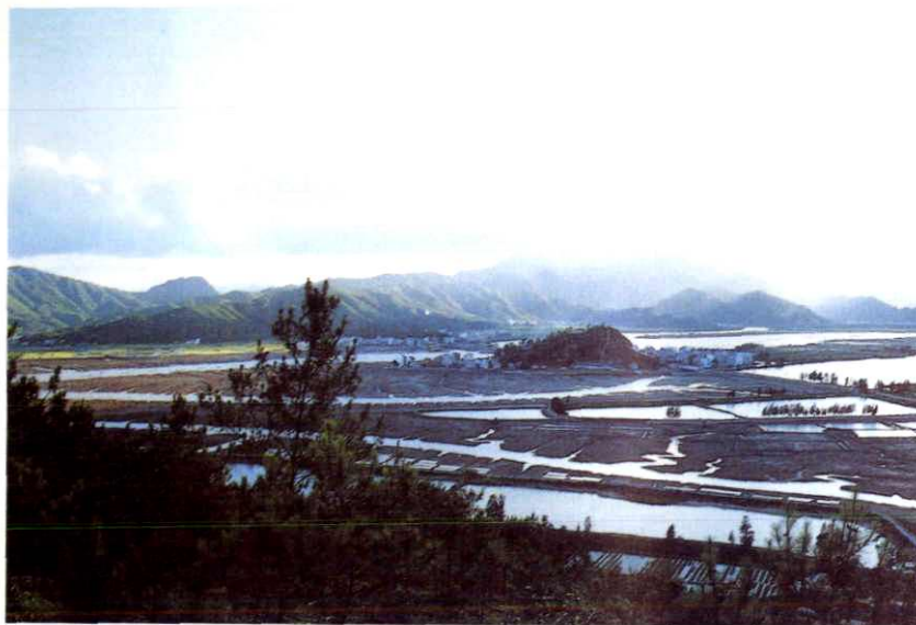
乐清方江屿堵港围垦