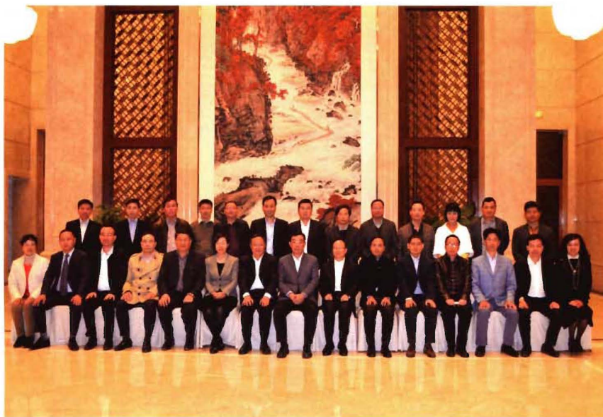
2015年11月11日下午,全国政协副主席、民建中央常务副主席马培华在宁波新芝宾馆召开调研座谈会,就“如何打造一批具有核心竞争力的创新型企业”听取会员企业家意见建议。图为马培华(前排中)与参会者亲切合影。