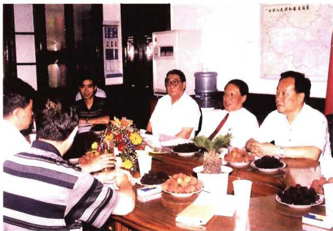
2000年6月22日,全国人大常委会副委员长、民建中央主席成思危(右二)到民建宁波市委调研,在机关会议室召开座谈会,听取工作汇报并给予指导,市委名誉主委朱尔梅(右三)坐在成思危旁边。