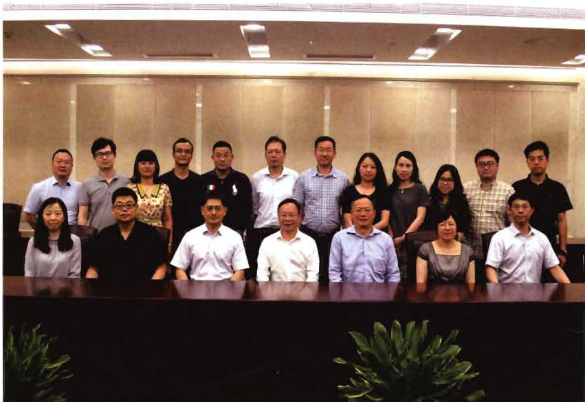
2016年6月8日,浙江省政协副主席、民建省委会主委陈小平来甬调研基层组织建设工作,走访高新区部分会员企业,并与高新区支部骨干会员开展了座谈交流。图为陈小平(前排中)与参会者合影。