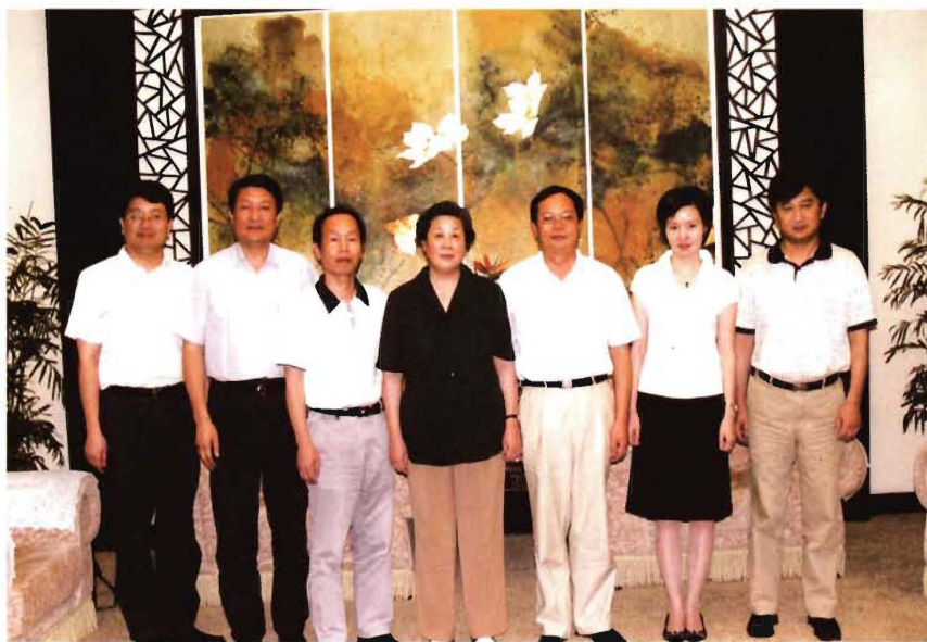
2007年7月17日,全国政协副主席、民建中央第一副主席张榕明在宁波新芝宾馆会见市委会领导成员,对班子建设提出讲团结、坚持民主集中制原则、加强四种能力建设等希望和要求。图为张榕明(中)与参会者合影。