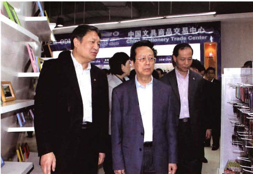
2014年4月16日-17日,全国人大常委会副委员长、民建中央主席陈昌智(中)在宁波调研,考察会员企业贝发集团股份有限公司。