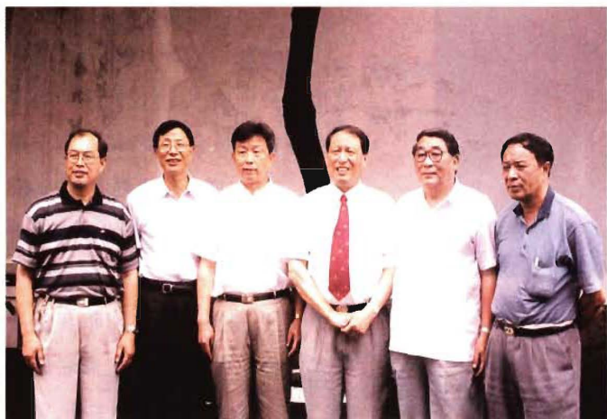
2000年6月22日,全国人大常委会副委员长、民建中央主席成思危在民建宁波市委调研时与参会者亲切合影,左起依次为:市委副主委陈继泰、汪闻鹤,主委项性平,主席成思危,市委名誉主委朱尔梅,副主委陈彤宇。

2003年9月9日晚,全国人大常委会副委员长、民建中央主席成思危(前排中),全国政协常委、民建中央常务副主席张榕明(前排右三),全国人大常委、民建中央副主席路明(前排左三),全国政协常委、民建中央副主席陈明德(前排右二),浙江省政协副主席、民建浙江省委会主委吴国华(前排左二)在新芝宾馆会见民建宁波市委会常委以上同志,并与大家合影留念。