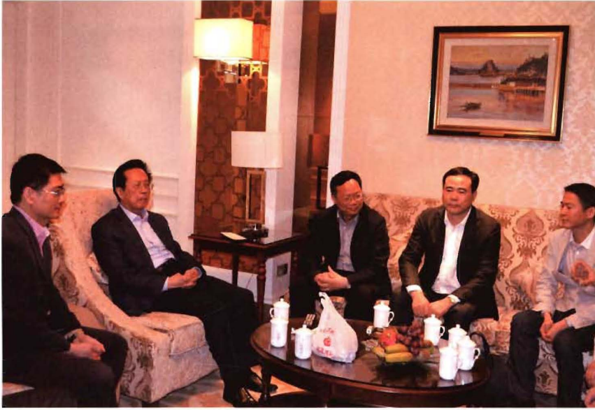
2014年4月16日-17日,全国人大常委会副委员长、民建中央主席陈昌智(左二)在宁波调研,会见市委会主委张明华、副主委兼秘书长张雨及会员企业家代表。