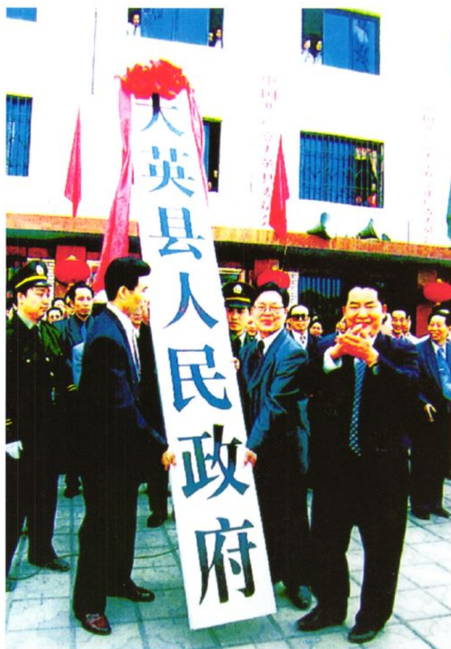
1998年4月8日，大英县人民政府经四个月筹建正式成立。