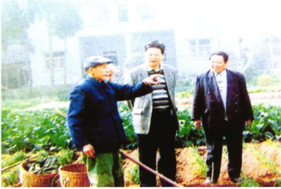
1998年8月，副省长欧泽高（中）考察大英受特大洪灾后生产自救情况