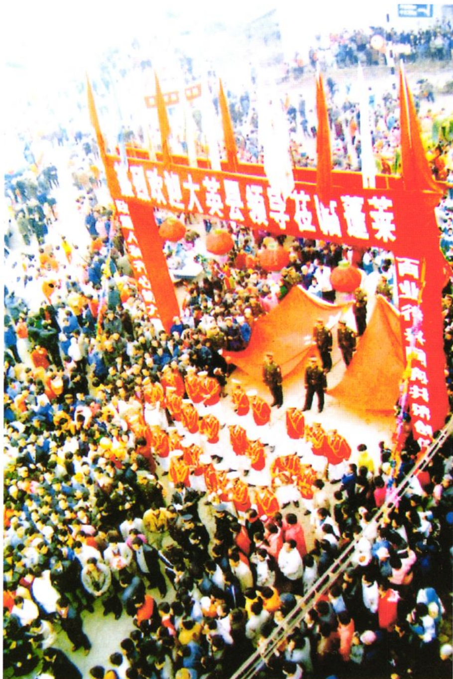
1997年12月28日，数以万计的大英人民走向街头，载歌载舞欢迎首批赴大英县工作的800多名干部职工。