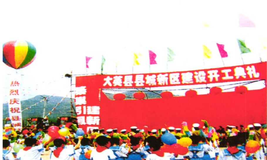
1998年6月16日，大英县新城区建设正式拉开帷幕。