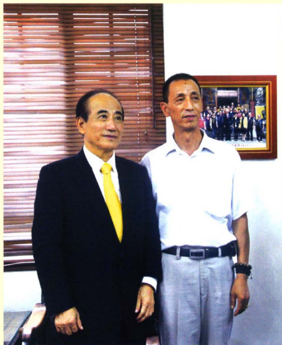
台湾立法院院长 王金平(左)与 曹俊平(右)合影