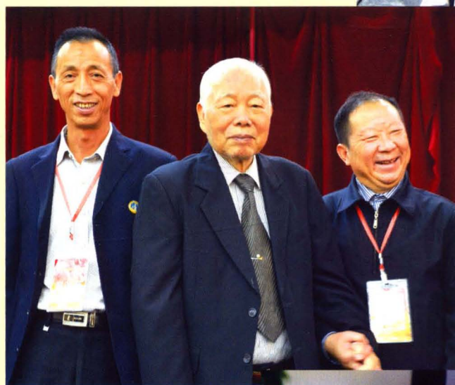
曹俊平(左)与全国政协副 主席张克辉(中)福建湄州 岛合影