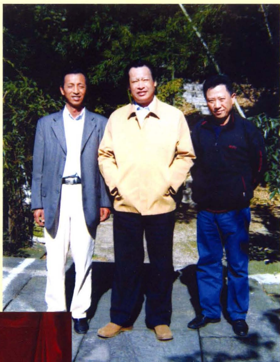
曹俊平与江西省省长吴新雄(中)在 马尾水景区状元桥上合影(右图)