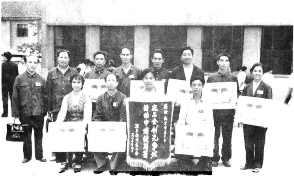
凯里市出席黔东南州工会创先争优活动表彰会代表