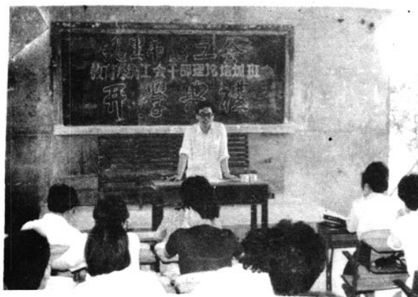
凯里市总工会举办工会干部理论培训班