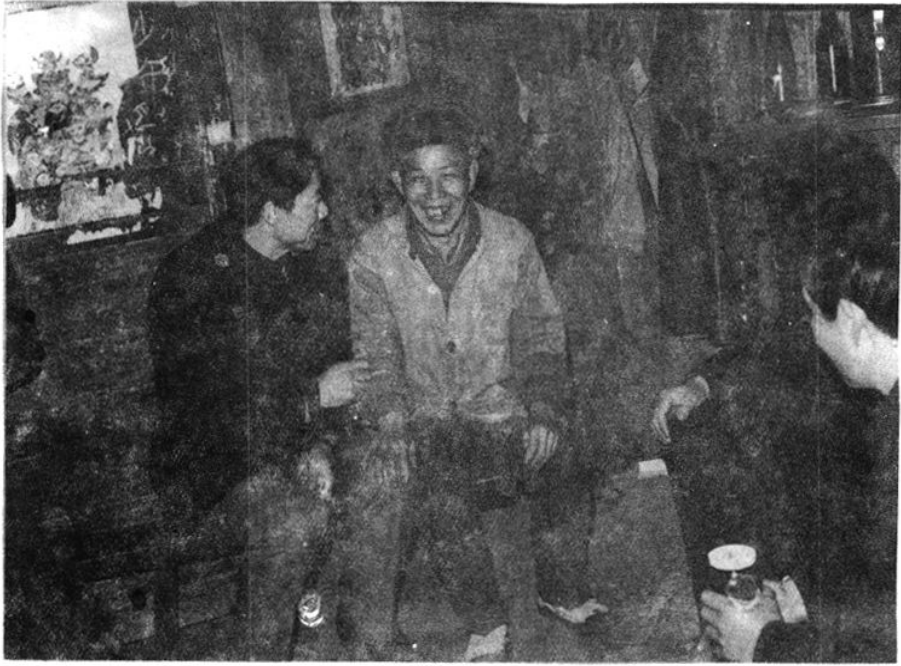
市总工会领导深入基层慰问特困职工