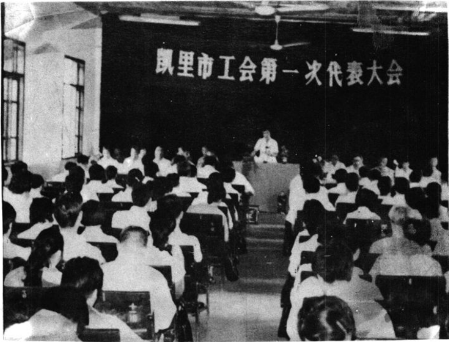
凯里工会第一次代表大会