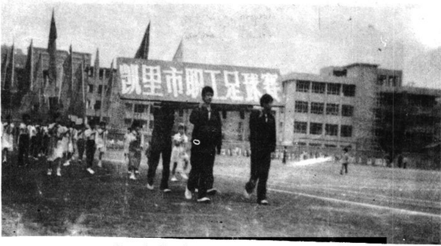
凯里市首次职工足球赛