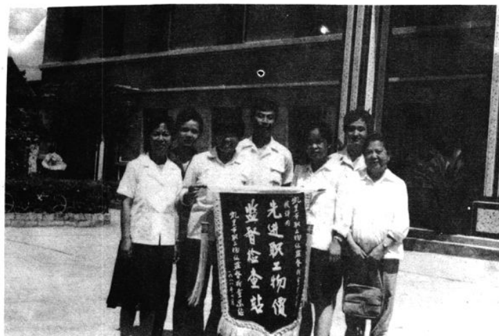
凯里市总工会表彰的先进职工物价站