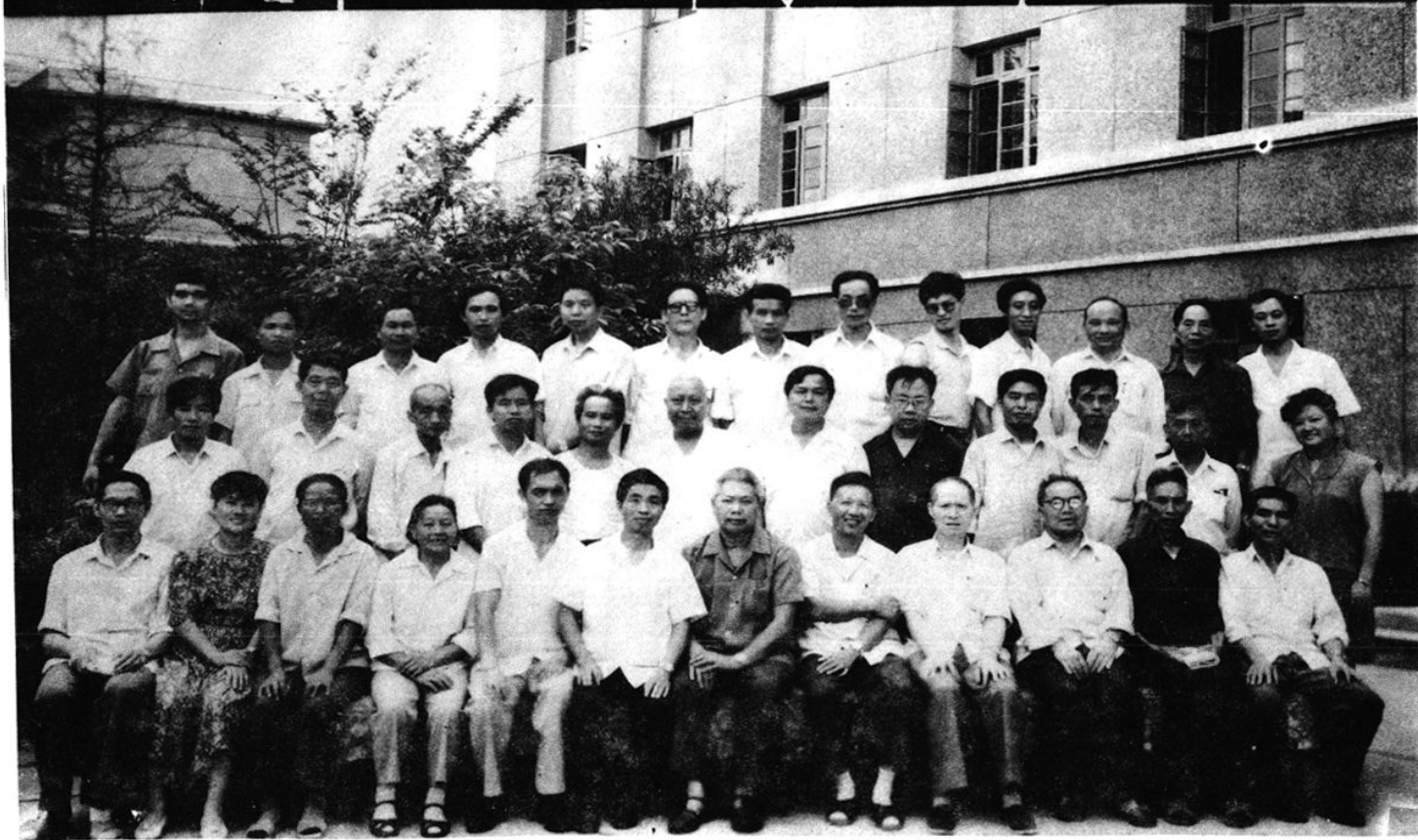
凯里市《工会志》审稿会全体同志