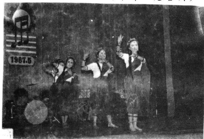
凯里市总工会举办的文艺调演