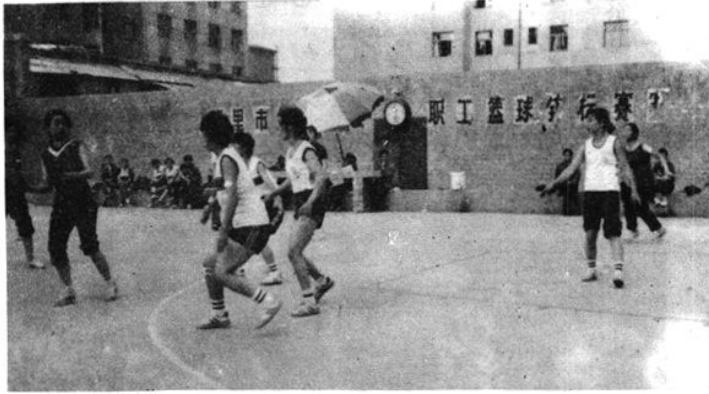
凯里市职工篮球赛