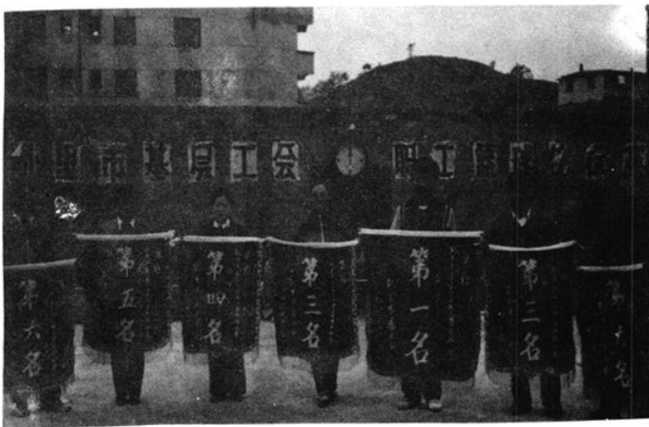
凯里市职工篮球赛发奖