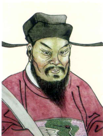
宋端明殿大学士邹应龙像 (泰宁旅游管委会供稿)