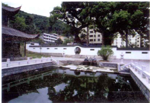
尤溪“半亩方塘”