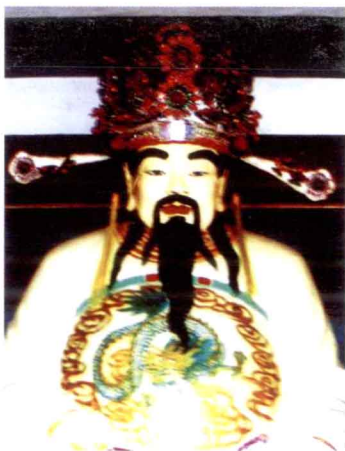
宋银青光禄大夫邓克谐 塑像