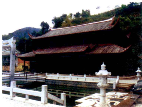
尤溪“半亩方塘” （严道明供稿）