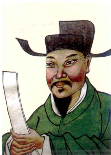
宋徽猷阁直学士叶祖洽像