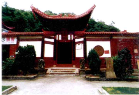
沙县将军祠（邢保兴供稿）