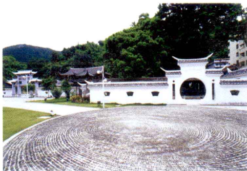
朱熹纪念馆