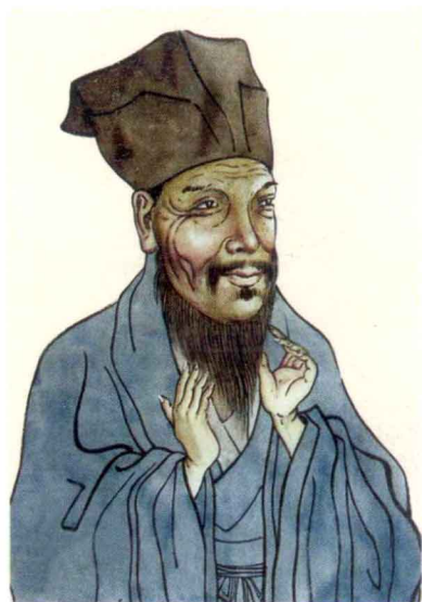
明永州知府何道旻像