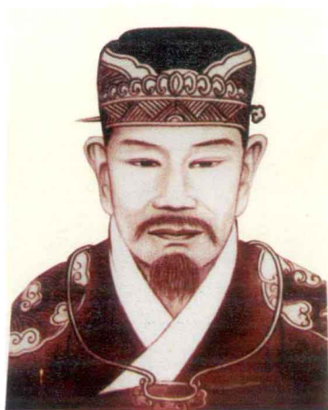
宋左正言邓肃像