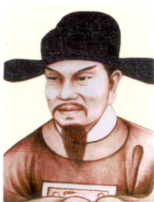
宋都察院佥御史邓文铿像 (邢保兴供稿)