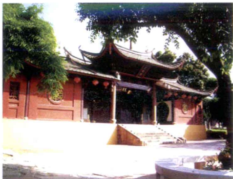
省级重点文物保护单位三 明“正顺庙”