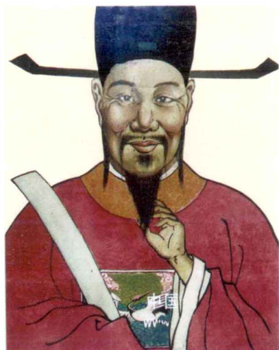
宋尚书右丞兼亲征行营使李纲像