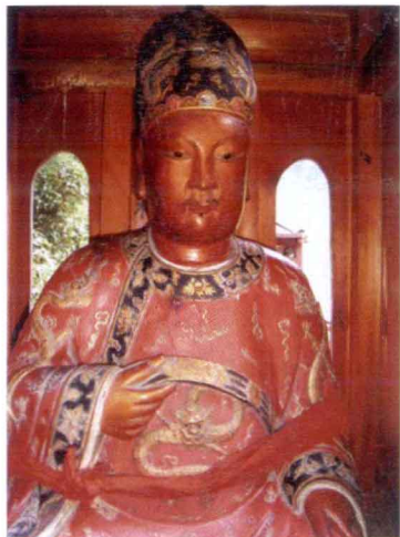
广惠将军显烈尊王谢佑塑像