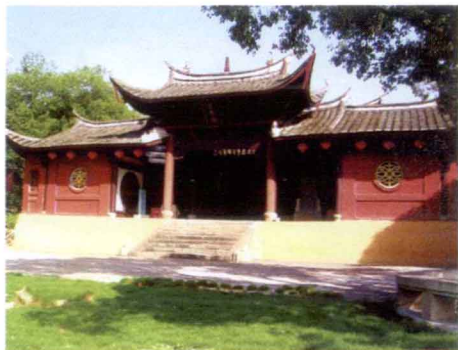
省级重点文物保护单位三 明“正顺庙”