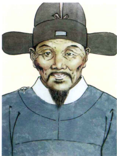
明太仆寺少卿江日彩像