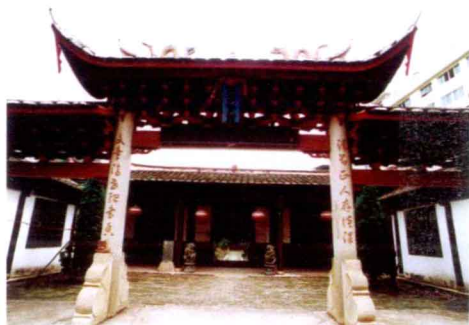
沙县豫章贤祠（邢保兴供稿）