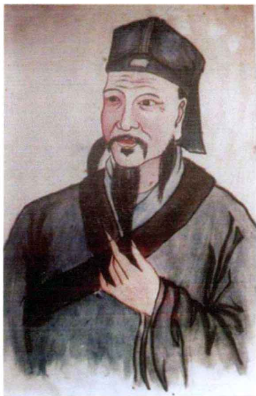
闽学鼻祖杨时像