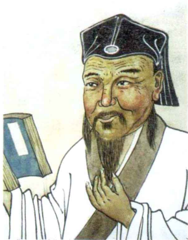
闽学鼻祖杨时像