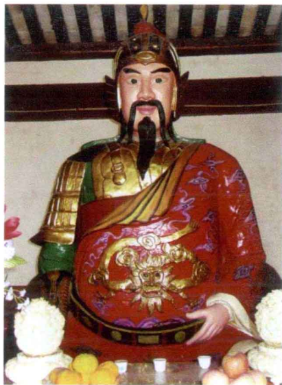
灵卫侯邓光布塑像