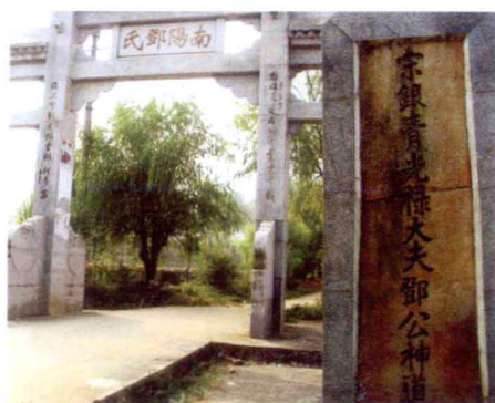
三元荆东邓氏牌坊