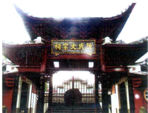
永安贡川陈氏大祠