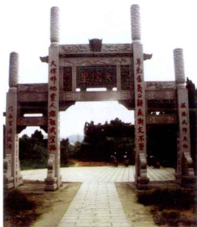
永安贡川“大儒里”（何团元供稿）