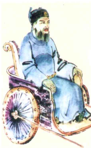
唐御史中丞陈雍像