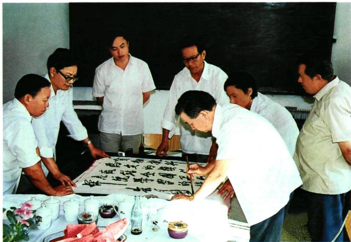
1987年8月25日,国家卫生部部长崔月犁视察兵团卫生防疫工作时为石河子卫生防疫站题词