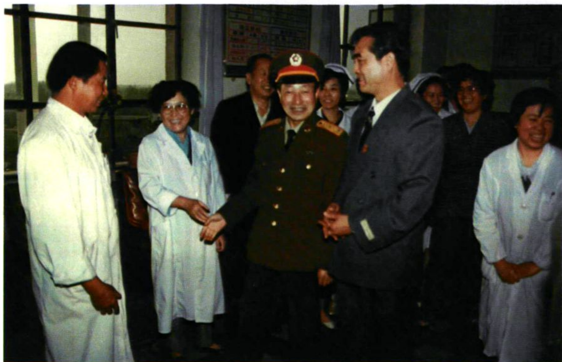
1995年10月4日,兵团政委王传友(前左三)视察农三师医院医疗工作