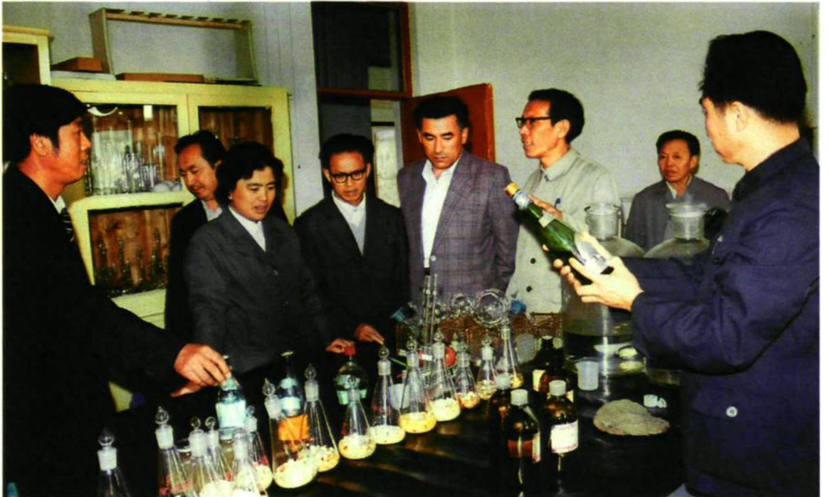
1986年9月9日,国家卫生部副部长何界生(前左二)在兵团卫生局局长汪艾翔(前左五)陪同下视察农八师卫生工作