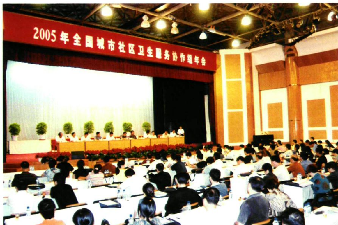
2005年8月1日,兵团承办的全国城市社区卫生服务协作年会在石河子市召开