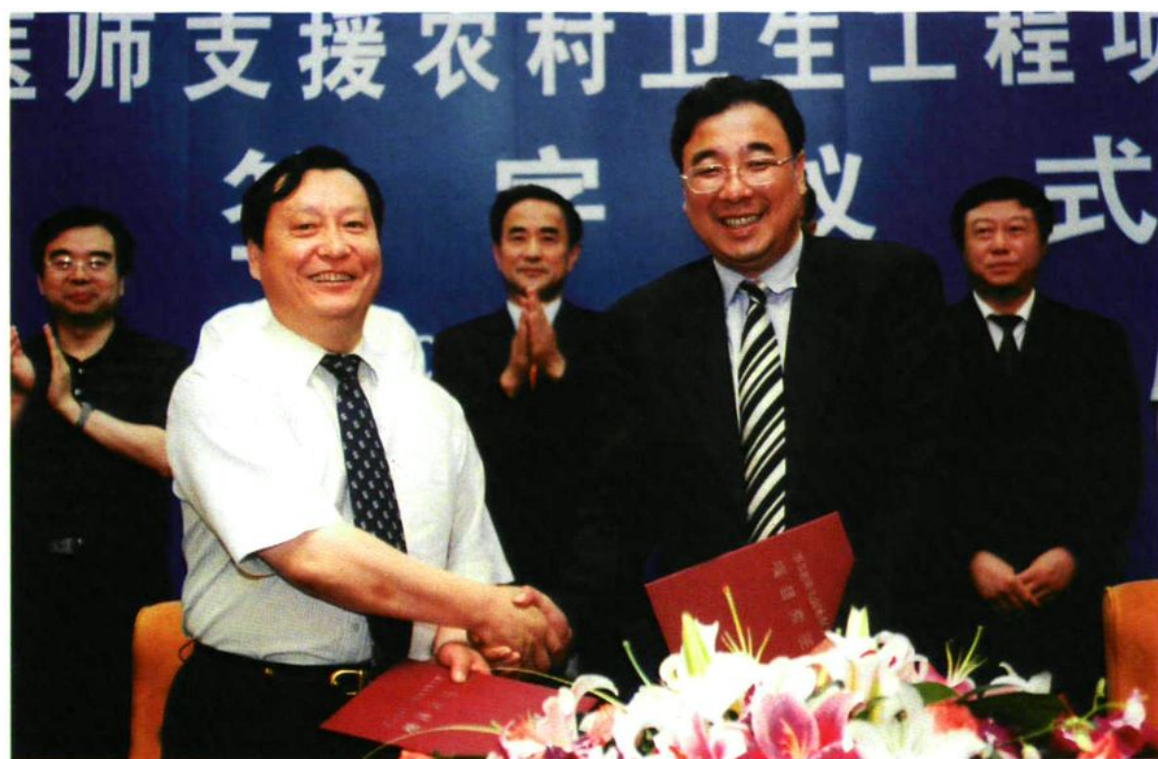
2005年7月,国家卫生部副部长马晓伟(前右一)与兵团卫生局局长王国建(前左一)签订医师支援兵团基层卫生工程项目责任书