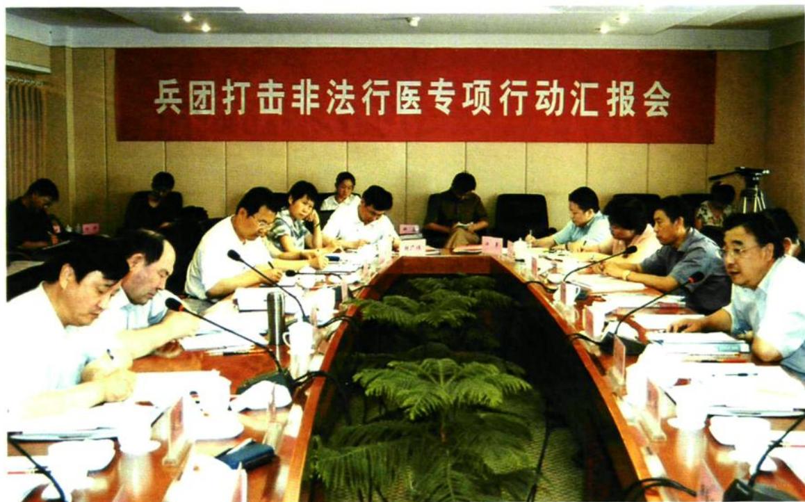
2005年7月4日,兵团在乌鲁木齐市召开打击非法行医专项行动汇报会,国家卫生部副部长马晓伟(右一)听取兵团副司令员阿勒布斯拜·拉合木(左二)、兵团卫生局局长王国建(左一)的工作汇报