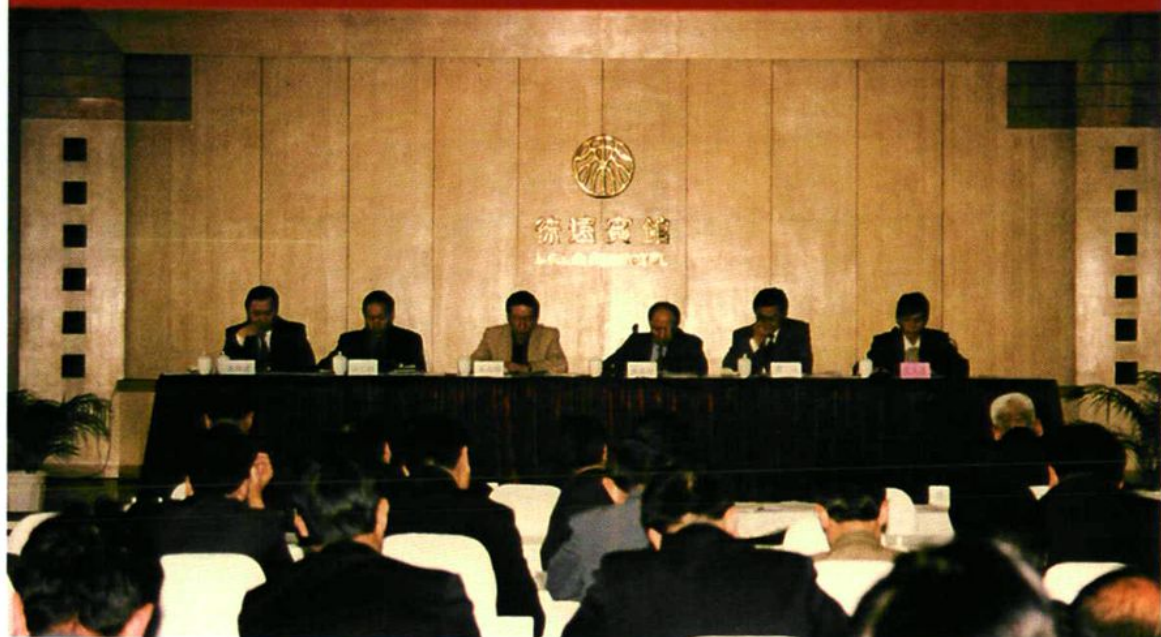
2000年3月,兵团卫生工作会议在乌鲁木齐市召开,部署兵团卫生改革与发展工作