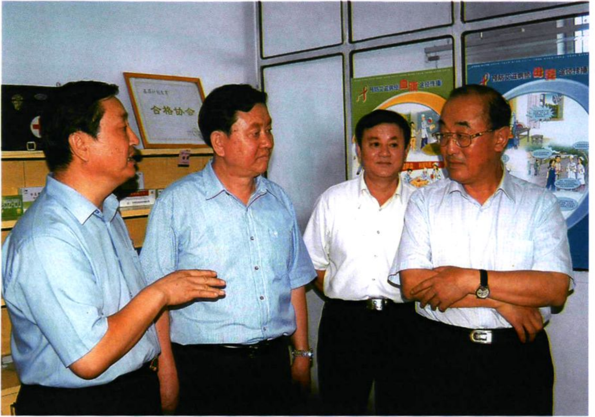
2005年8月19日,国家卫生部部长高强(右一)在兵团副司令员朱鉴凡(左二)陪同下视察兵团卫生工作,听取兵团卫生局局长王国建(左一)兵团工作情况汇报