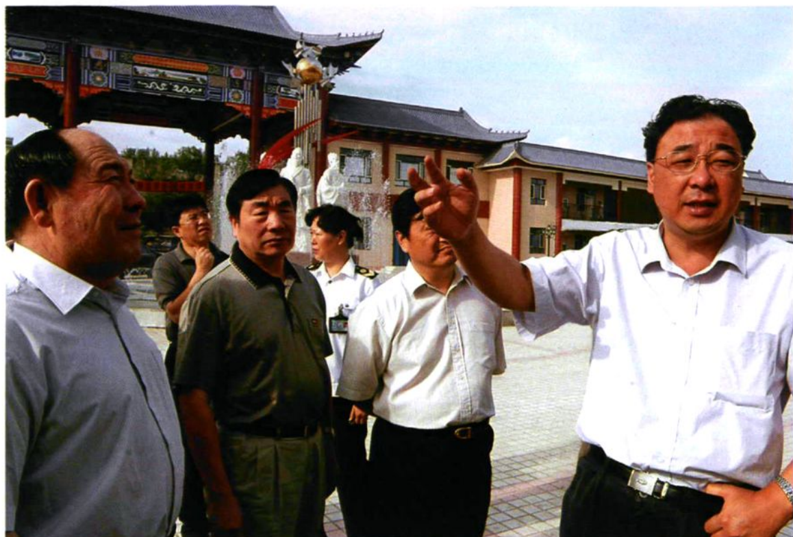
2005年7月4日,国家卫生部副部长马晓伟(右一)在兵团副司令员阿勒布斯拜·拉合木(左一)陪同下视察农七师卫生工作