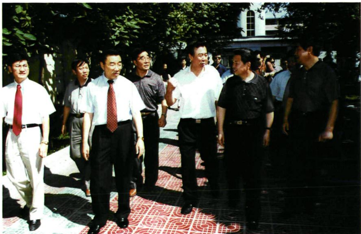
2002年夏,国家体育总局局长袁伟民(前右三)在兵团司令员张庆黎(前左二)陪同下到石河子大学医学院第一附属医院考察全民健身活动情况