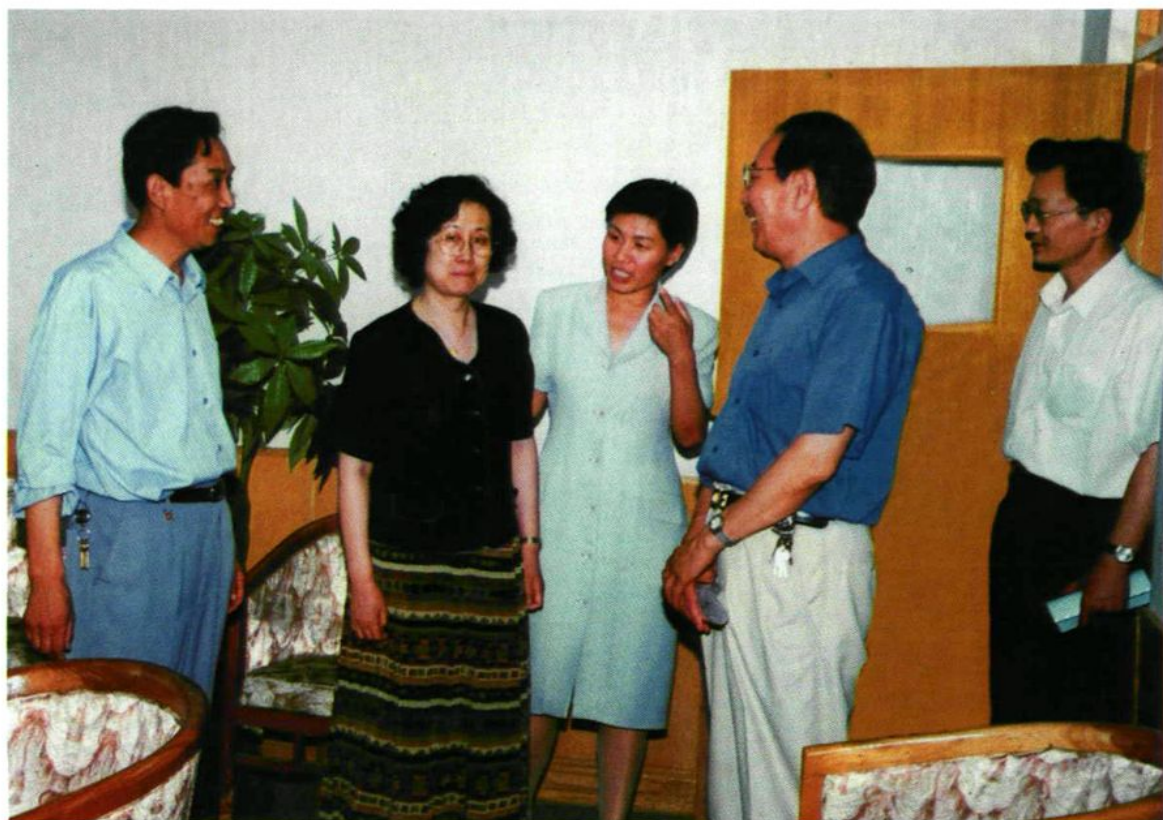
2000年7月2日,国家卫生部副部长彭玉(左二)在兵团卫生局党组书记汪艾翔(右二)陪同下视察石河子垦区卫生工作