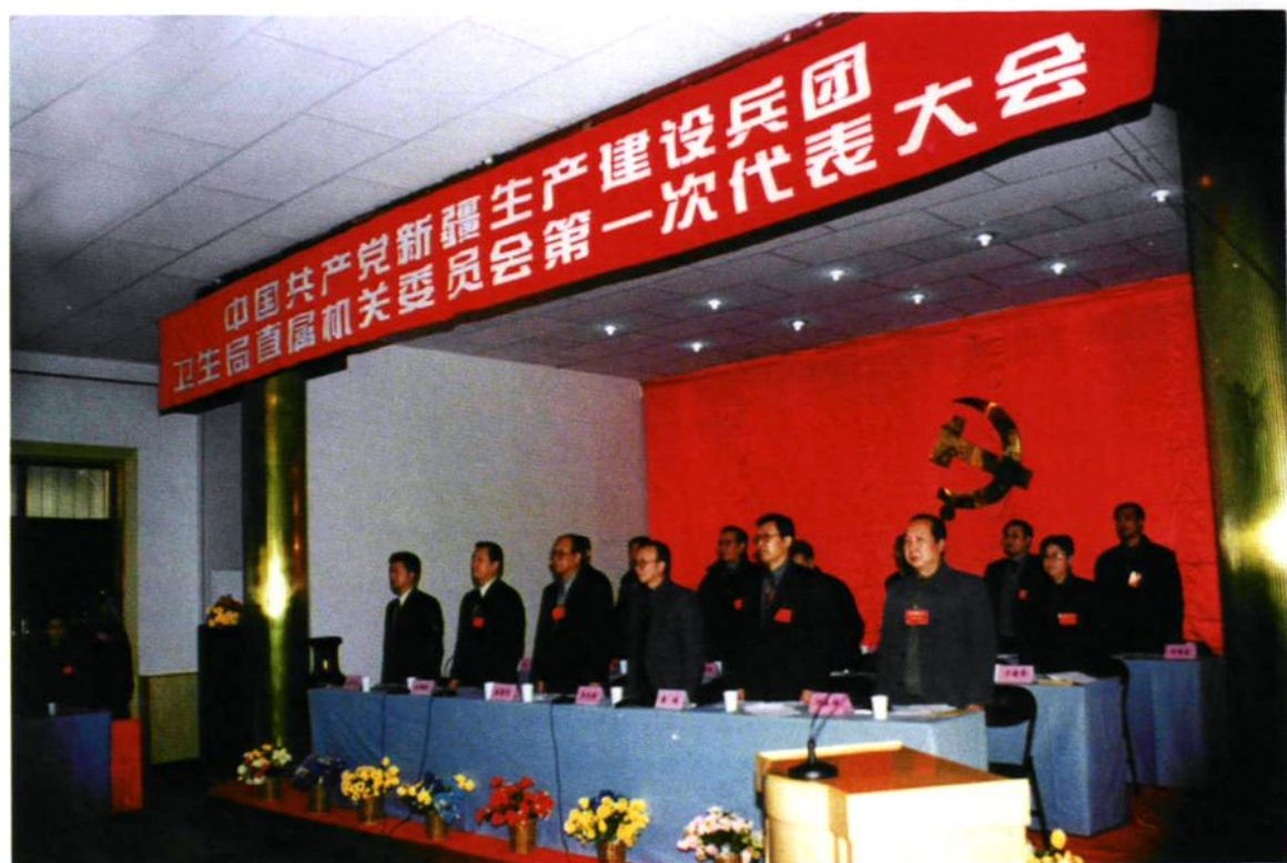
2000年12月26日,中共兵团卫生局直属机关委员会第一次代表大会召开,选举产生第一届委员会