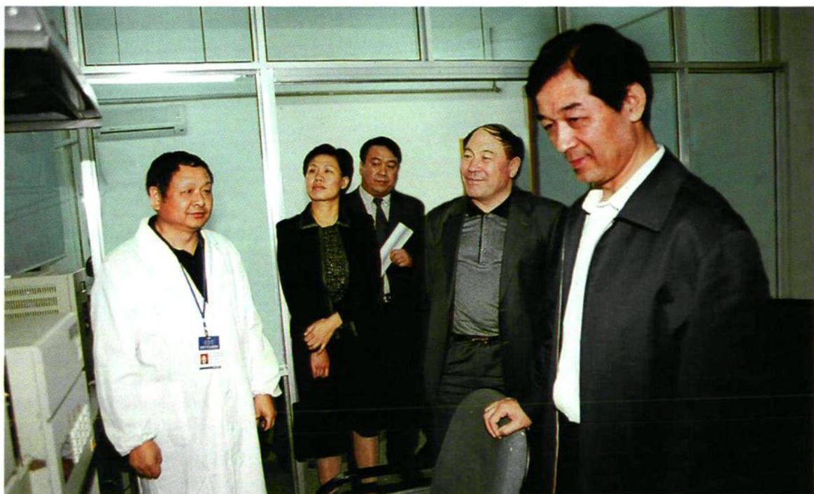
2004年9月22日,国家卫生部副部长王陇德(右一)在兵团副司令员阿勒布斯拜·拉合木(右二)陪同下视察石河子市疾病预防控制中心