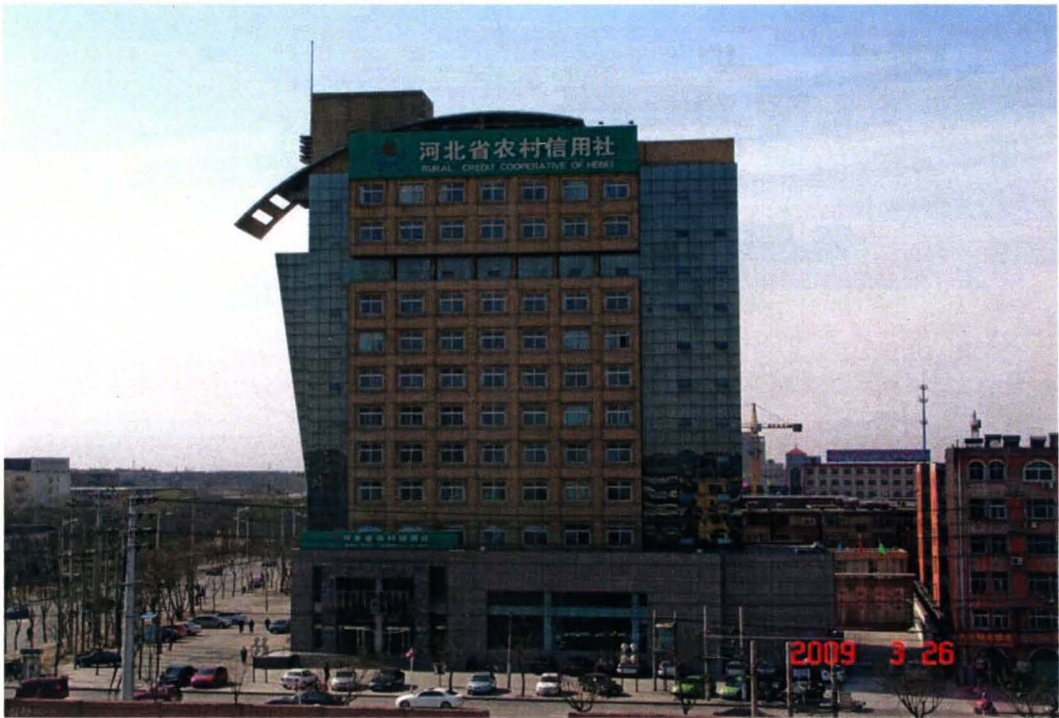
衡水市农村信用合作社联合社办公大楼