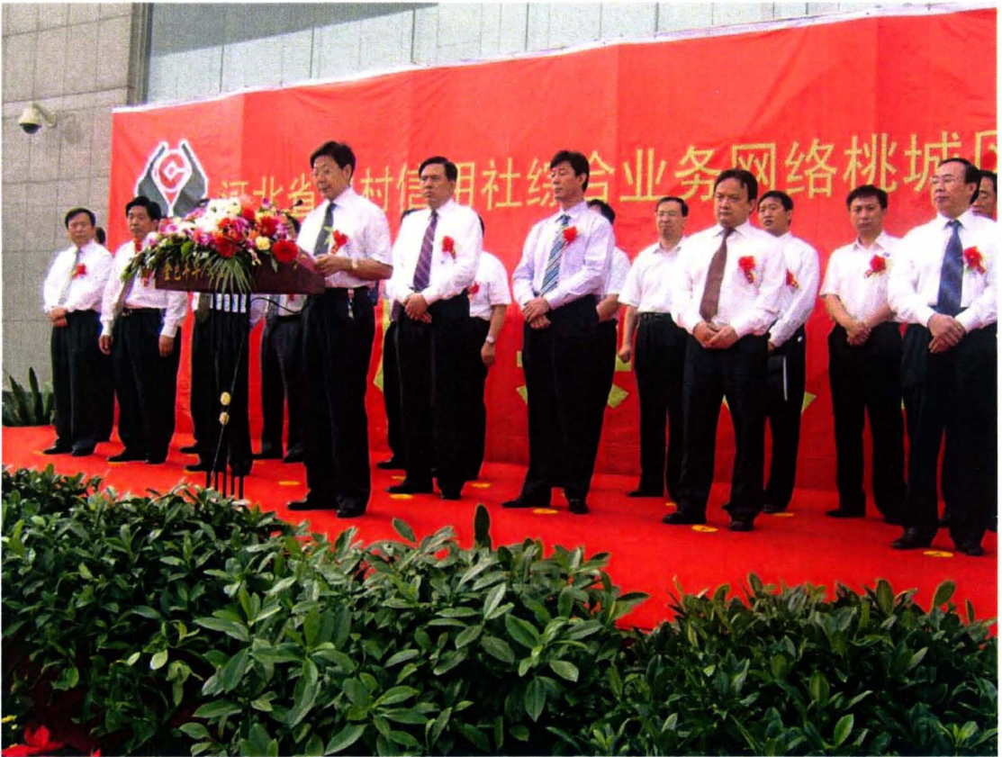
河北省农村信用社综合业务网络衡水市桃城区联社试点开通仪式