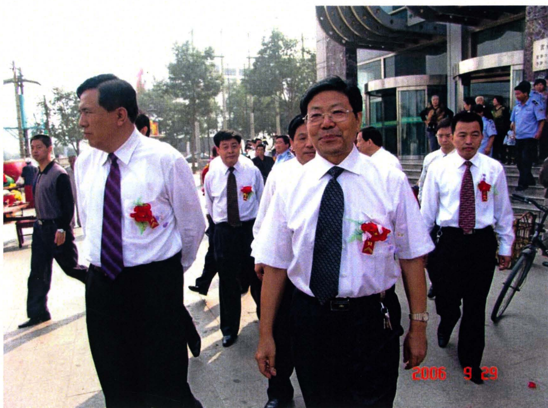
河北省联社领导、衡水市委主要领导来衡水农村信用社视察工作