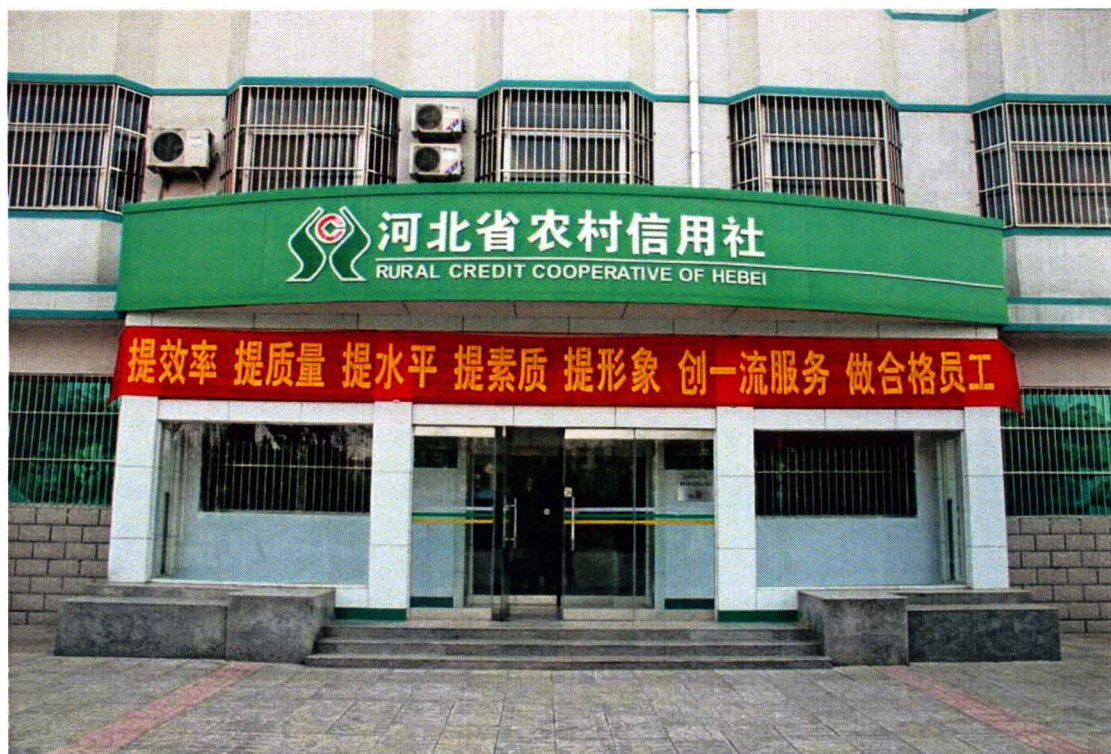
整洁美观的农村信用社新形象