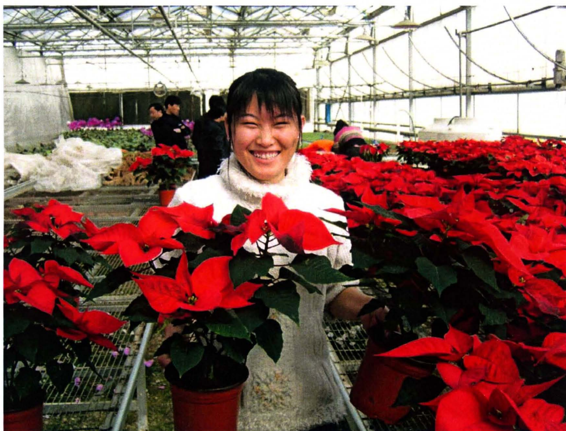
积极支持花卉大棚种植