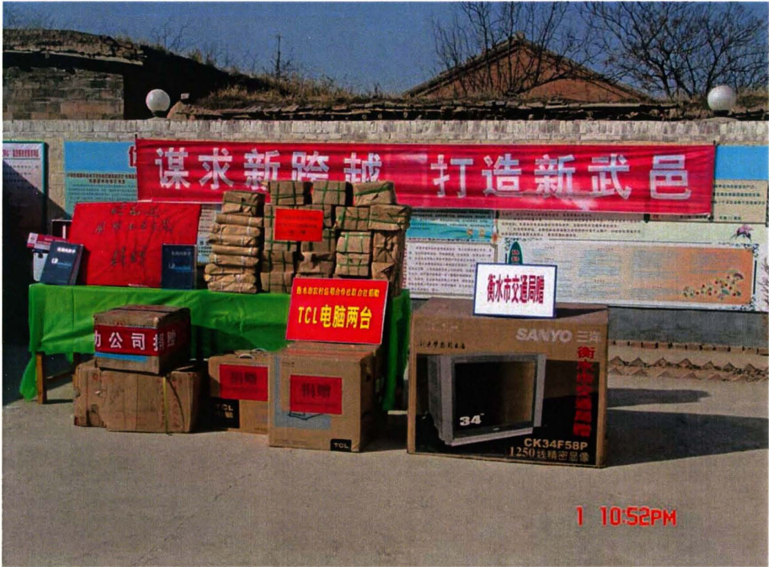
积极做好“三下乡”活动，图为捐赠的电脑