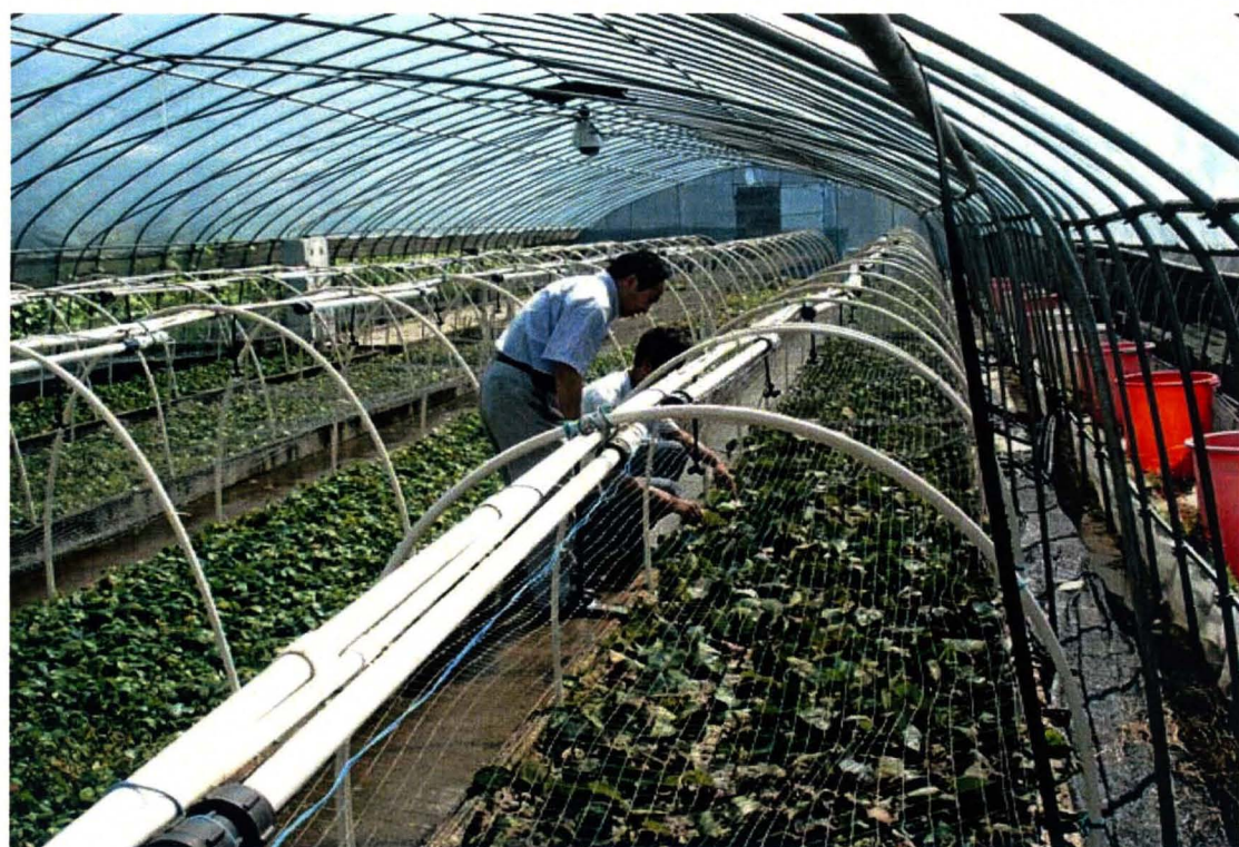
支持“三农”，实现“双赢”