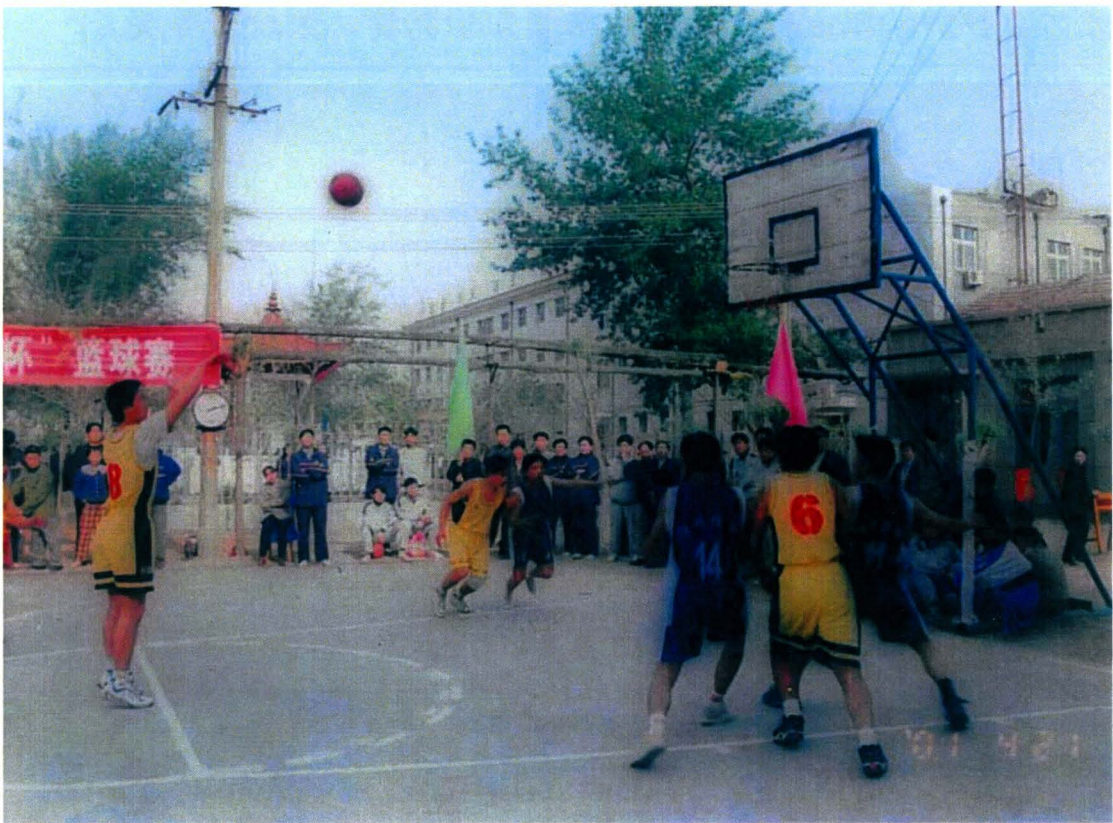
丰富职工文化生活，“信合杯”篮球比赛现场