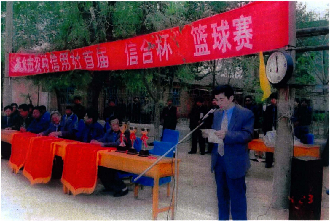
衡水市农村信用社“信合杯”篮球比赛