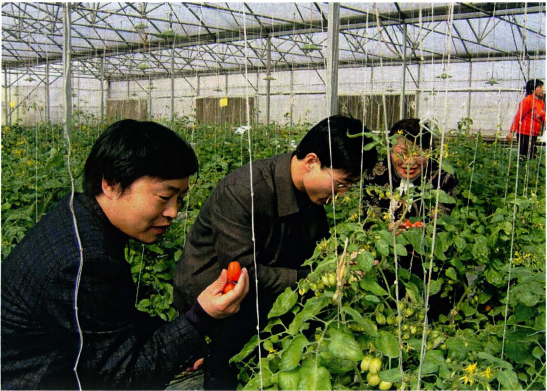
做好信贷投放，支持地方经济建设