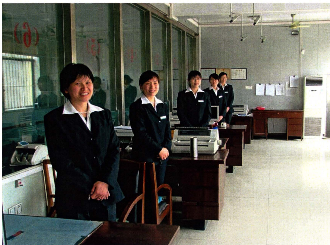
崭新的农村信用社员工风貌