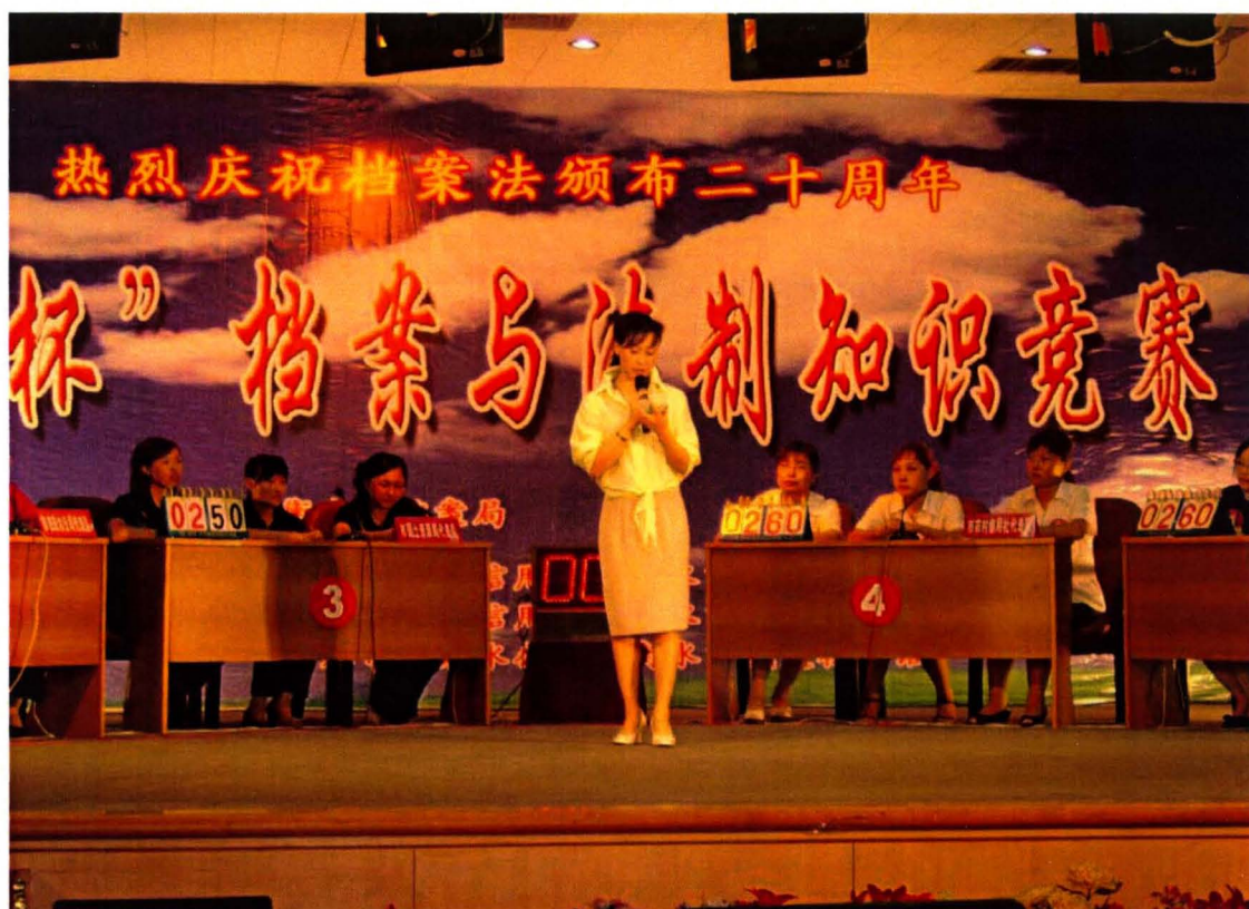
参加“城信杯”档案与法制知识竞赛，荣获三等奖