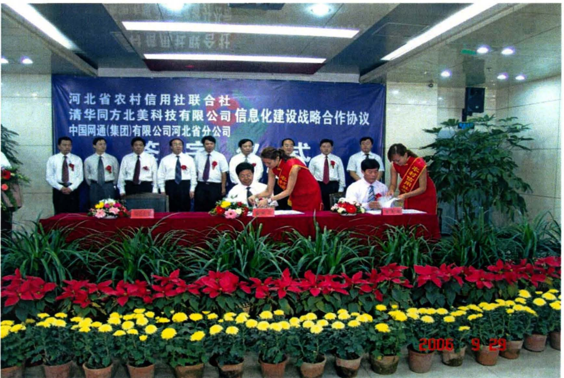
河北省联社在衡水与有关部门签署信息化建设战略合作协议