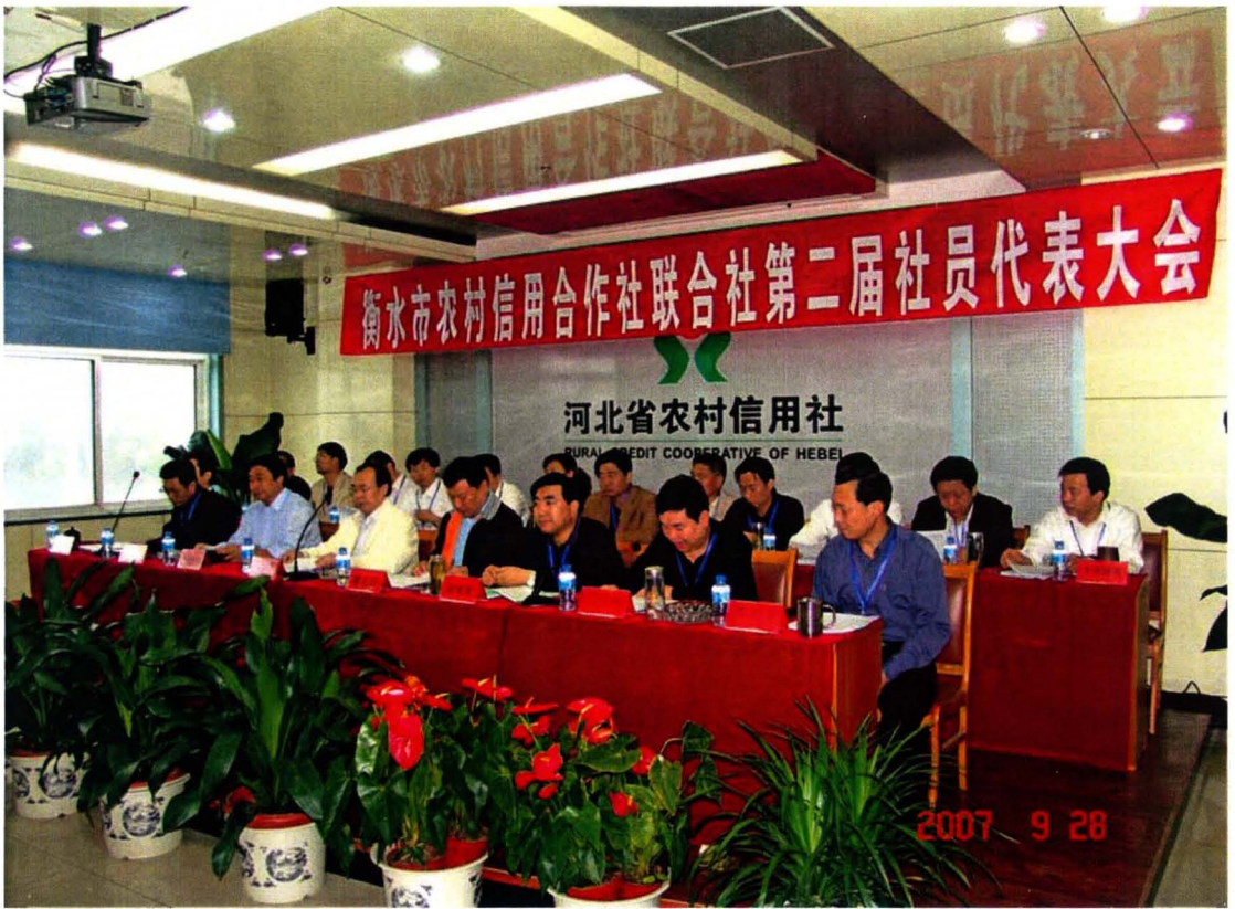
衡水市农村信用合作社联社社员代表大会现场