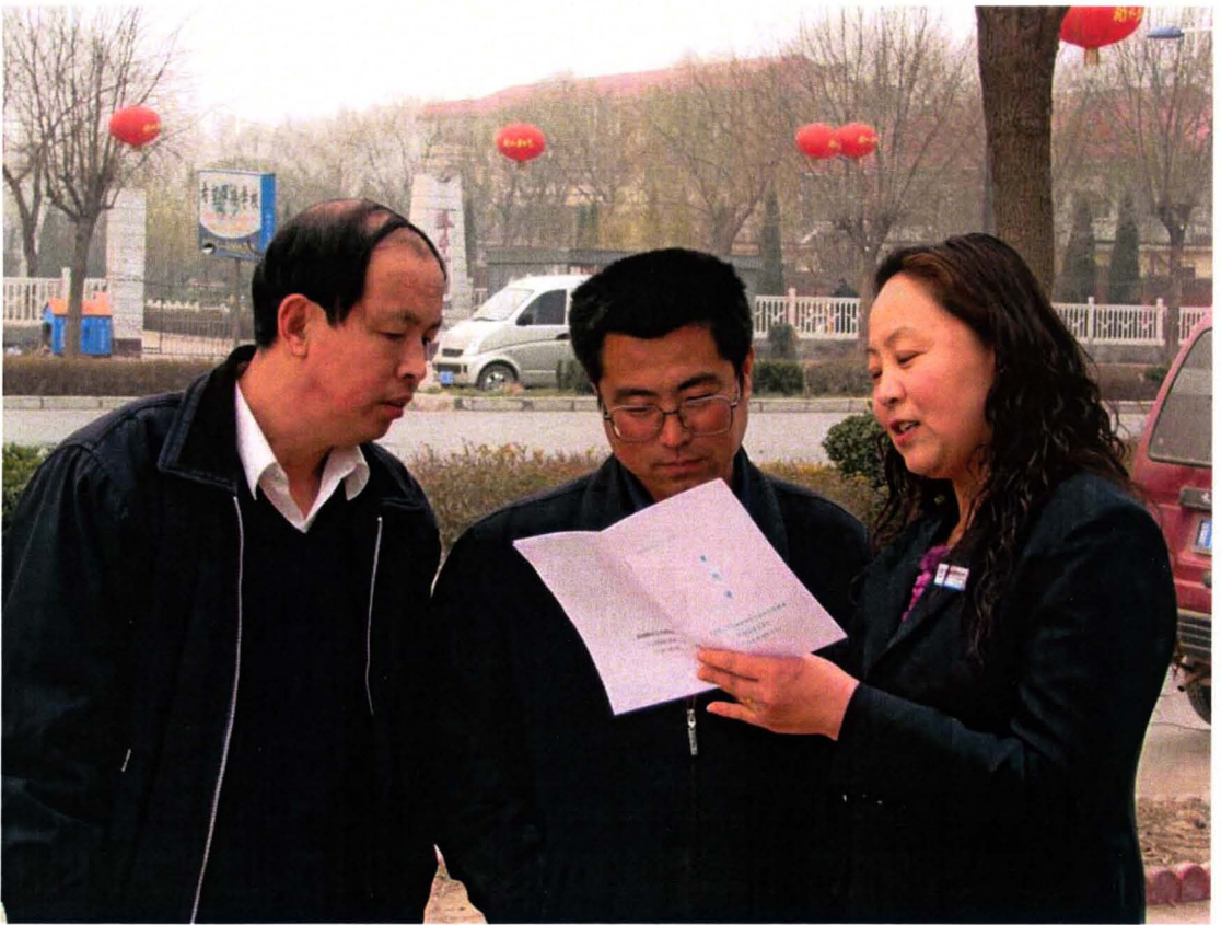
走上街头，宣传农村信用社新品种、新业务