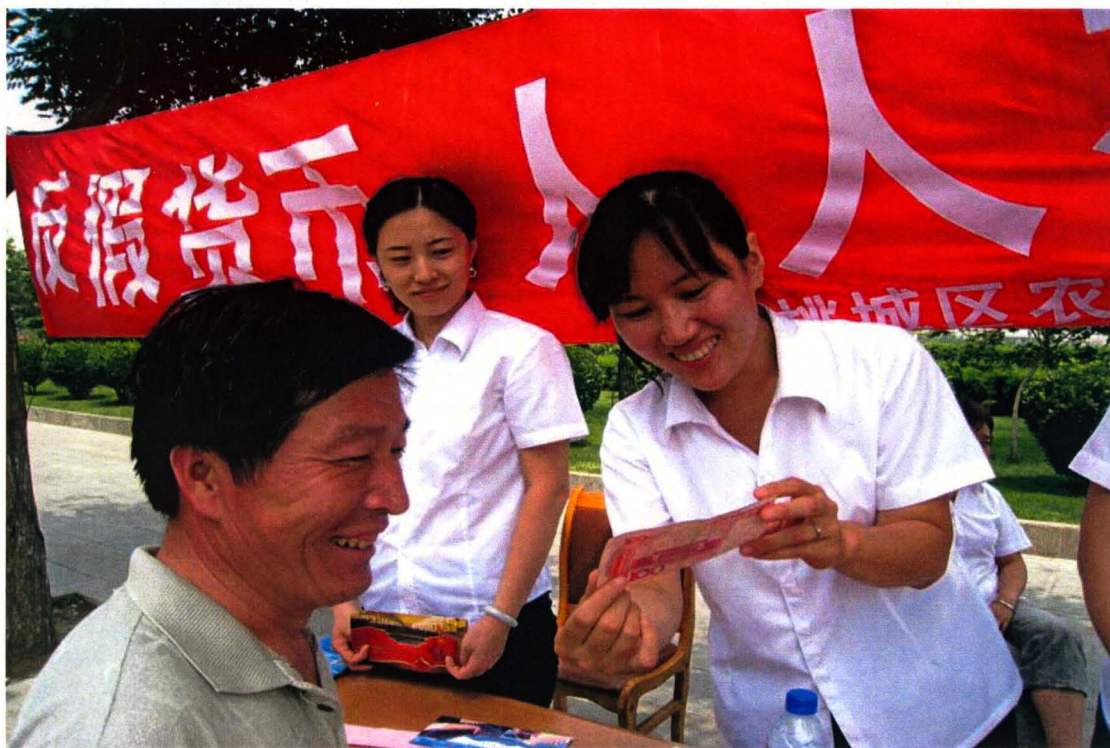
积极做好反假币宣传，图为员工正在为群众耐心讲解