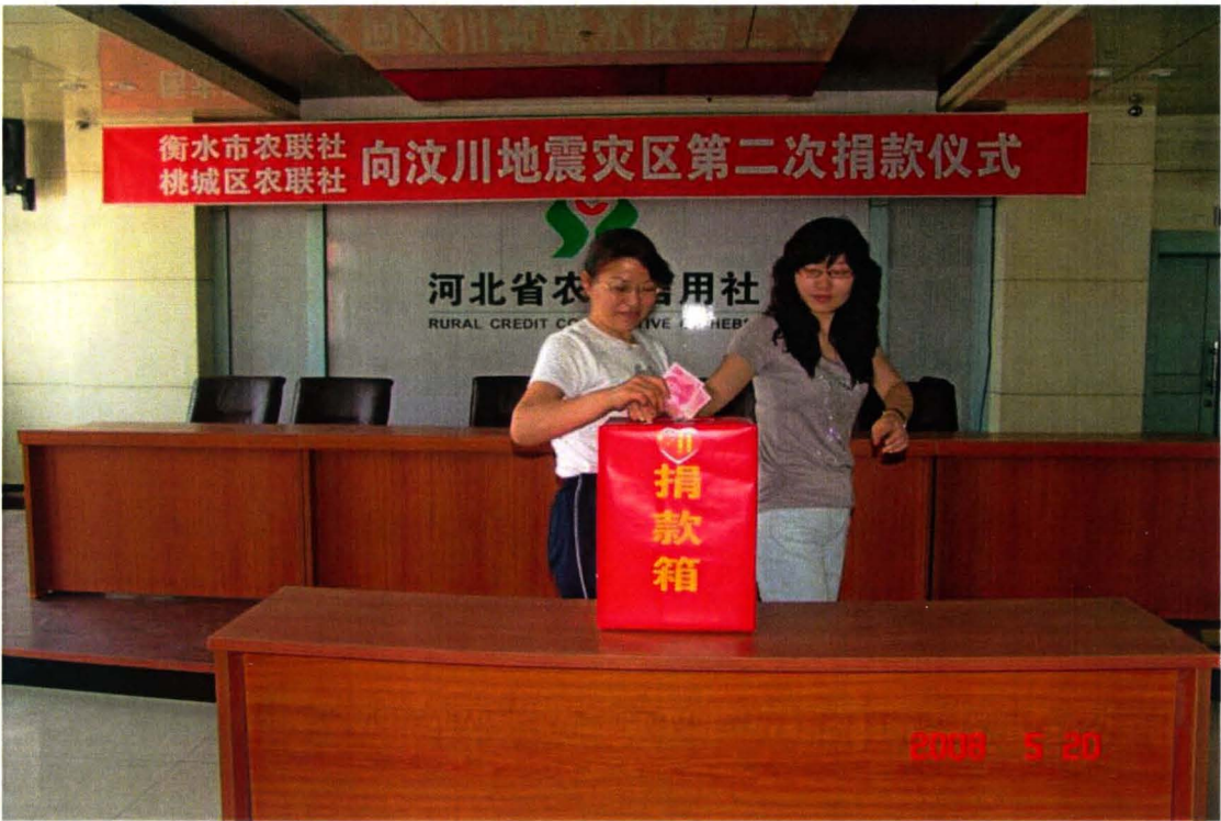
奉献爱心，全市农村信用社为汶川地震灾区踊跃捐款 760560 元