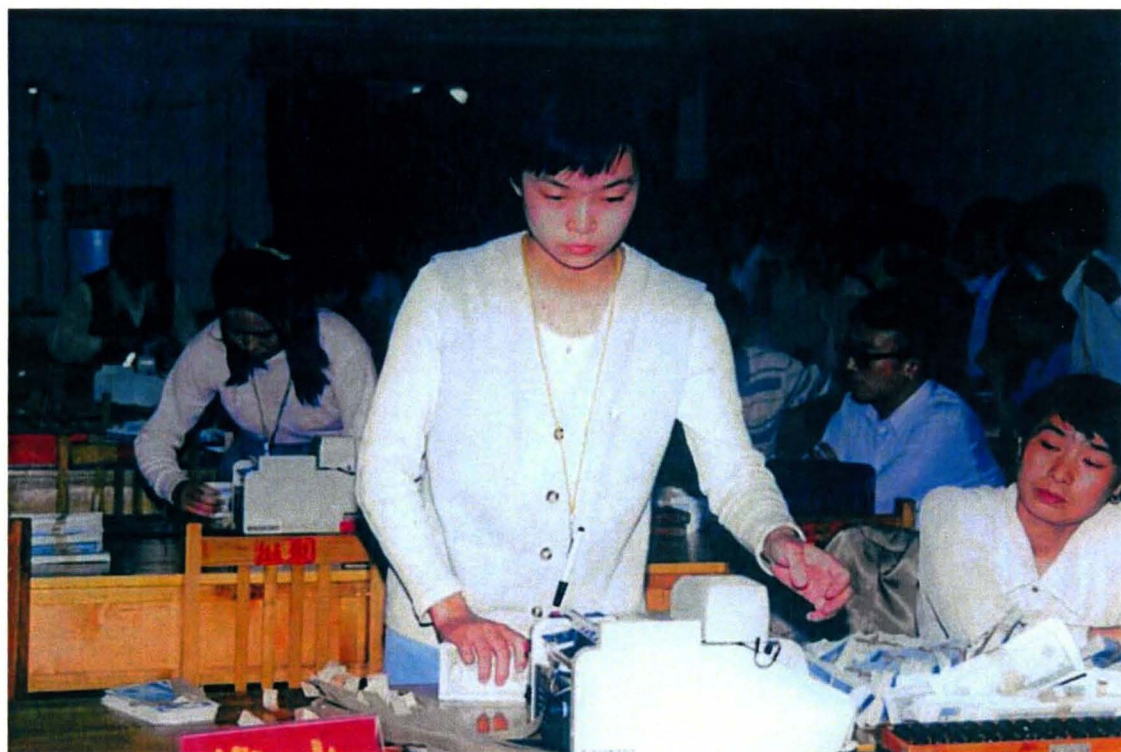
衡水市农村信用社业务技术比赛现场，图为选手在比赛中