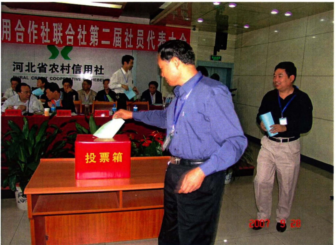
衡水市联社认真召开“三会”，图为社员代表行使民主权力正在投票