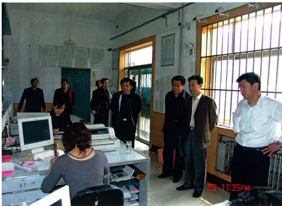
河北省联社领导到衡水深入基层信用社调研指导工作