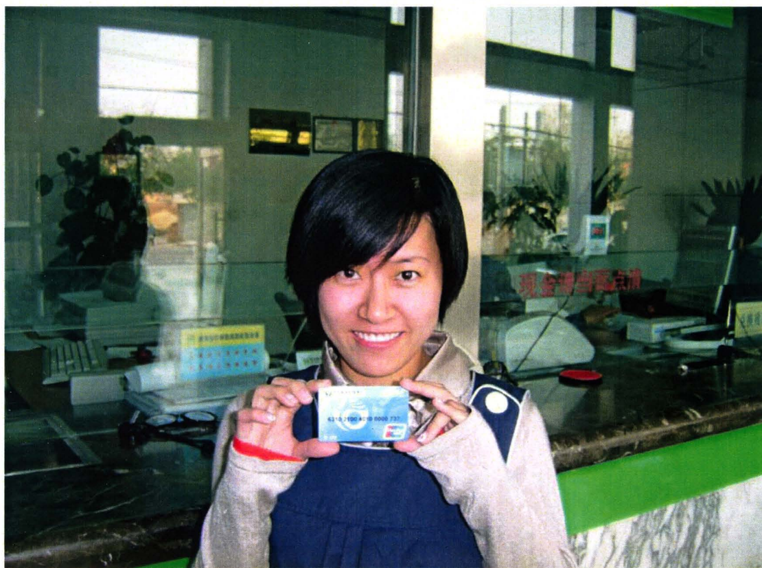
2008年9月27日，发行了第一张“信通卡”，结束了衡水农村信用社“无卡”的历史