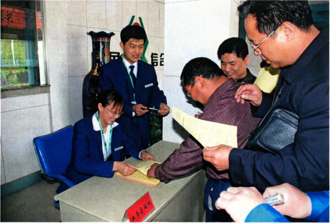
笑容可掬的农村信用社员工正在为群众做业务咨询