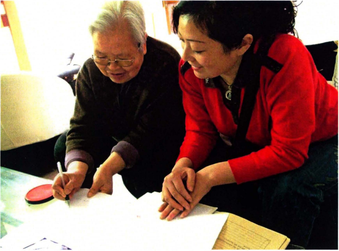
上门贴心服务，为储户带去温馨