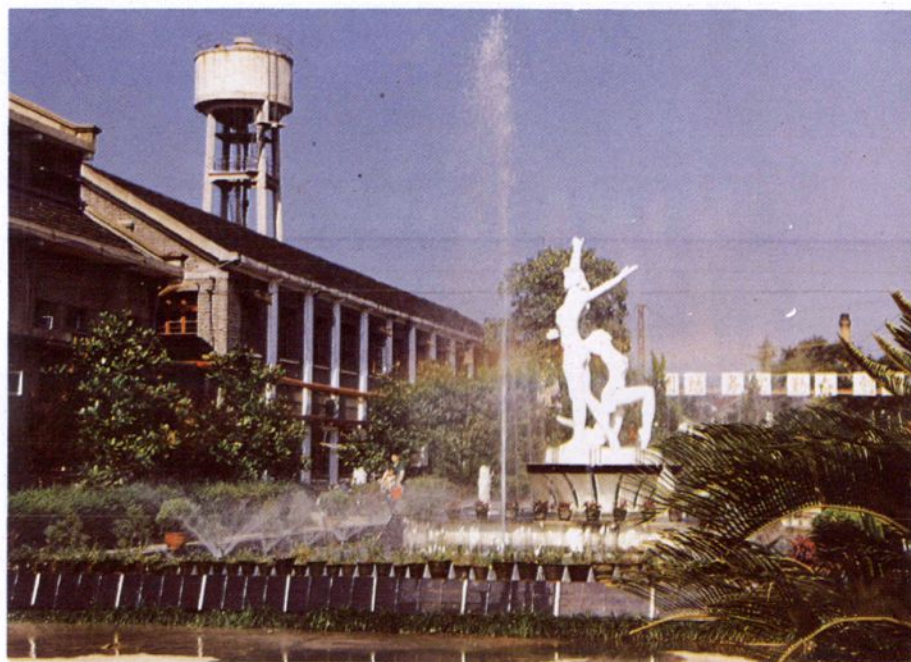
溅珠滚玉的塑像喷水池