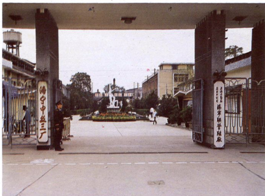
典雅庄重的厂大门