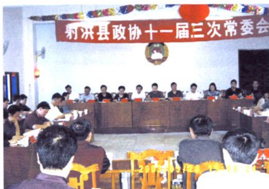
第十一届三次常委会议会场