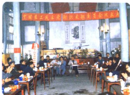
1987年11月25日，农工民主党射洪县支部委员会成立大会会场