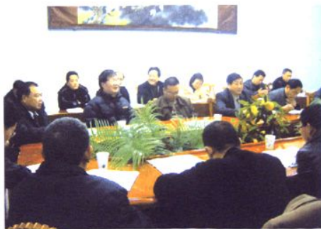
2006年十一届四次会议分组讨论