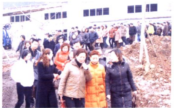
第十一届部分政协委员视察县城防洪堤工程