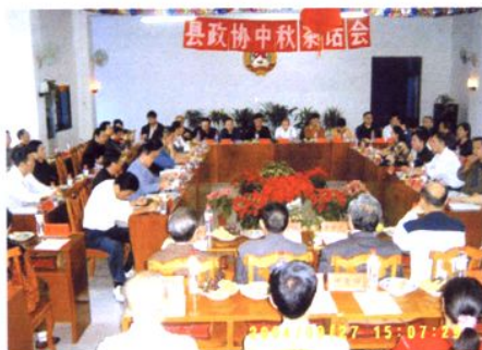
2004年中秋茶话会会场