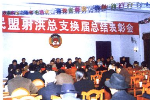
2004年11月18日民盟射洪总支换届总结表彰会会场