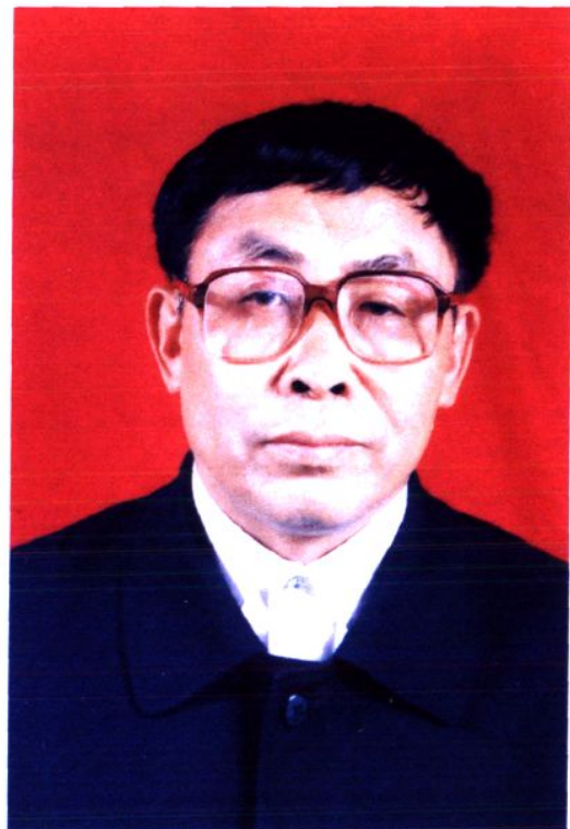
第十届政协主席 李庆玉 (2001年2月—2002年12月)