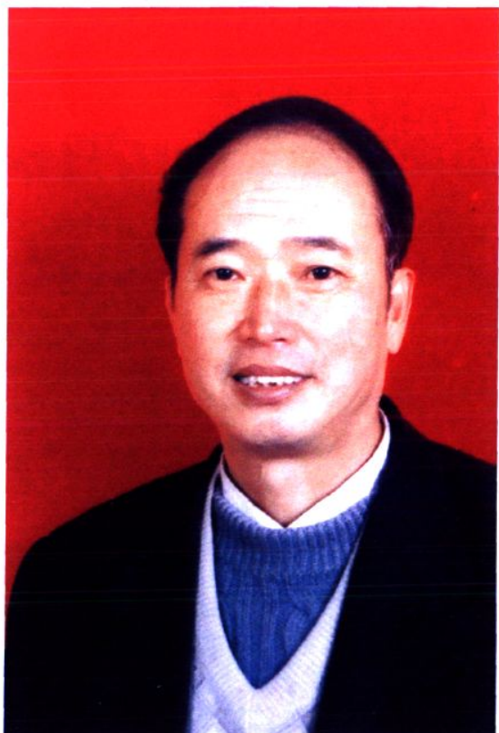
第八、九、十届政协主席 徐惠中 (1990年2月—2001年2月)