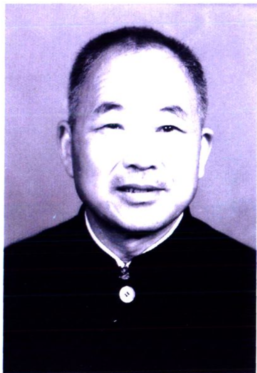
第六、七届政协主席 沈逸清 (1984年3月—1990年2月)