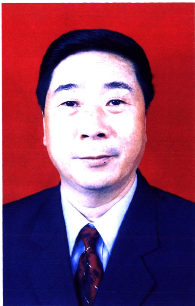
第十一、十二届政协主席 符安君 ( 2003年2月一 )