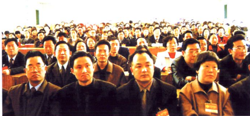
第十一届二次全体会议闭幕式会场