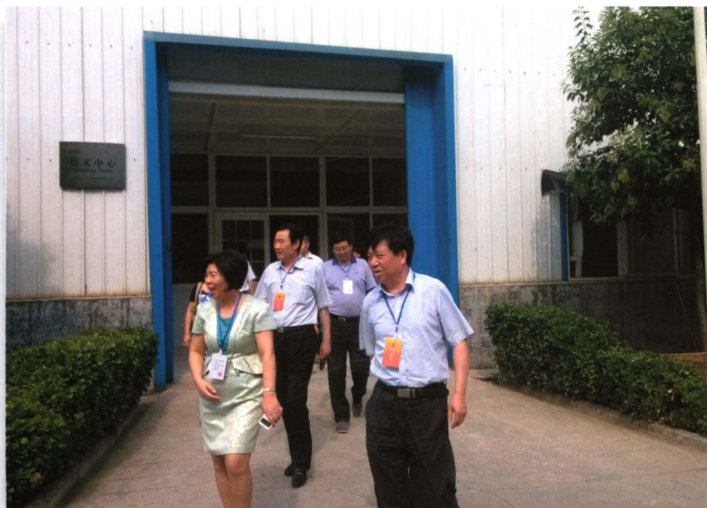
2014年8月12日，市、区两级人大代表视察尚品优塑科技有限公司