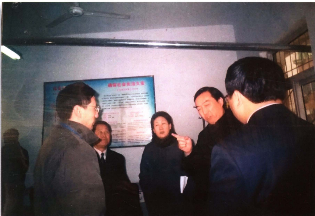
2003年12月12日，省委副书记陈全国（右二）莅临秋冬社区调研