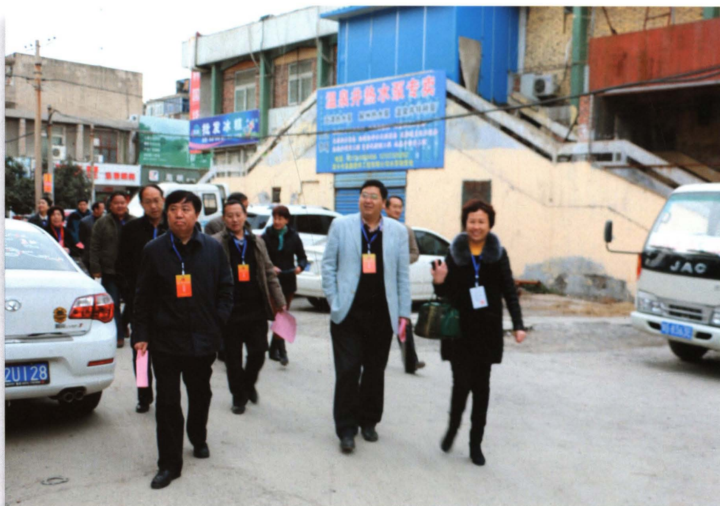
2014年12月10日，市、区两级人大代表视察向阳街道