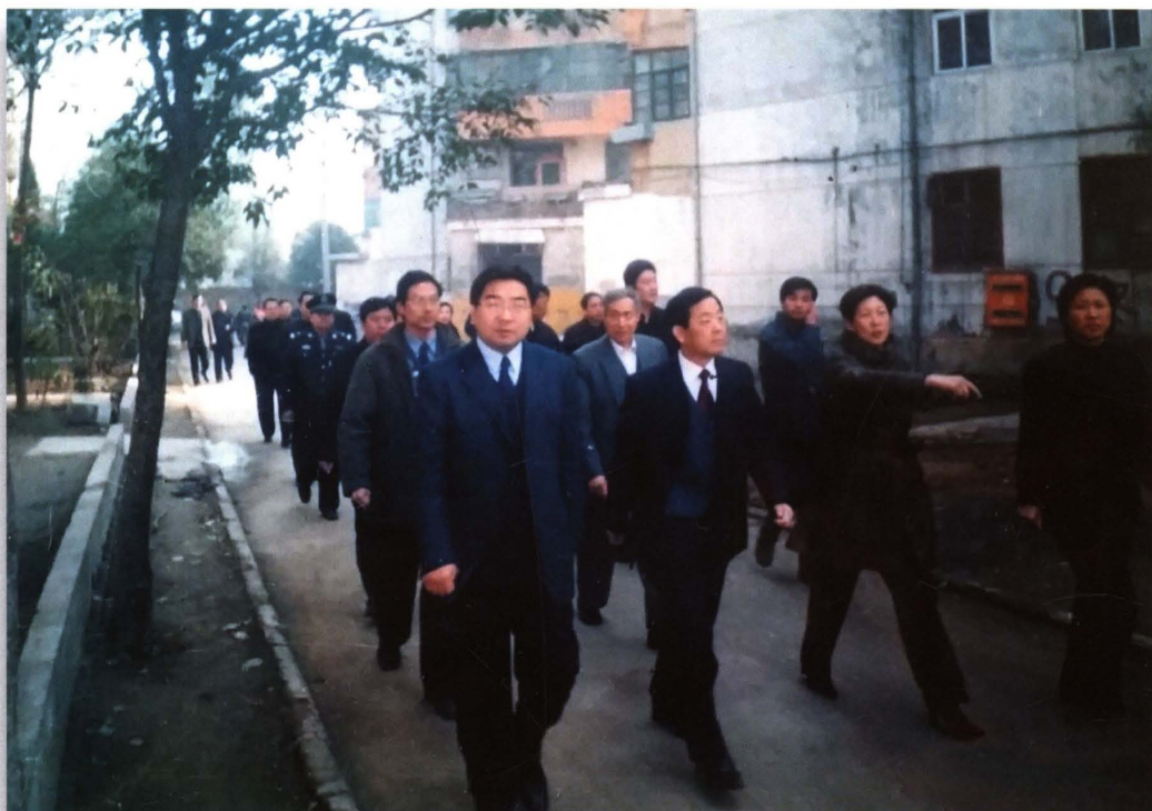
2003年11月13日，省委副书记王全书（前排左二）莅临秋冬社区调研