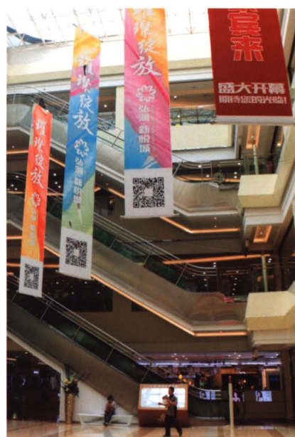
弘润·新悦城购物广场