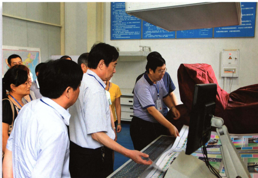
2014年8月12日，市、区两级人大代表视察新机创新有限公司