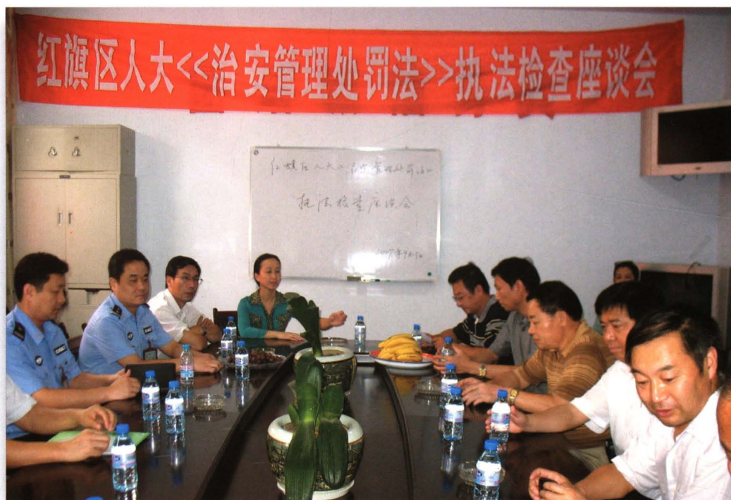
2007年9月13日，区人大代表在向阳街道召开《治安管理处罚法》执法检查座谈会