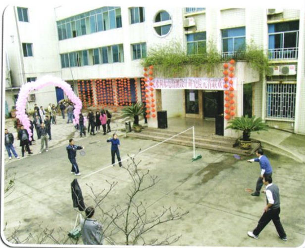
元宵联欢活动中的羽毛球比赛