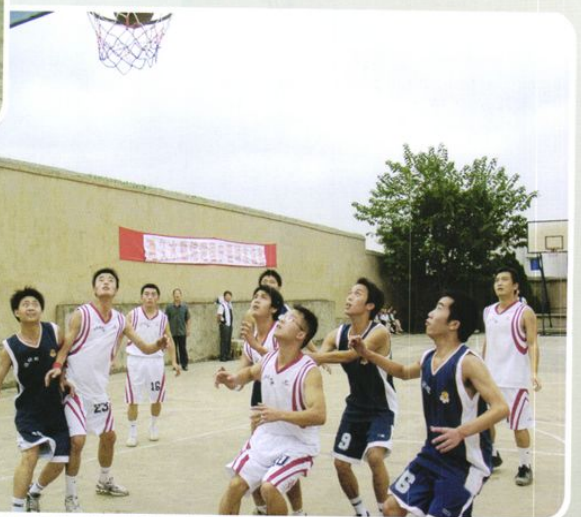
迎国庆篮球友谊赛