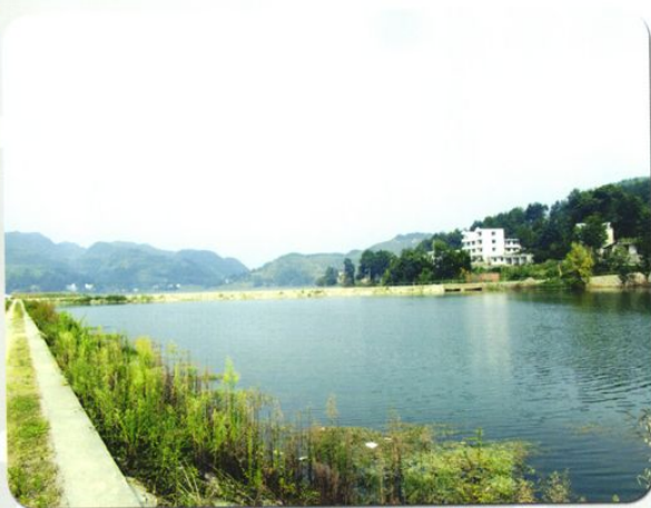
海龙水库二期围堤保地工程

原国家水利部副部长（现国务院南水北调办公室主任）张基尧（“右一”）在原贵州省水利厅厅长郑荣华（“右三”）和遵义市市委书记傅传跃（“左一”）、市水利局局长张立（“左二”）的陪同下，视察海龙水库大坝工程。