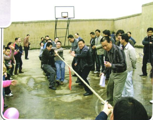
一年一度的院职工拔河比赛