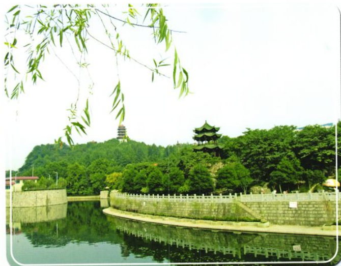
治理后的湘江河一角