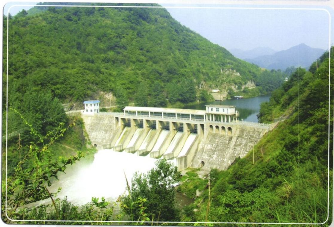
红岩水库砌石拱坝