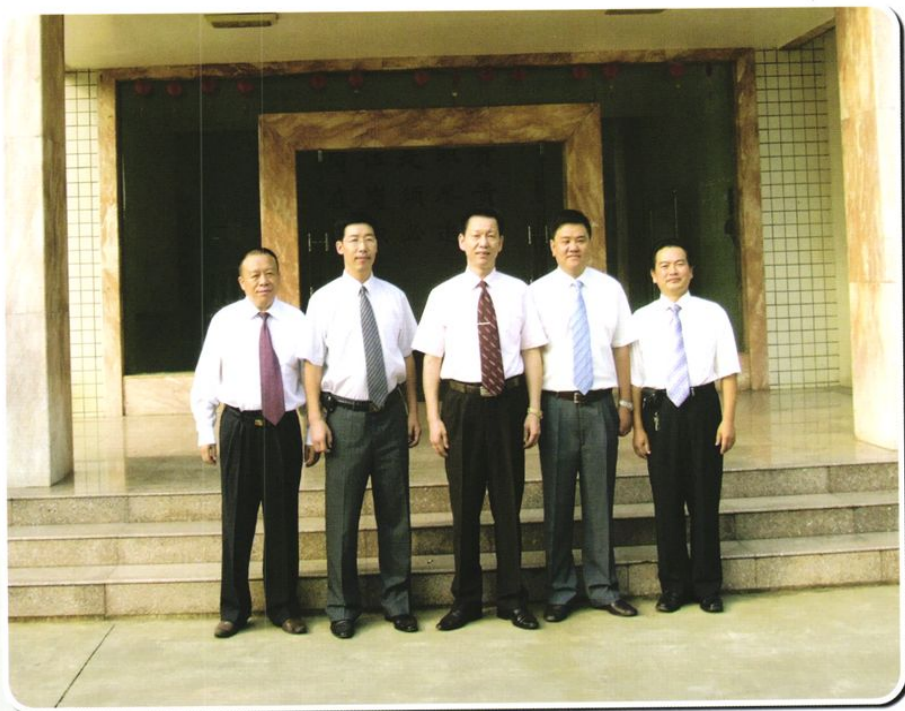
院党总支委员合影