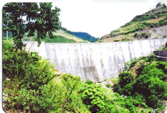
建设中的苦寨田水库大坝