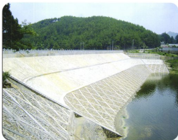
除险加固后的龙岩水库大坝