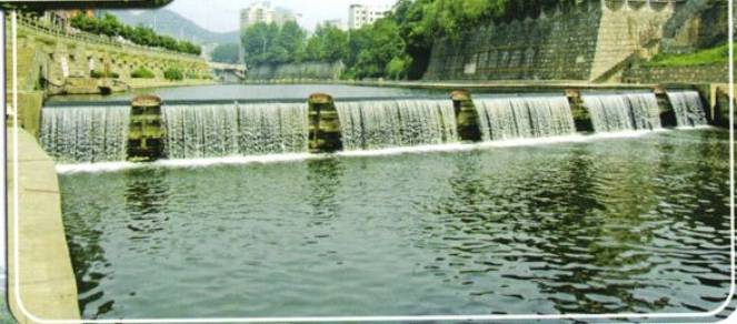
湘江河化工厂钢筋混凝土翻板坝