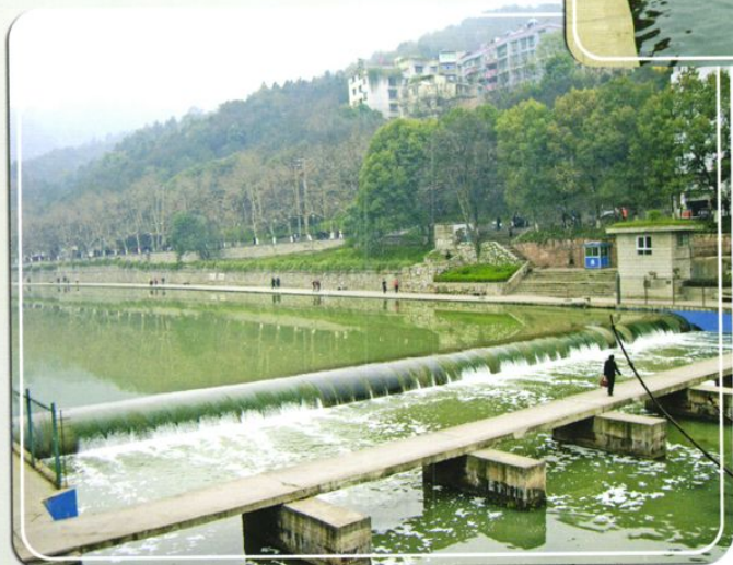
湘江河公园橡胶坝