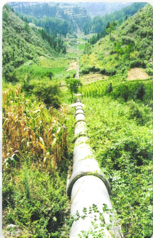
已建成的苦寨田水库艾田倒虹管