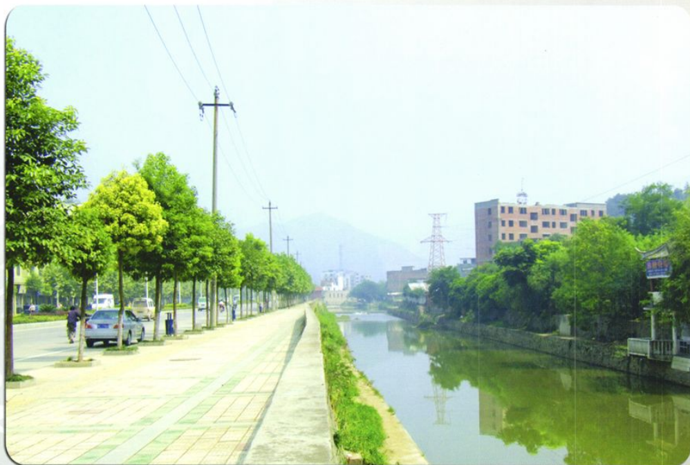
桐梓县县城防洪工程一角