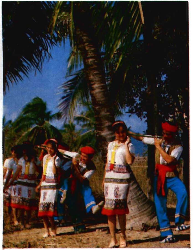
三月三是黎族的傳統節日，這是反映這一節日盛況的舞蹈。