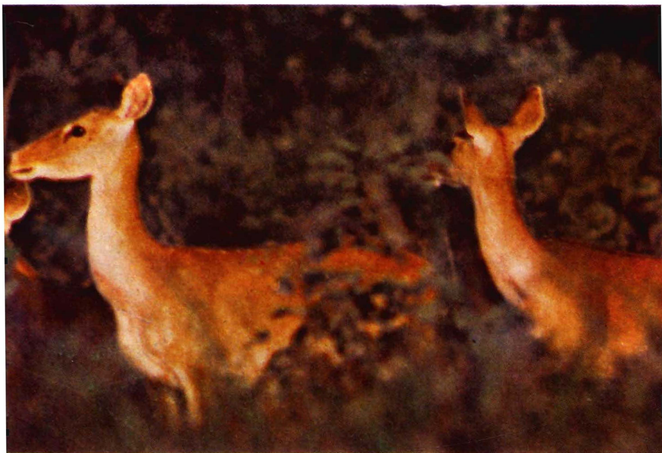
试读结束，需要全本PDF请购买 www.ertongbook.com 坡鹿