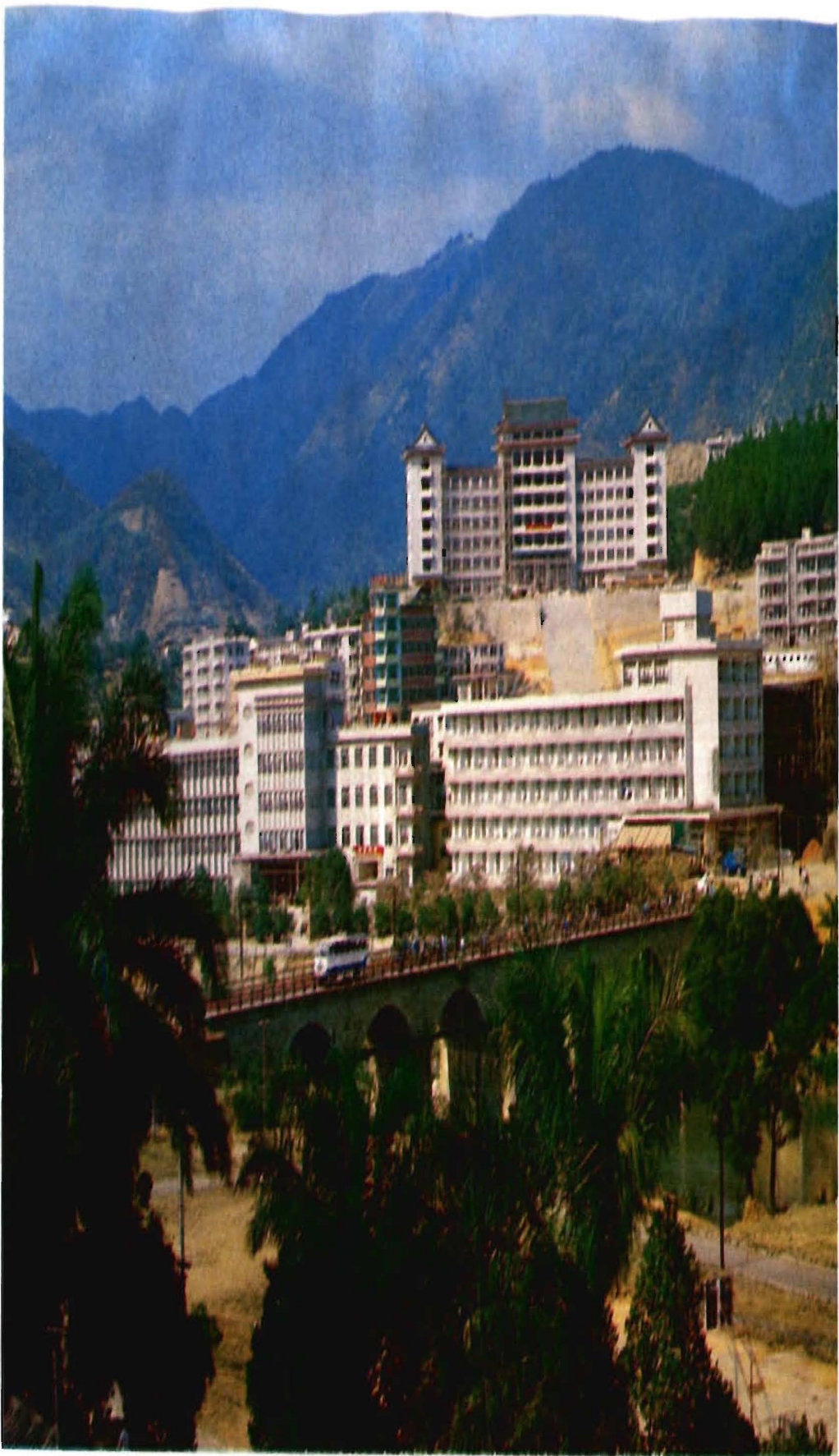
通什鎮。遠處為自治州政府辦公大樓。