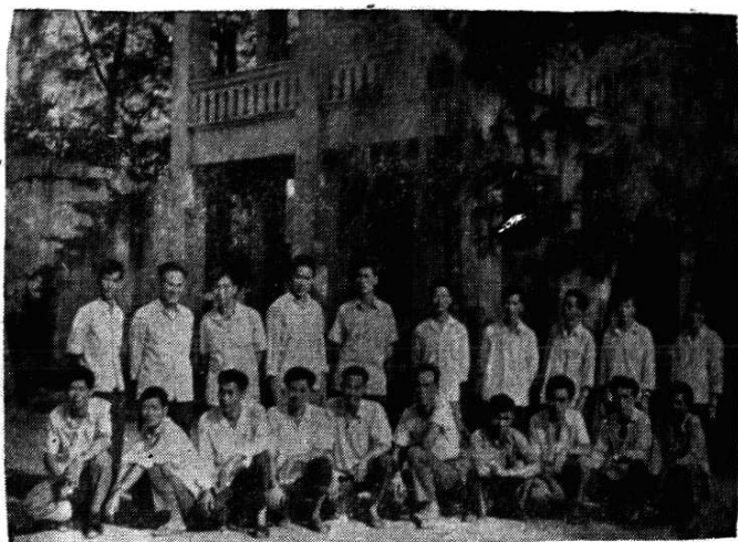
苍梧县地名工作人员合影