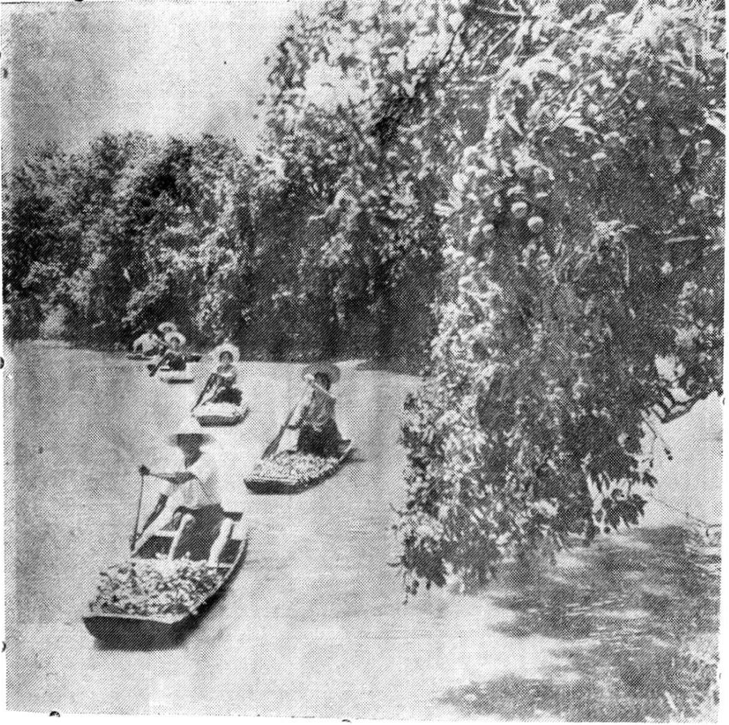
苍梧特产：古风荔枝