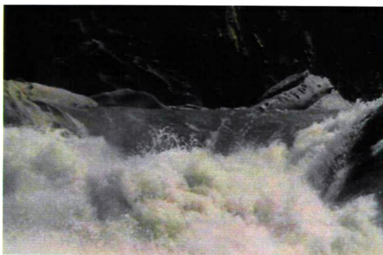
达古村娘格大落差