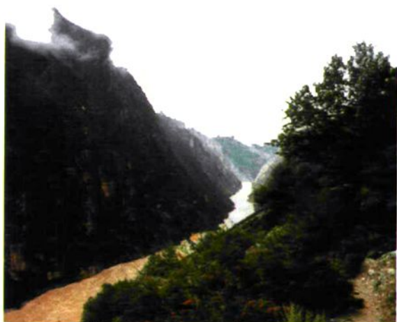
雅鲁藏布江桑日峡谷