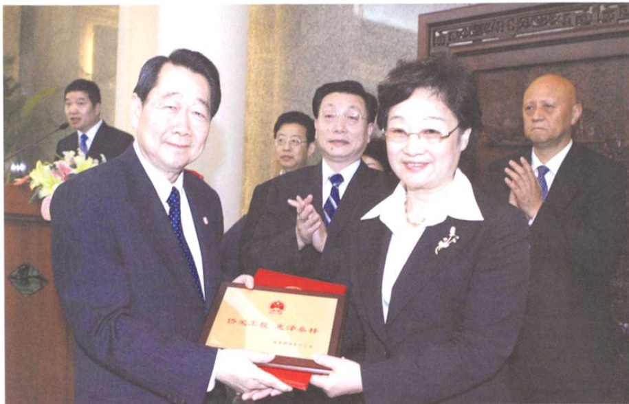
2008年7月7日晚，国务院侨办在北京为“携手共建——知名侨资企业家四川行”代表团举行答谢宴会，感谢侨资企业家为抗震救灾所作的贡献。国务院侨办主任李海峰（右二）为企业家颁发捐赠证书和荣誉牌匾。图为中国侨商投资企业协会会长、泰国正大集团董事长谢国民（左）接受荣誉牌匾。