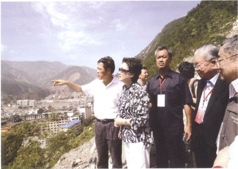
2008年7月4—7日，国务院侨办与四川省政府共同举办“携手共建——知名侨资企业家四川行”活动。图为7月5日，国务院侨办主任李海峰（左二）率领侨商前往四川省北川羌族自治县考察灾情。