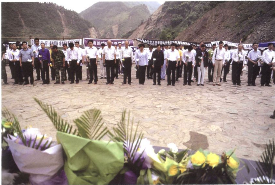
2009年5月11日，国务院侨办主任李海峰率部分侨资企业家和海外华文媒体负责人在四川省青川县东河口地震遗址前为地震遇难者默哀。