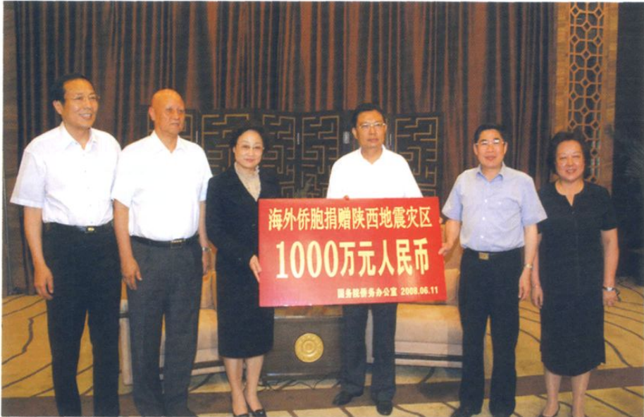
2008年6月11日，国务院侨办主任李海峰（左三）前往西安，向陕西省转交海外侨胞捐款1000万元。中共陕西省委书记赵乐际（右三）、陕西省省长袁纯清（右二）代表陕西省地震灾区接受捐款。