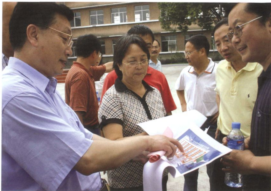
2008年8月26日，国务院侨办副主任马儒沛（左一）前往四川省广汉市连山镇侨爱中学视察，并与校方探讨侨胞援建的教学楼建筑设计方案。