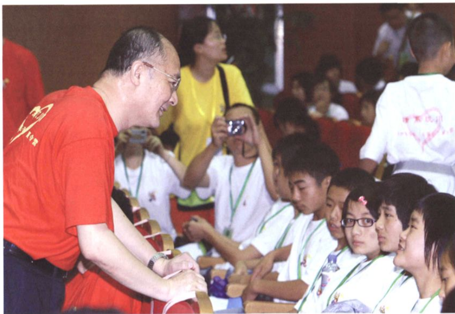
2008年7月22日，由国务院侨办主办的“情系汶川——中外青少年心连心夏令营”在陕西省西安市开营。国务院侨办副主任赵阳出席开营仪式并与来自地震灾区的孩子亲切交谈。