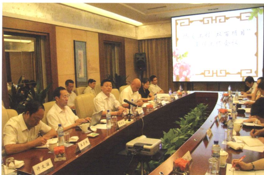
2008年8月28日，“侨爱工程——双百项目”建设工作会议在陕西省西安市召开，国务院侨办副主任马儒沛（左三）在会上讲话。