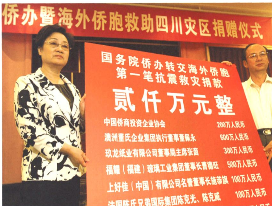
2008年5月15日，国务院侨办主任李海峰（左）前往成都向四川地震灾区转交海外侨胞第一批捐款2000万元。