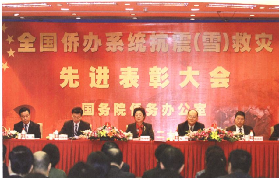
2008年9月28日，全国侨办系统抗震（雪）救灾先进表彰电视电话会议在北京召开。主席台左起依次为：中纪委驻国务院侨办纪检组组长王杰、国务院侨办副主任马儒沛、国务院侨办主任李海峰、国务院侨办副主任赵阳、国务院侨办副主任任启亮。