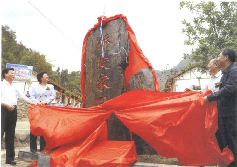
2009年5月11日，国务院侨办主任李海峰（左二）、副主任赵阳（右二）、副主任马儒沛（左一）、四川省副省长黄小祥（右一）为四川省青川县关庄镇“侨爱家园”落成揭幕。