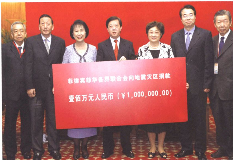
2008年6月24日，国务院侨办主任李海峰（右三）、副主任许又声（右二）在北京钓鱼台国宾馆会见菲律宾菲华各界联合会访华团一行。该会向四川汶川地震灾区捐款100万元。