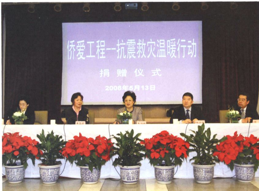
2008年5月13日，国务院侨办紧急启动“侨爱工程——抗震救灾温暖行动”。国务院侨办主任李海峰（中）、国务院侨办副主任任启亮（右二）等出席捐赠仪式。