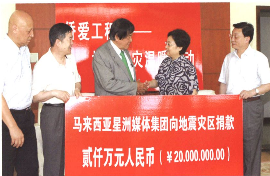
2008年7月8日，马来西亚常青集团董事局主席张晓卿（左三）代表星洲媒体集团向中国地震灾区捐款2000万元用于当地侨爱学校建设。在北京举行的捐赠仪式上，国务院侨办主任李海峰（右二）与其握手致谢。（右一：国务院侨办副主任马儒沛；左二：国务院侨办副主任任启亮）