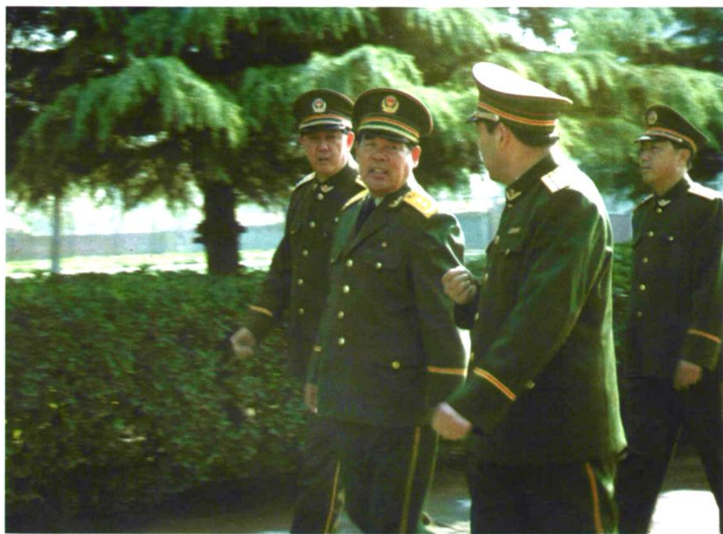
武警部队副政委隋绳武在总队领导陪同下来校视察（1999年11月）