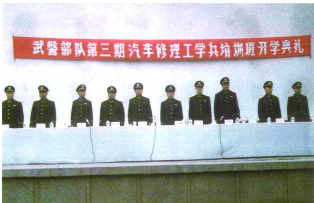
从1996年开始承担武警部队汽车修理工学兵的培训任务