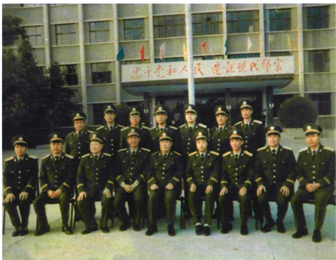
武警总部司令员杨国屏在总队长张天珠、政委陈献智陪同下来校视察（1997年10月）