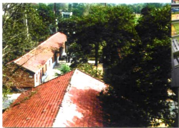
▲ 建于20世纪七十年代初的营房，目前还有约3416m 2 仍在使用的