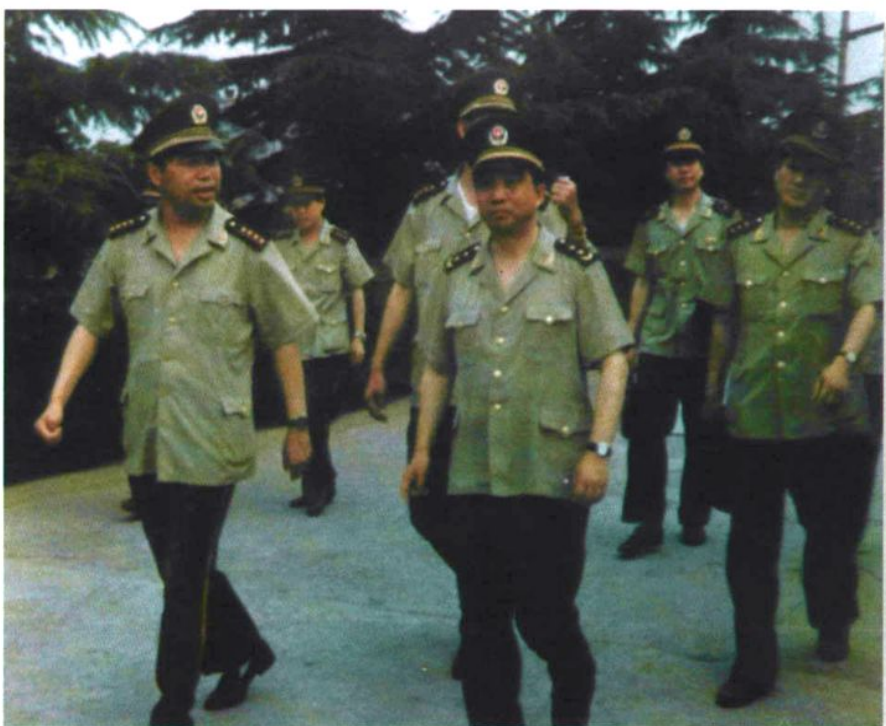
武警部队副司令员朱曙光在总队领导陪同下来校视察（1998年6月）