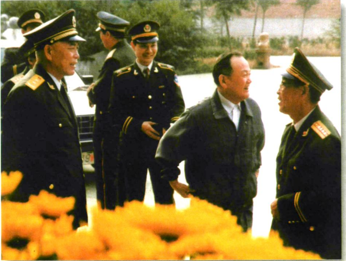
武警部队政委徐寿增在省公安厅领导、总队首长陪同下来校视察（1990年10月）