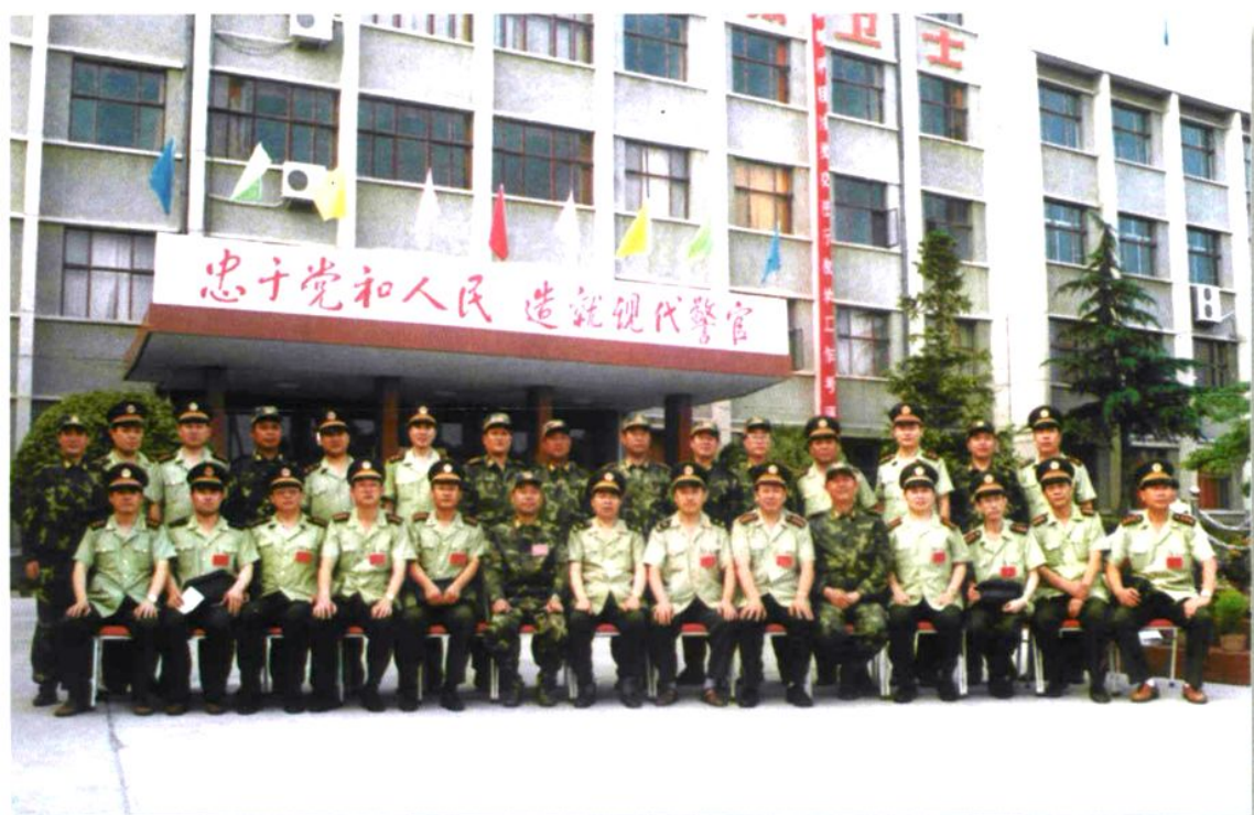
武警部队副参谋长霍毅带领总部考评组一行8人，对我校进行为期三天的教学工作考评，所考科目取得了总评优秀的好成绩（1999年7月）