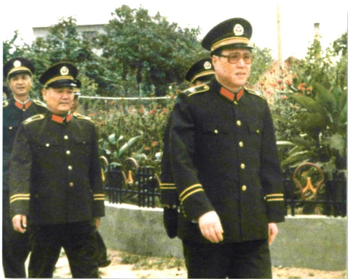
武警部队政委张秀夫在省公安厅长李广经陪同下来校视察（1986年4月）