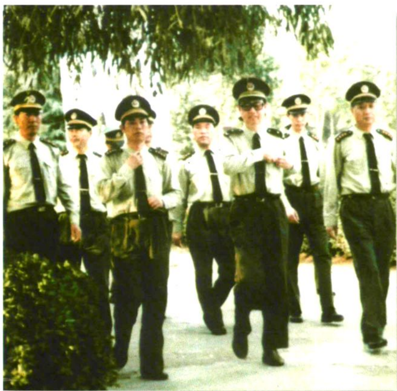
武警部队副司令员王文理在总队长王昌平陪同下来校视察（1994年5月）