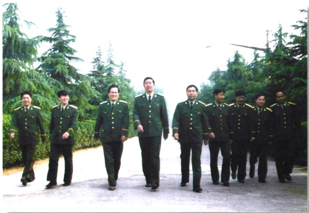
党委“一班人”团结一心，面向未来，阔步前进（1999年4月）