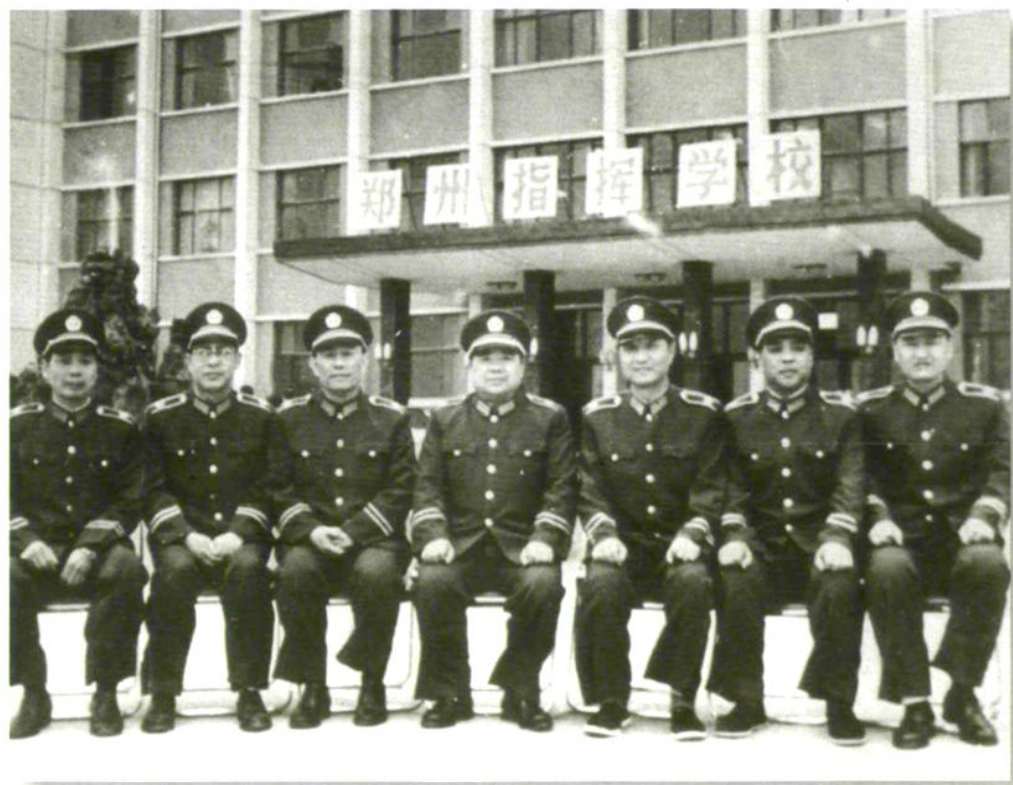
武警部队副政委张海天在总队首长陪同下来校视察（1987年6月）