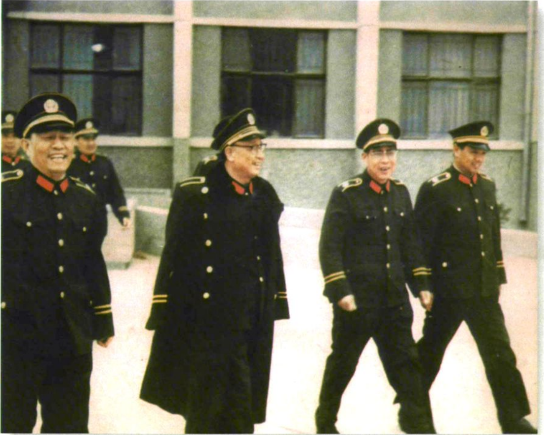
武警部队司令员李连秀在总队长吕永盛陪同下来校视察（1985年3月）