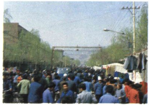
县城物资交流会盛况