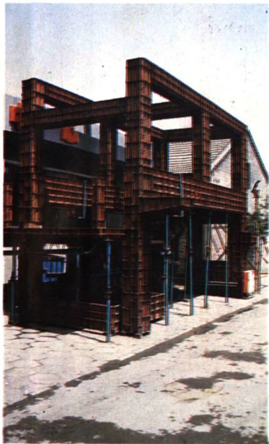
县工程机械总厂生产的组合式钢模板