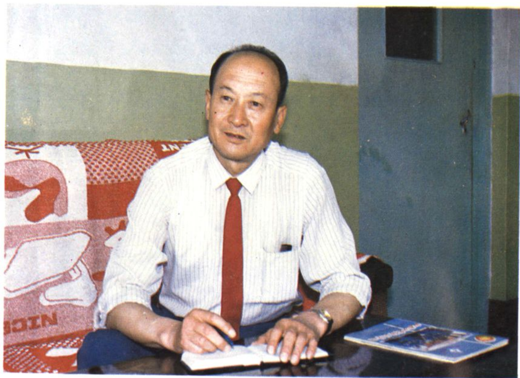
文水县工商行政管理局局长 《文水县工商行政管理志》总审