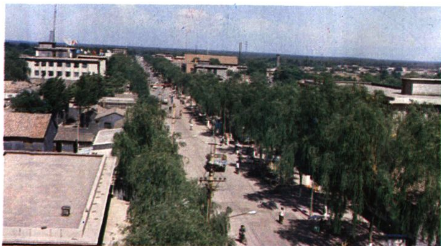
县城东西大街风姿