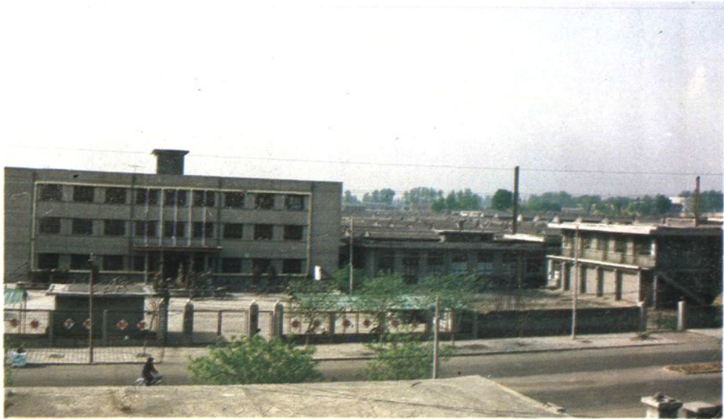
县工商局现址全貌