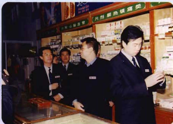
市药监局局长刘峰来县检查工作