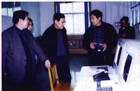
省人大副主任、省总工会主席姚新章（左二）莅临视察工作