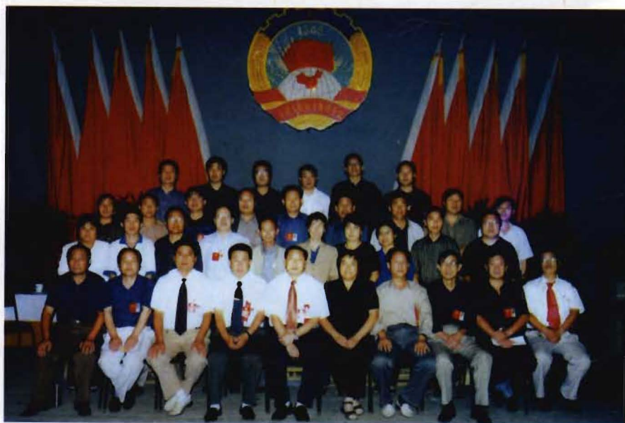
政协主席邹通玺（左五）与政协常委合影