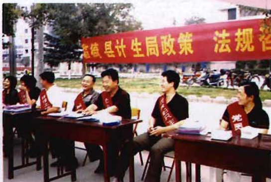
计生政策宣传现场

临猗县计划生育技术服务站，始建于1983年，现有员工30余名，承担全县27万育龄妇女的计划生育、孕情监测、优生优育、生殖保健技术服务及围绕生育、节育、不育开展生殖道感染、出生缺陷干预和避孕节育三大工程。全站配备现代化医疗设备及功能齐全的计生流动服务车，医技专业人员20余名。该站历年被评为“计划生育技术优质服务先进站”。