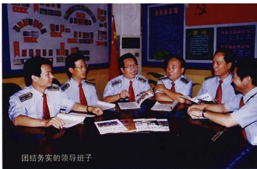
团结务实的领导班子