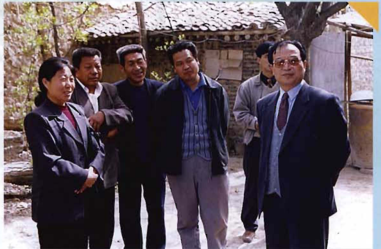
县领导走访察看贫困残疾人生活状况