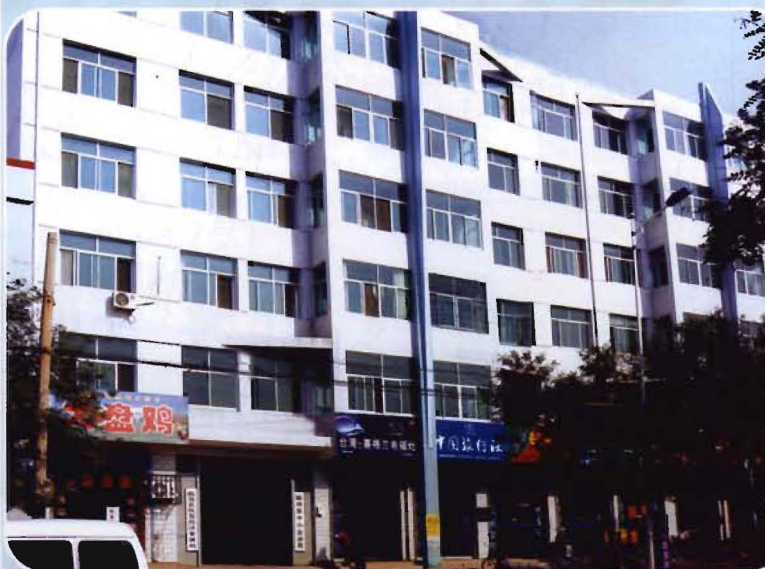
中小企业局办公大楼