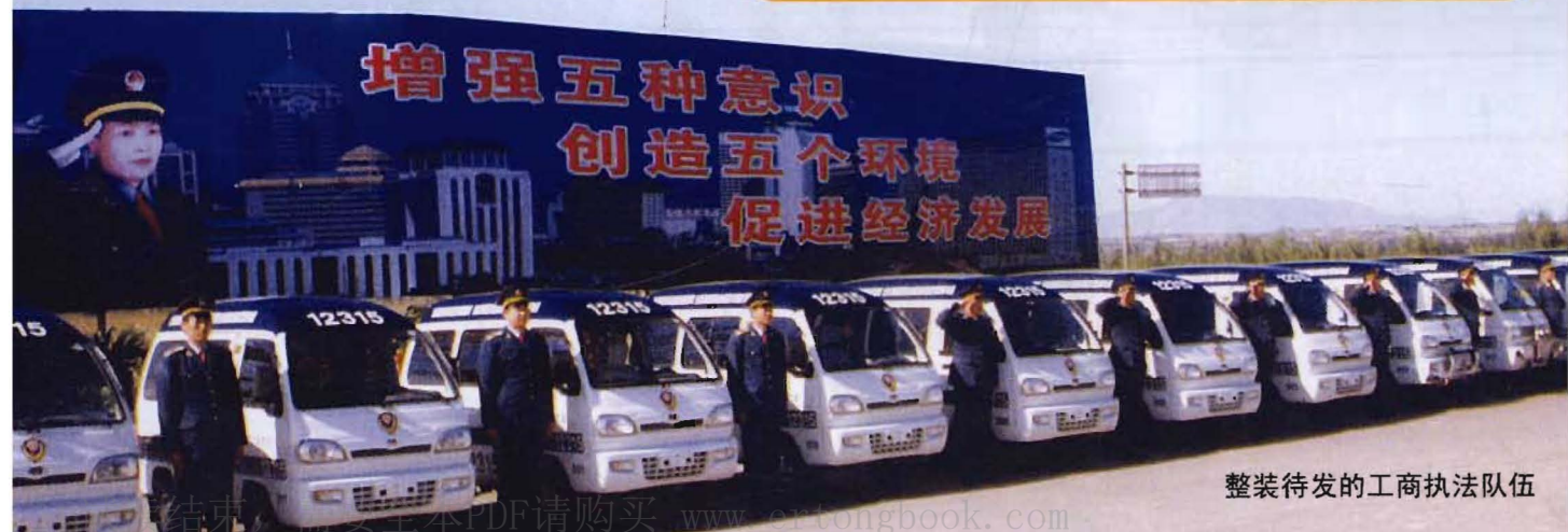
整装待发的工商执法队伍

2002年~2005年，工商局新班子组建后，各项工作取得了长足发展，综合评比连年在全市系统名列前茅。2003年，在省工商局“五增五创促发展”总体要求的指导下，全年工作捷报频传；2004年，查处各类违法案件列全市第一，发展个体工商户和各类企业创历史最高，注册商标数是建局以来最多一年；2005年，该局又在全省率先推行农资连锁经营模式，使广大农民群众得到了更多实惠。