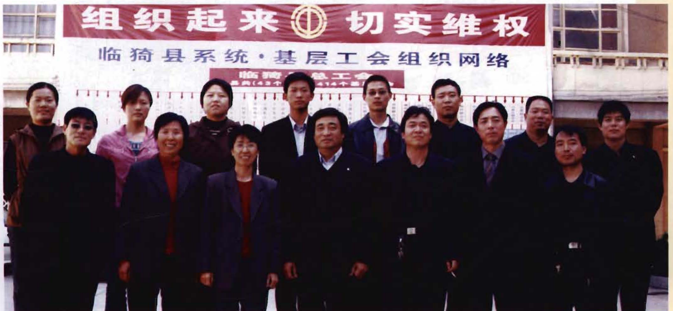
县总工会全体工作人员