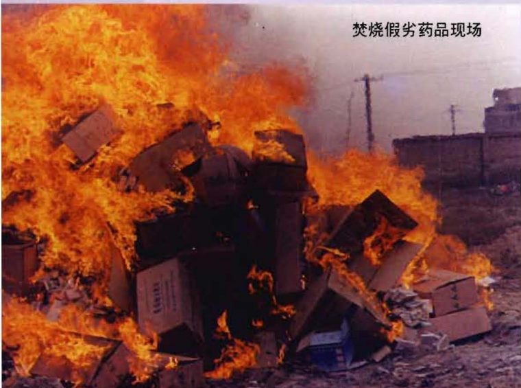
焚烧假劣药品现场