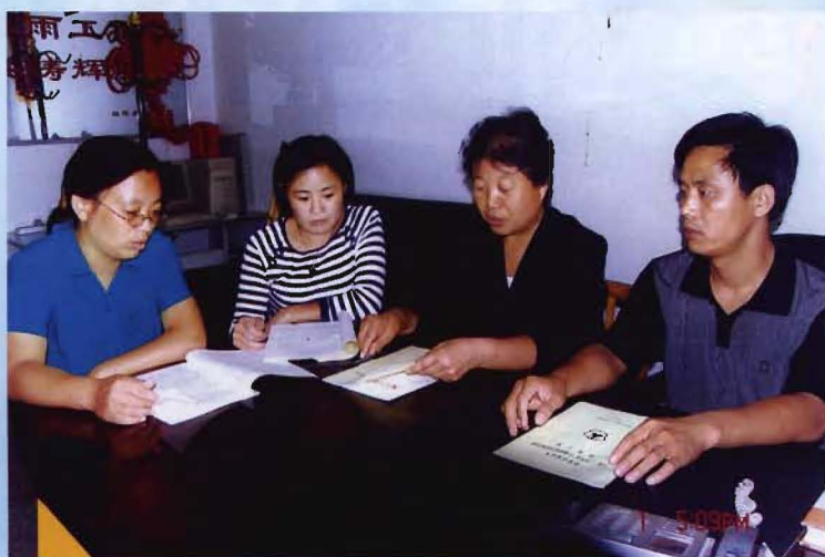
理事会一班人研究商讨残疾人事业发展规划