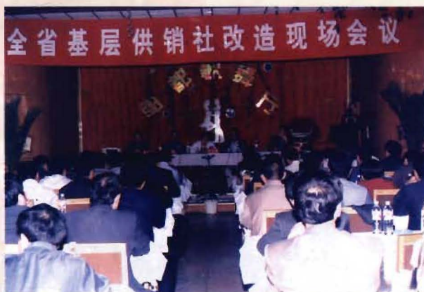
山西省基层供销社改造临猗现场会