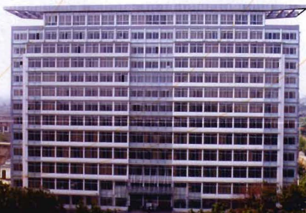
县委综合办公大楼