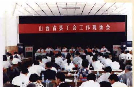
1996年4月山西省总工会在临猗县召开山西省县工会工作现场会