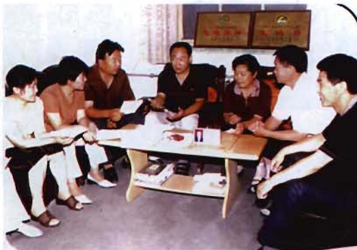
局一班人研究工作