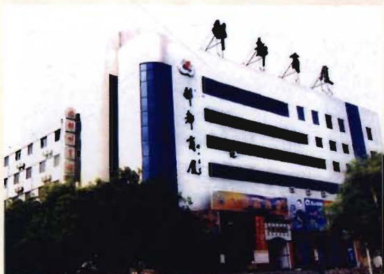
县供销社自筹资金兴建的综合大楼