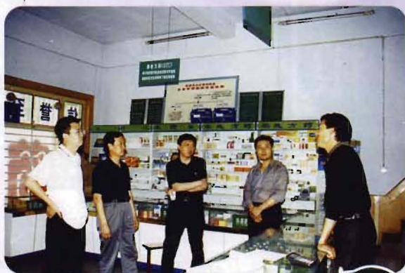
省局领导来县调研药店经营情况