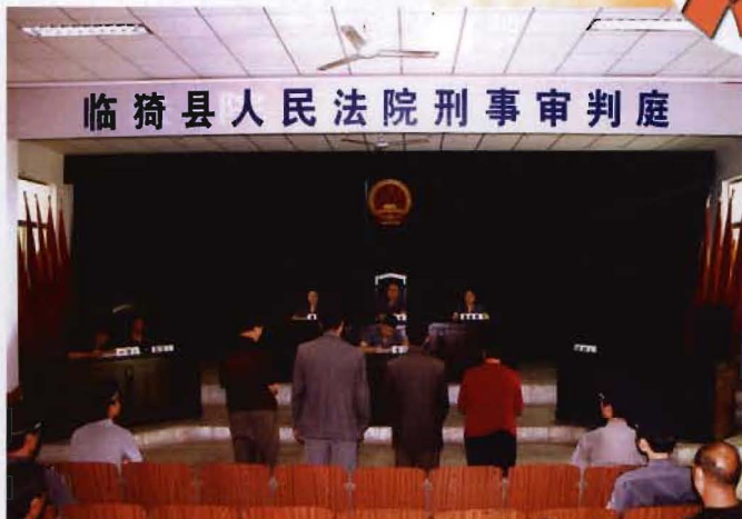
刑事案件审判现场