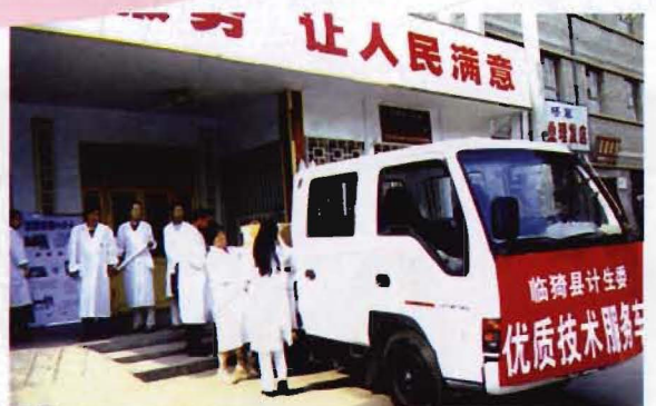
计生服务车整装待发