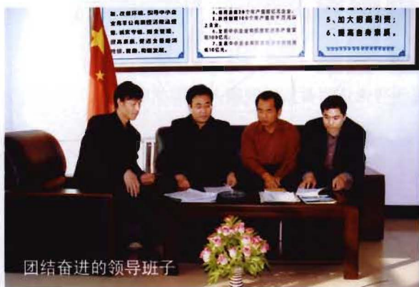
团结奋进的领导班子