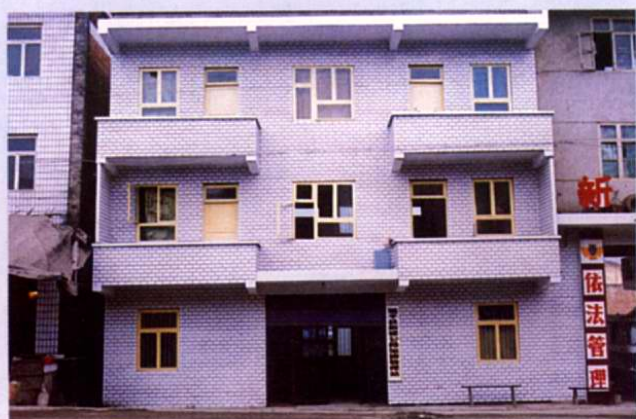
新盛公路運輸管理站