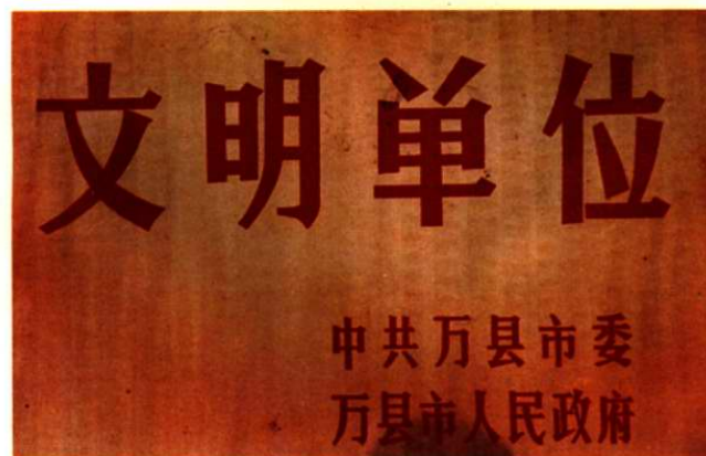
1993年—1995年梁平縣公路運輸管理所連續 被中共萬縣市委、市人民政府命名為文明 單位