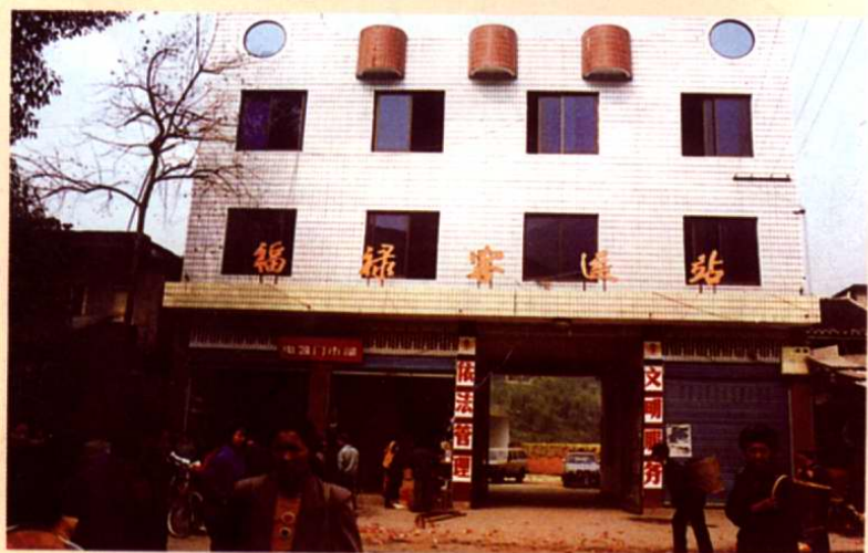
福祿公路運輸管理站