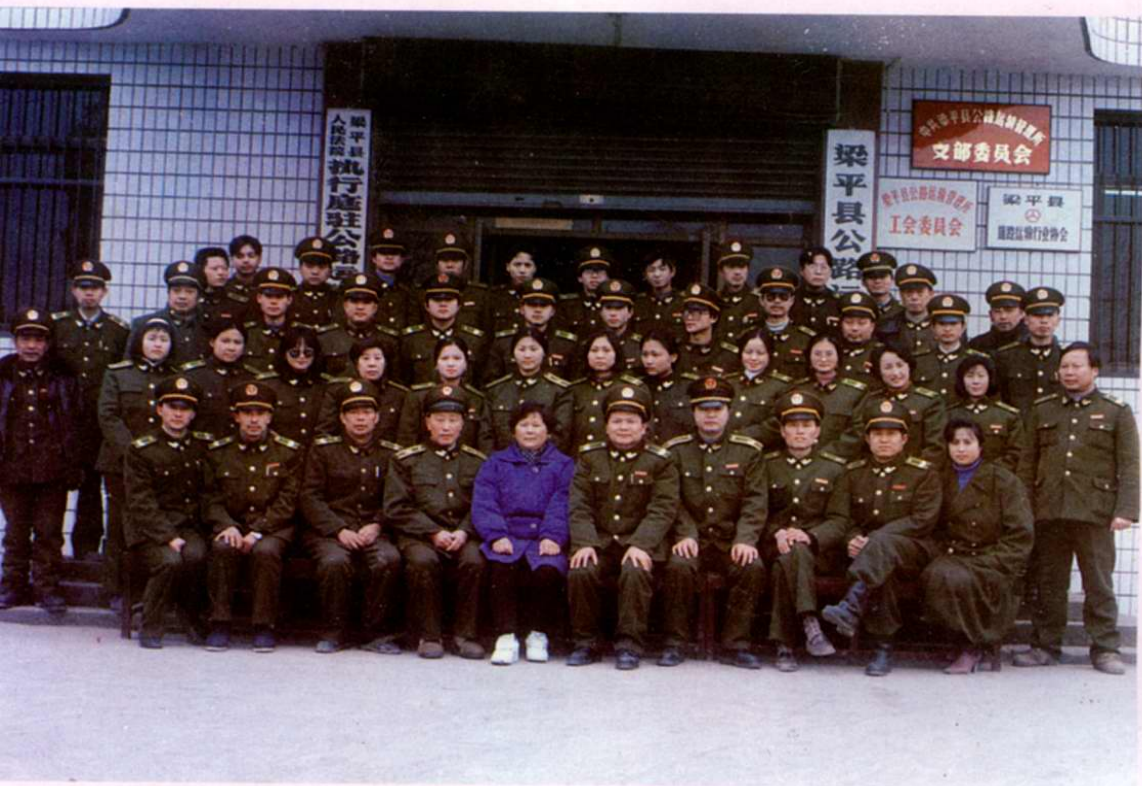
5年全所運政人員合影