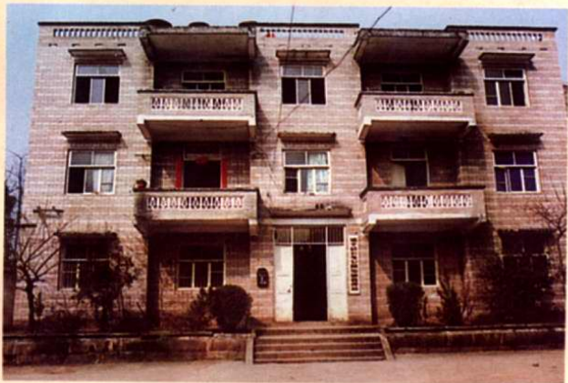
雲龍公路運輸管理站