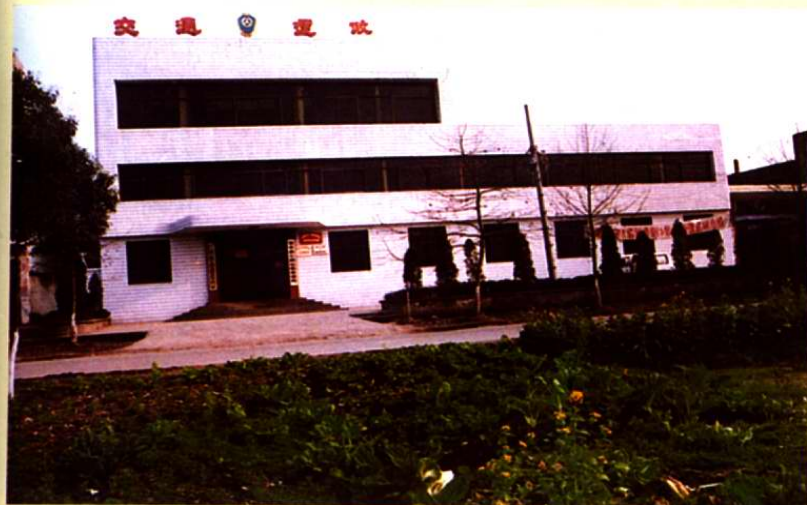
縣運管所辦公大樓一角