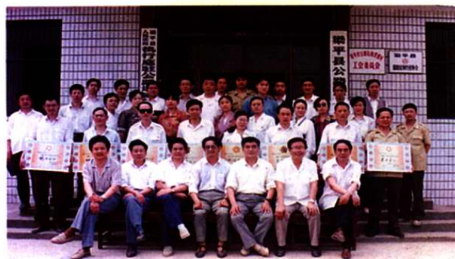
1995年5月萬縣市運管處在梁平運管所召開 客運附加費征收工作表彰會，來自三區八 縣運管所長財務股長合影