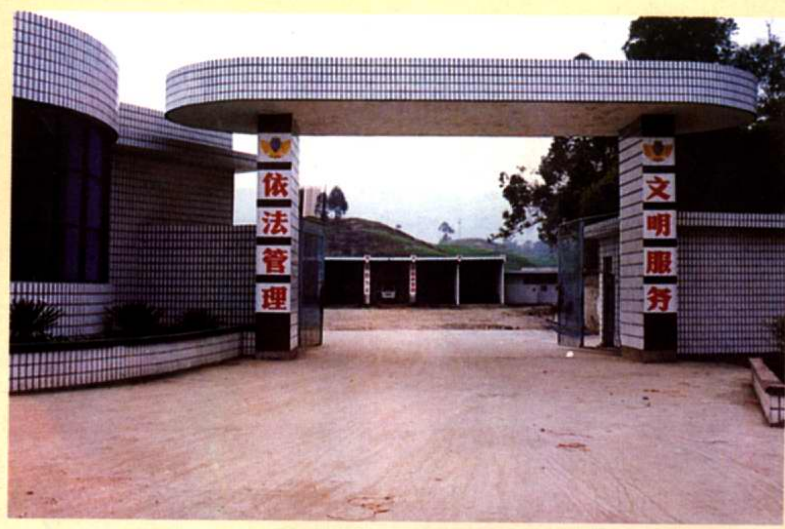
七橋公路運輸管理站