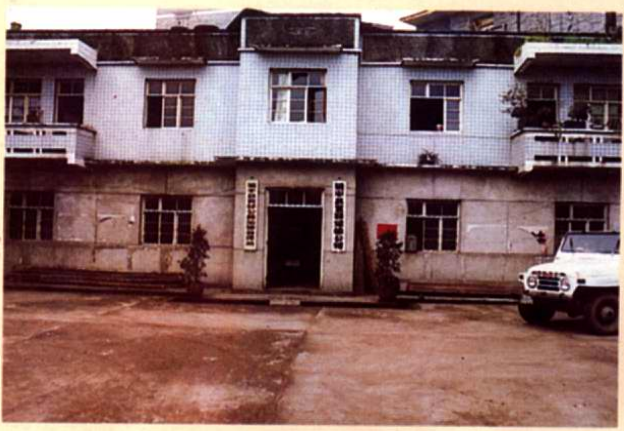
袁驛公路運輸管理站