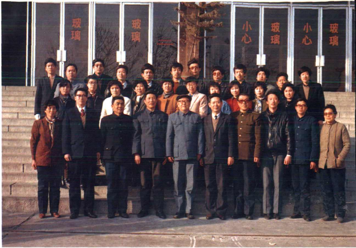
① 邯郸市畜牧水产局机关全体 工作人员