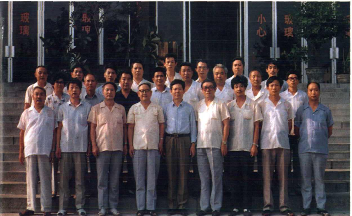
② 各畜牧水产公司、场、站领导干部