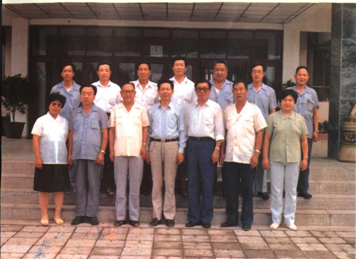
① 县(市)、区畜牧水产领导干部