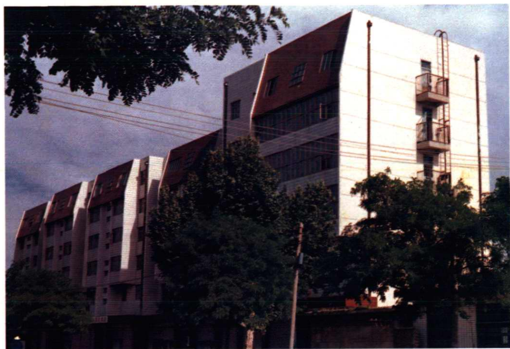
① 邯郸市牛奶公司办公大楼