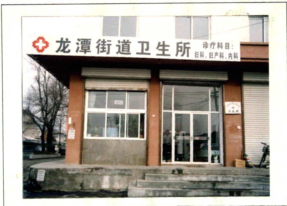
龙潭街道卫生所办公楼照片