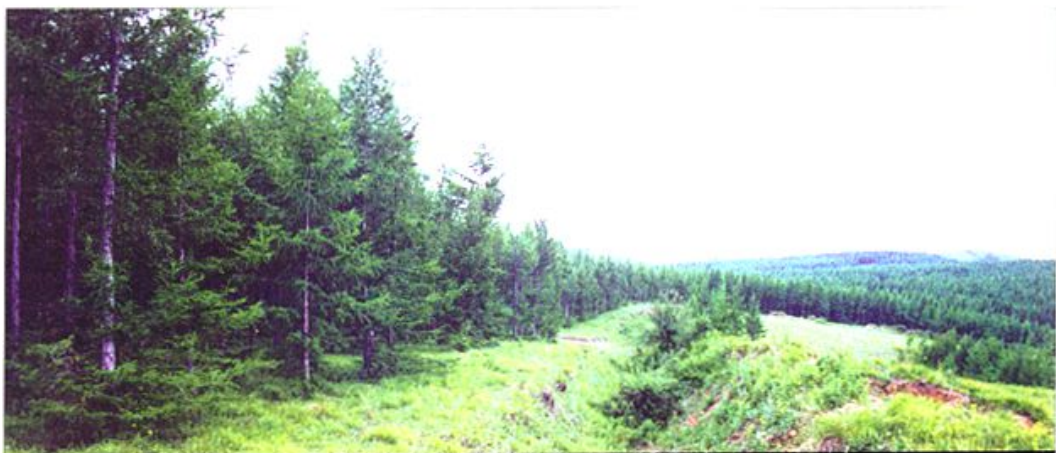
△ 国营林场万亩人工林