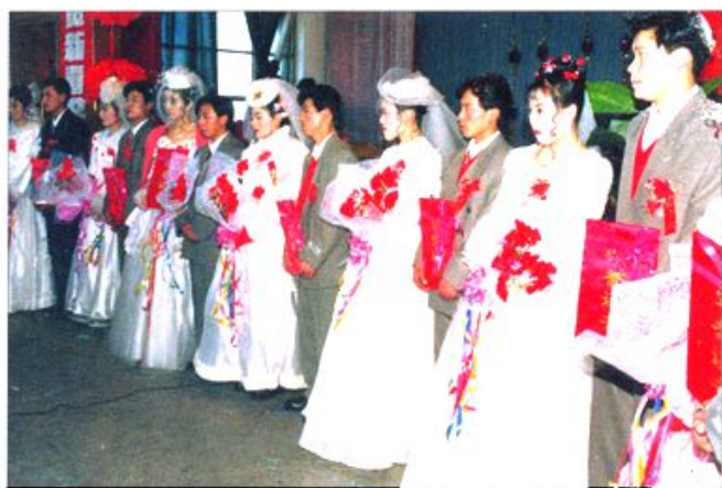
国营农场集体婚礼