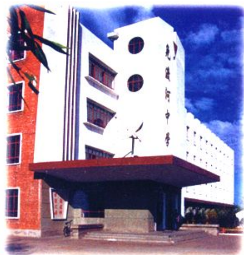
免渡河中学教学楼