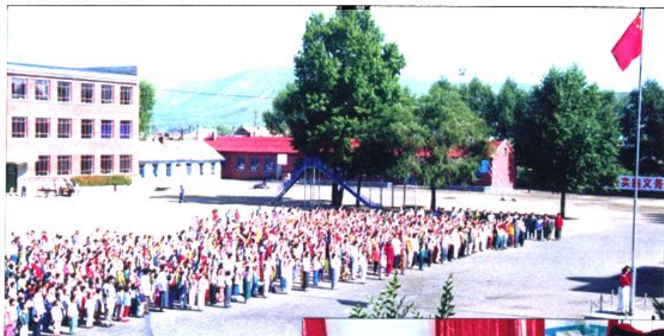
免渡河第一小学升旗仪式