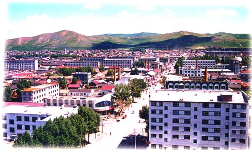
富饶美丽的免渡河镇