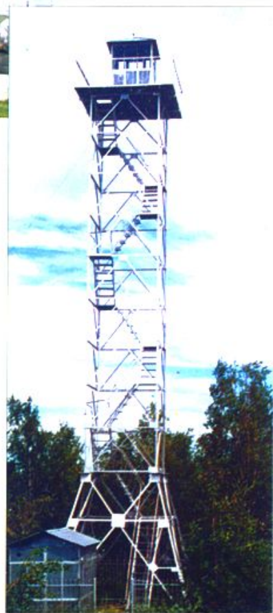
林业局防火瞭望塔