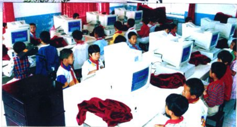
免渡河第二小学微机课