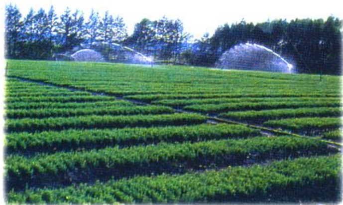
林业局扎河中心苗圃