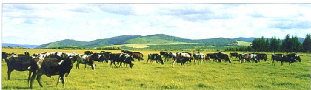
△ 北头河牧业村牛群