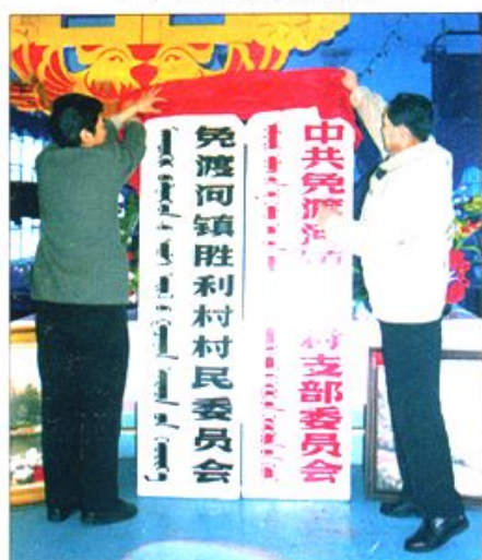
△ 胜利村村民委员会