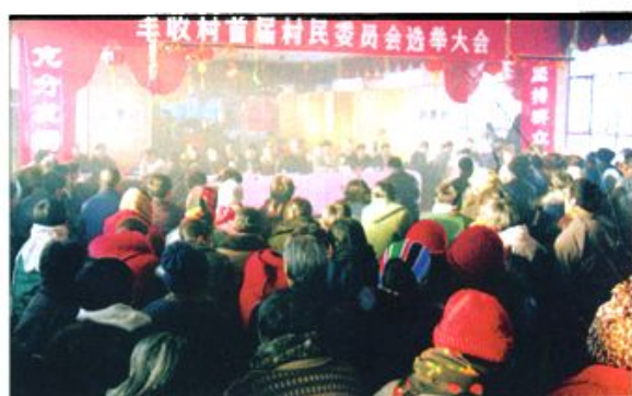
△ 丰收村村民委员 选举大会