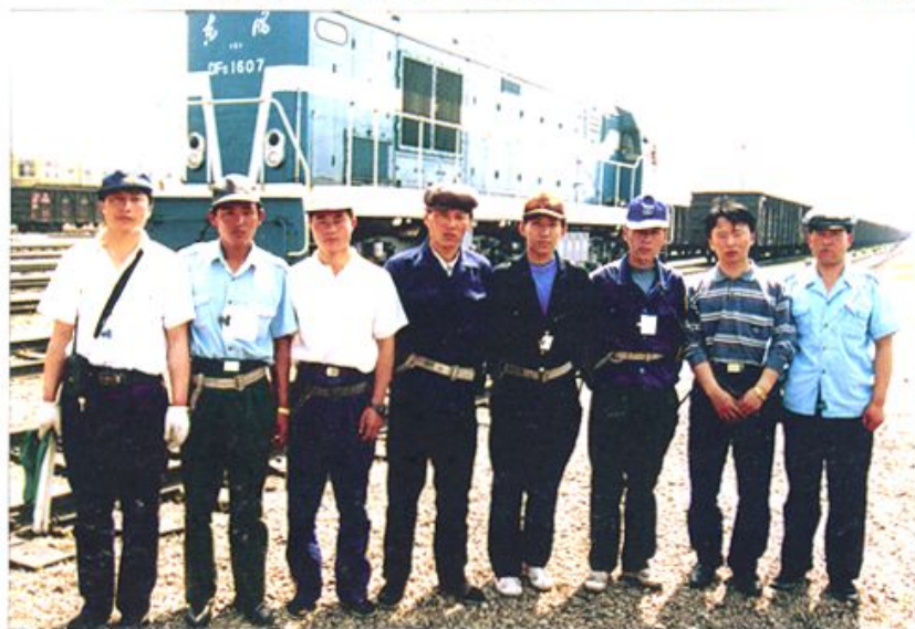
铁路“全国青年号”调车组