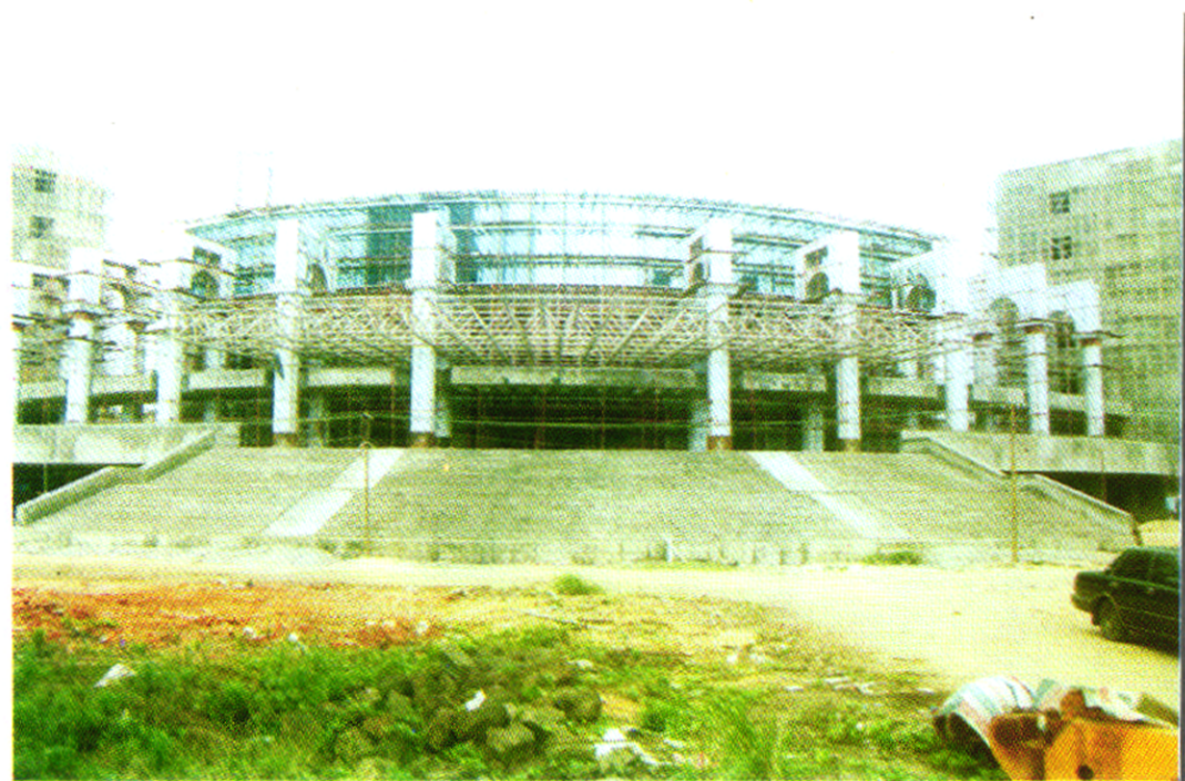
正在建设中的海口市人民大会堂（1998年2月摄）