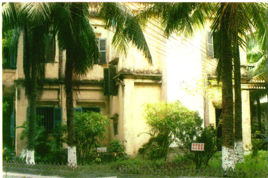
市七、八、九届人大常委会机关办公所在地（原市大同路市委、市政府办公大院旧址）。