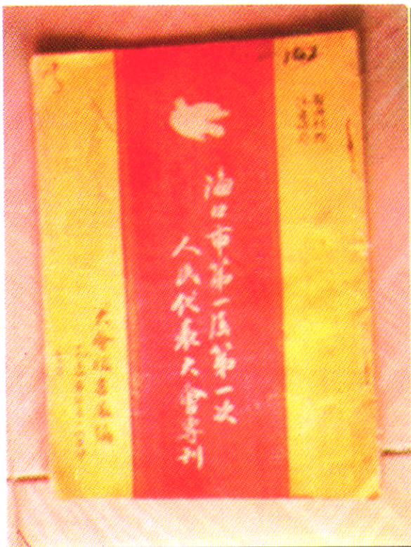
第一次会议专刊 1954年编印的《海口市第一届人民代表大会