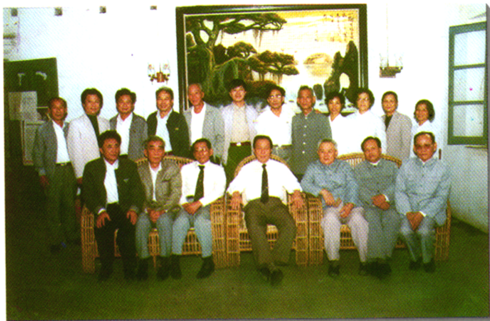
市九届人大常委会组成人员。