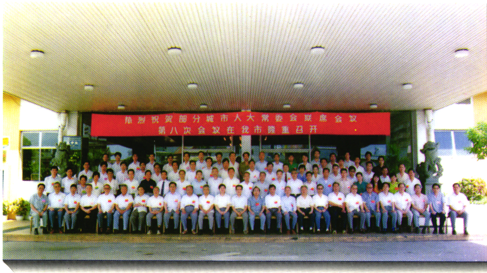
全国部分城市人大常委会第八次联席会议于1992年6月在海口市召开（我市人大常委会为这次会议东道主）。图为会议全体代表合影。