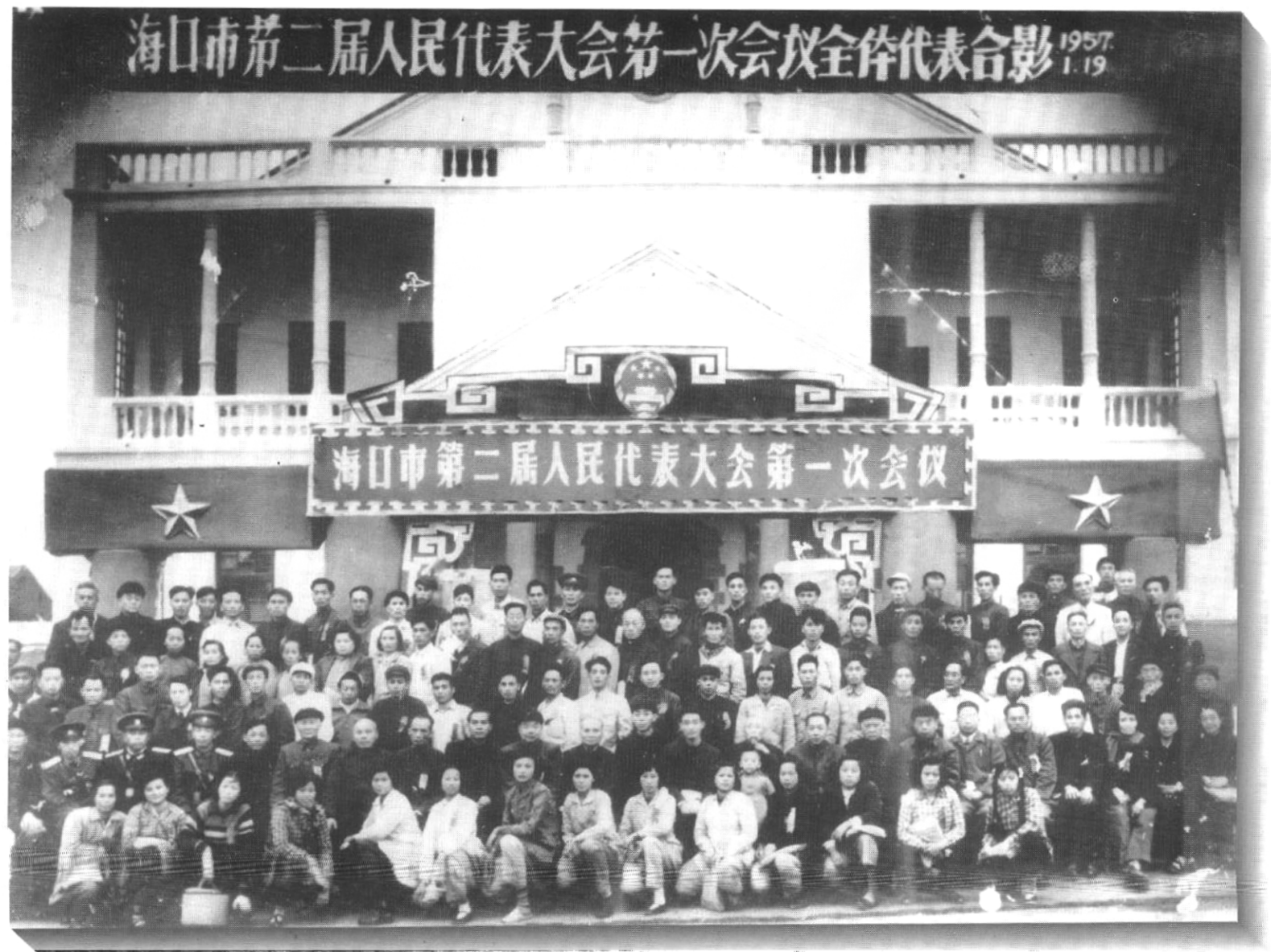
1957年1月，海口市二届人民代表大会第一次会议在中山路市工商联办公楼举行。