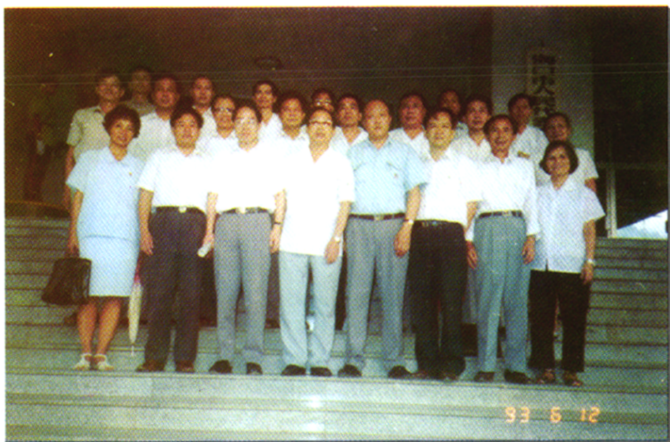
市十届人大常委会组成人员（部分）与市长曾浩荣、副市长张海国在一起。