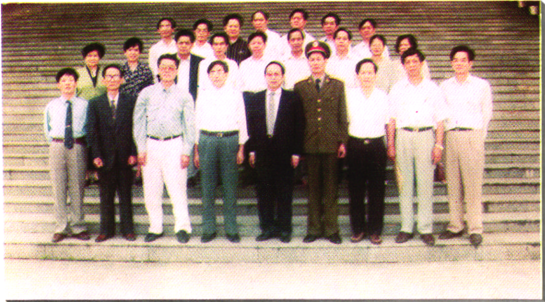
市十一届人大常委会组成人员