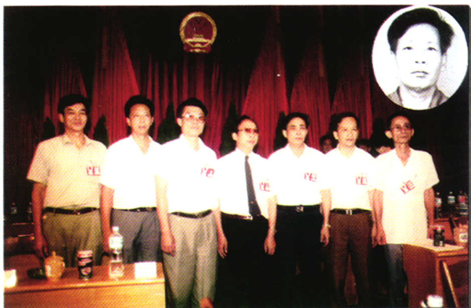
市十一届人大一次会议选举产生的市人大常委会主任、副主任和秘书长。从右起：黄钻永、王光兴、吉家槐、李金云、严崇喜、韩宇东、潘鸿英（秘书长）。1997年2月28日举行的市十一届人民代表大会第五次会议增选杨少华为副主任（右卜角）。