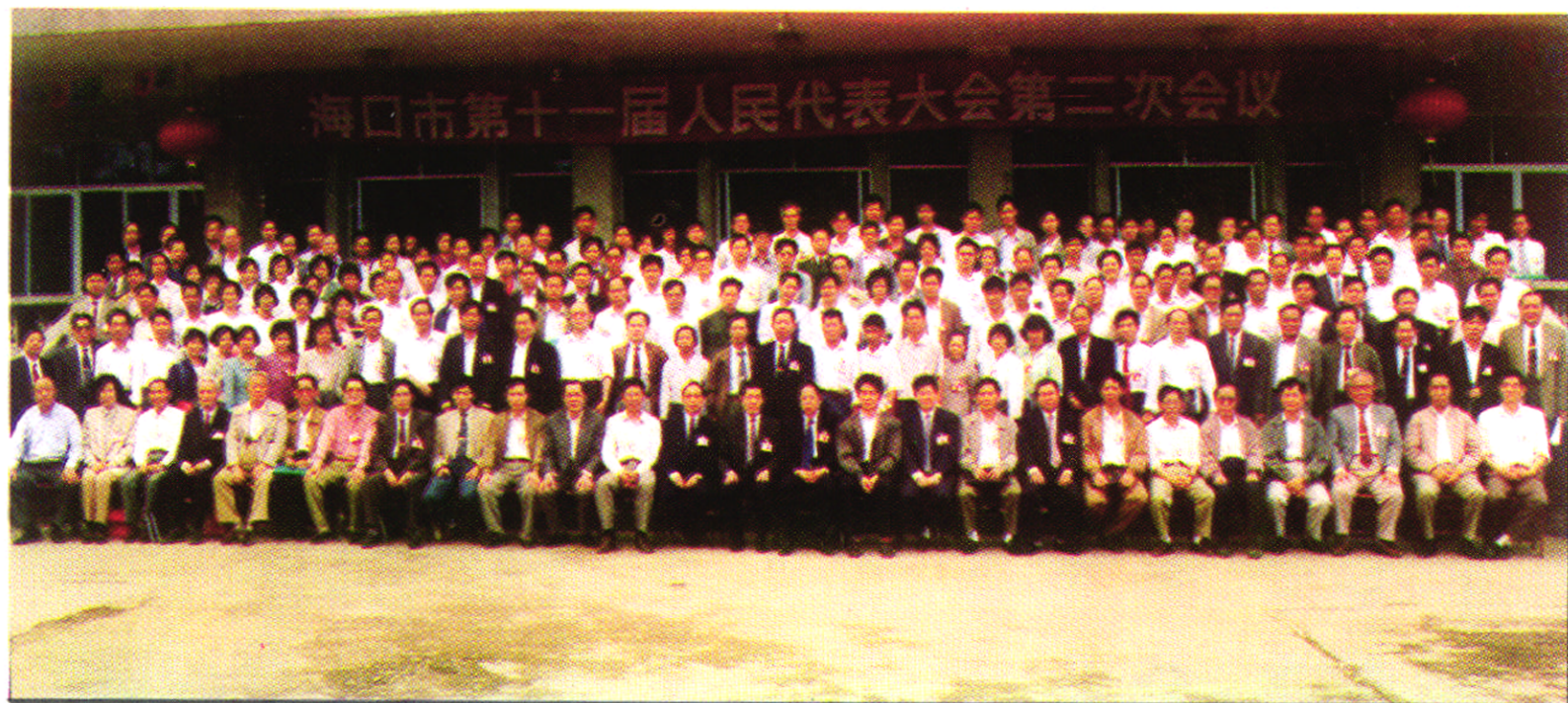
1994年3月，海口市十一届人民代表大会第二次会议在海口戏院举行。