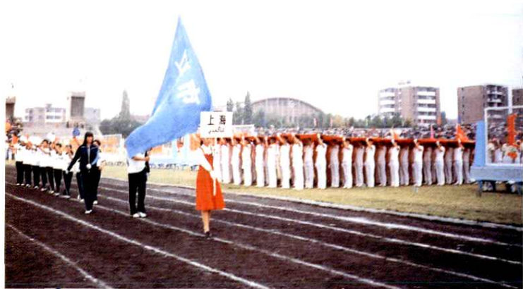
1995年1月举办的上海'95中国民族风——全国56个民族音乐舞蹈邀请展演