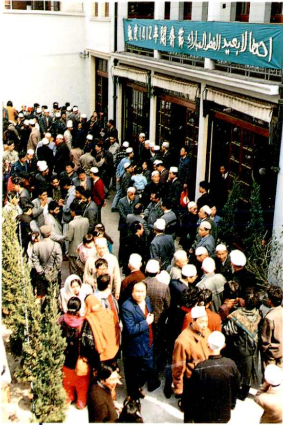
上海穆斯林欢度开斋节