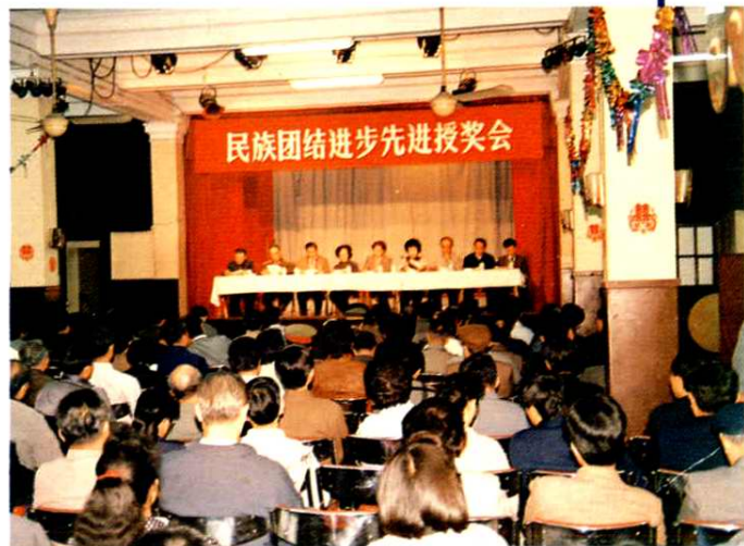
1990年11月,上海市政府受国家民委委托召开民族团结进步先进授奖会