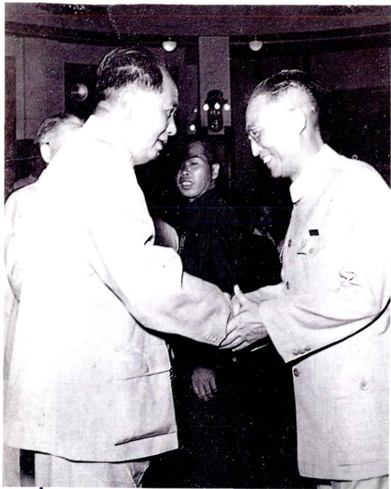
1956年7月，毛泽东接见上海各民族参观团 (右为上海市民委主任金学成)