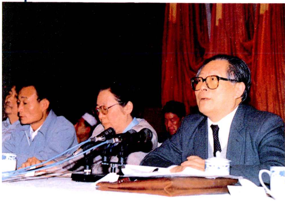
1988年5月，江泽民 在上海市民族团结进步 表彰大会上作重要讲话