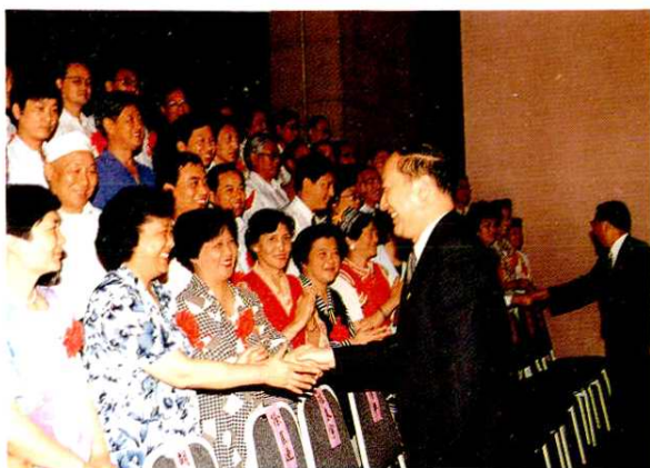
1995年,上海市市长徐匡迪等领导接见上海市民族团结进步模范集体代表和模范个人