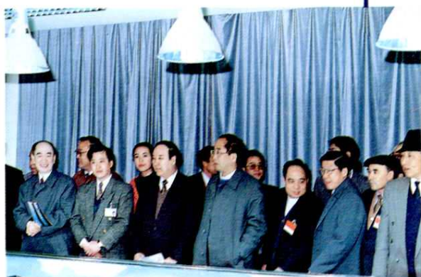
1995年,国务委员司马义·艾买提(左三)、国家民委常务副主任陈虹(左一),由上海市副市长赵启正(左四)陪同到浦东新区考察