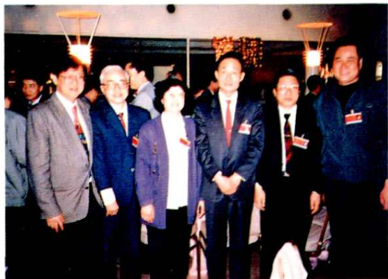
1993年,国务院副总理吴邦国(右三)在北京与部分上海少数民族全国人大代表合影