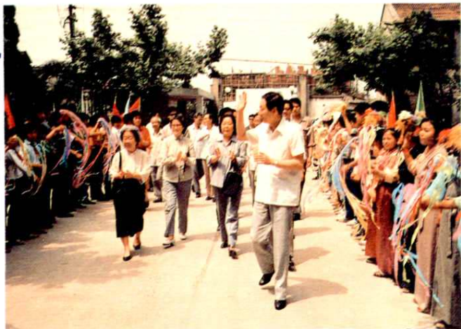
1989年,上海市市长朱镕基到上海市回民中学看望师生