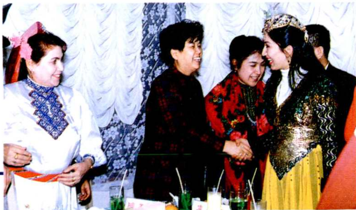
1995年,中共上海市委副书记陈至立接见上海'95中国民族风展演部分演员