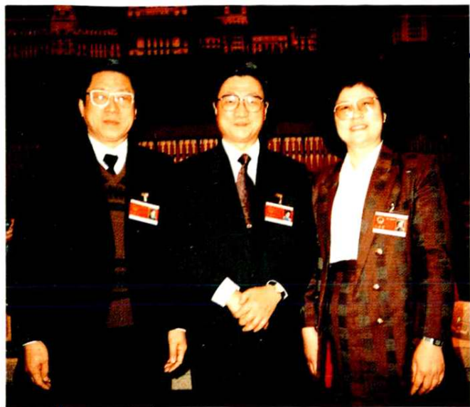
1993年,中共中央政治局委员、上海市委书记黄菊与上海少数民族全国人大代表合影