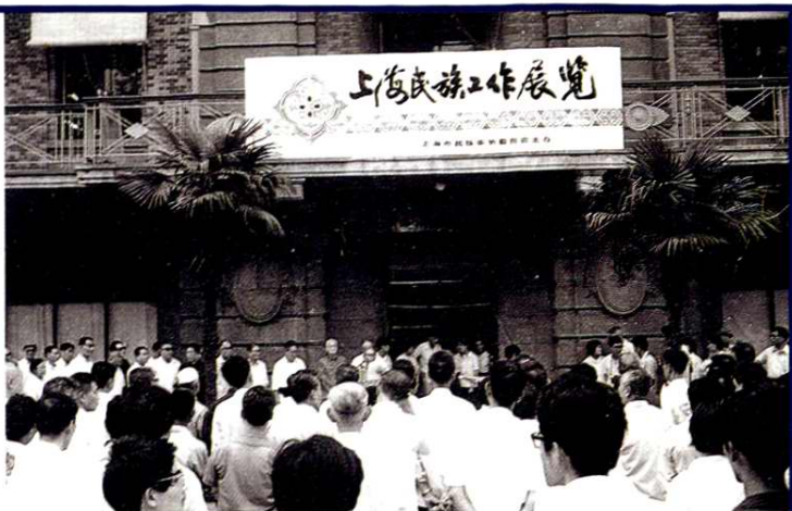
1995年召开的贯彻《上海市少数民族权益保障条例》座谈会