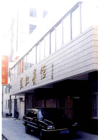
1996年建成的凯虹宾馆 (又称民族招待所)