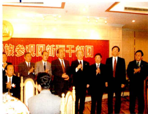
1996年,中共上海市委、上海市政府领导欢迎全国少数民族参观团新疆干部团