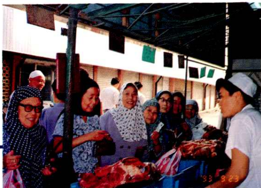
上海穆斯林居民购买清真副食品