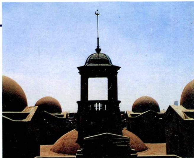
小桃园清真寺望月亭