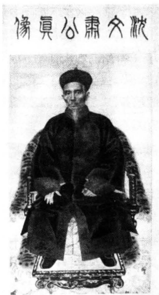
首任船政大臣沈葆楨的画像。 [1]