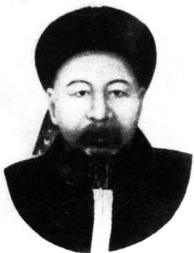
船政创始人，闽浙总督左宗棠。

Giguel) 也获得了左宗棠的信任和好感。数年后，当左宗棠试图自造蒸汽舰船时，这两位法国人成了其重要的合作者。