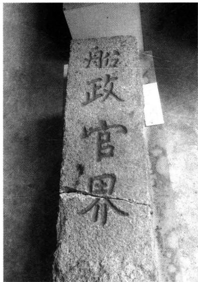
船政基址界碑，中国船政文化博物馆收藏。