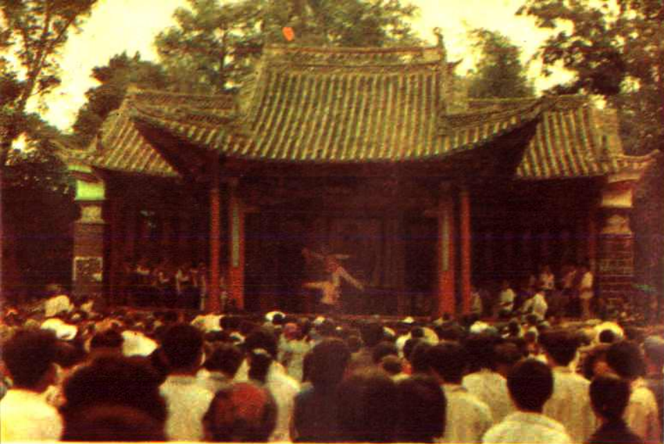
← 玉溪九龙池古戏台