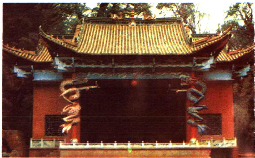
→ 易门大龙泉古戏台