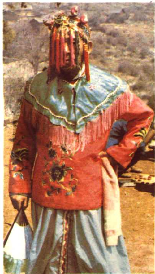
← 澄江松园太平花灯旦角扮相