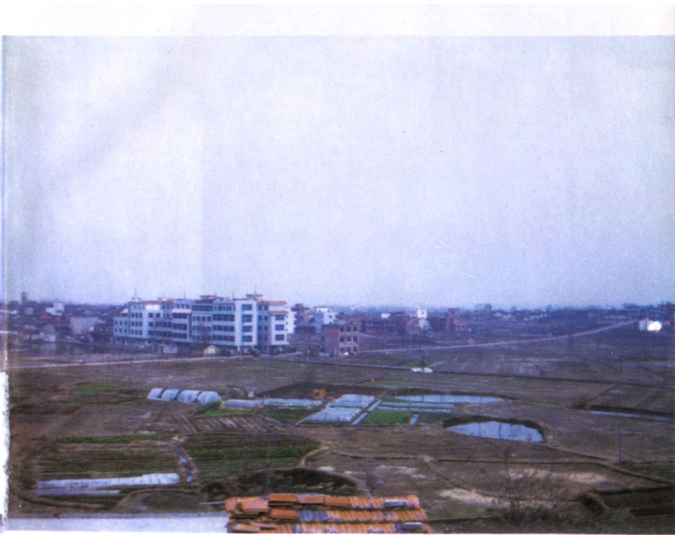
从西边眺瞰前洪村中间部分