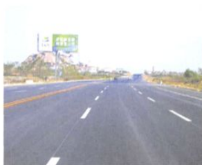
□ 青岛滨海公路即墨段