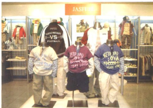
□ 即发集团产品展示