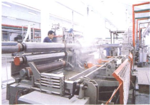
□ 即发集团印染车间