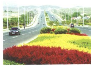
□ 鹤山路城区东部路段