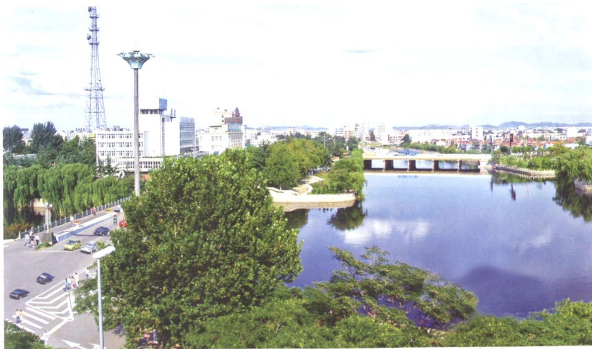
□ 墨水河（原淮沙河）与龙泉河（原远西河）于城区中心蜿蜒相汇，西南流经城阳区注入胶州湾