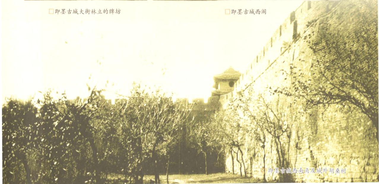
即墨古城西南角及城外胡桑村