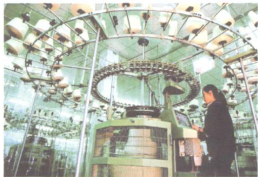
□ 即发集团程控自动织布