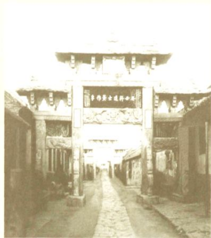
□即墨古城大街林立的牌坊