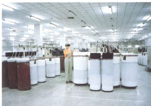
□ 即发集团现代化针织车间