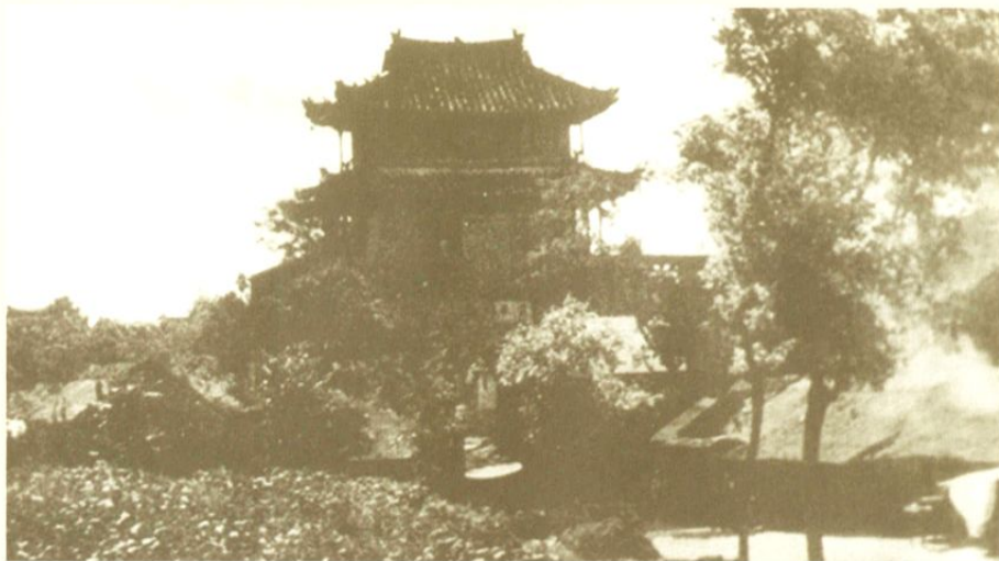
□民国时期的即墨古城东阁