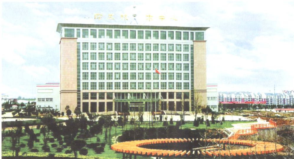
□ 即发集团技术中心