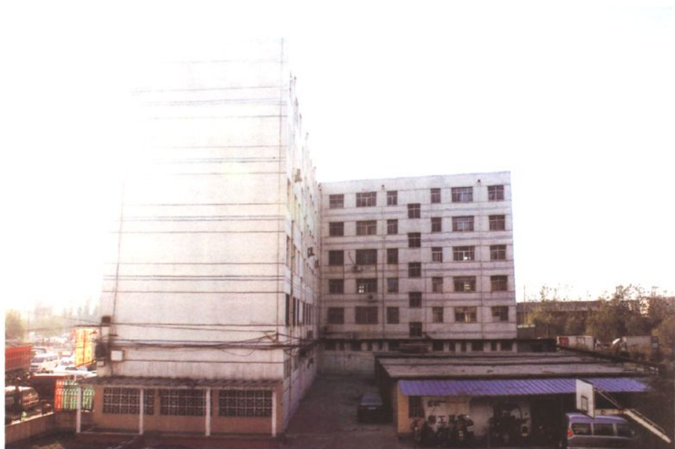
市绣惠渠灌溉管理处宿舍区 (2008年 摄)