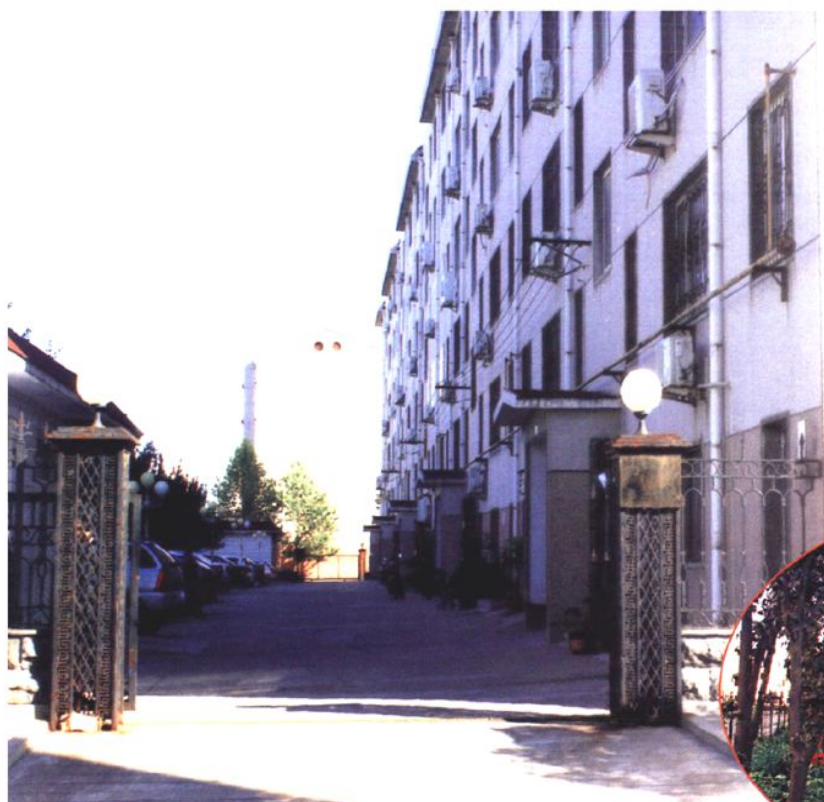
市水务局第三宿舍区 (2008年 摄)