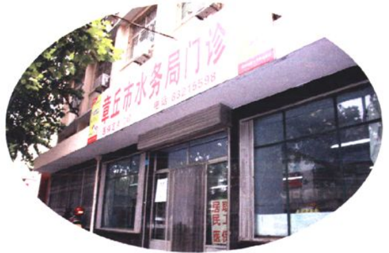
局机关门诊部 (2009年 摄)