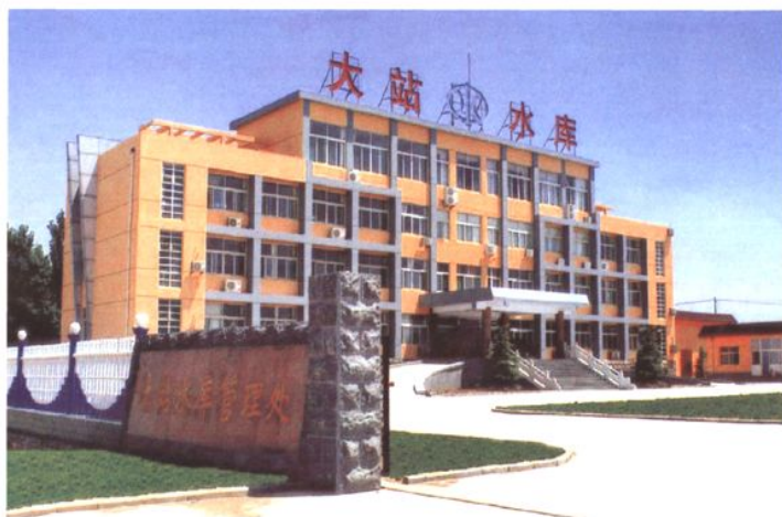
市大站水库管理处 (2009年 摄)