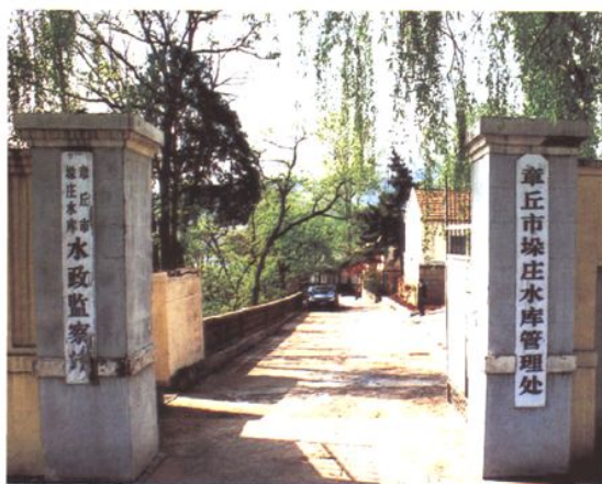
市垛庄水库管理处 (2008年 摄)