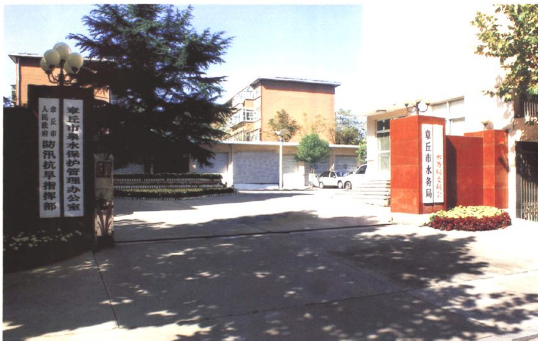
市水务局 (2008年 摄)