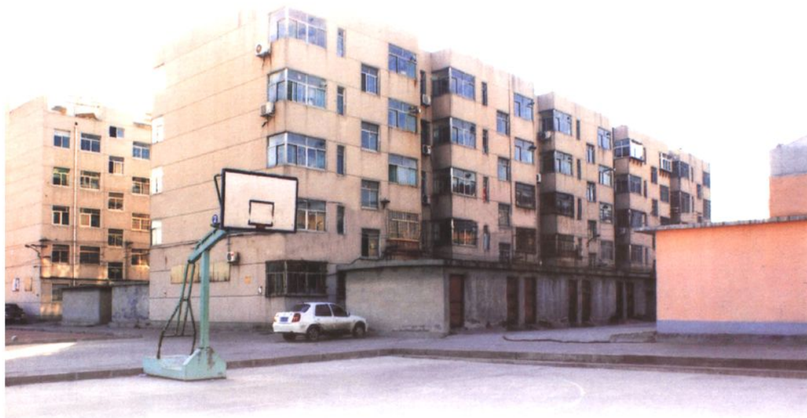
市水利建筑工程公司宿舍区 (2008年 摄)