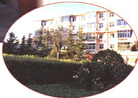
市水务局第一宿舍区一角 (2008年 摄)