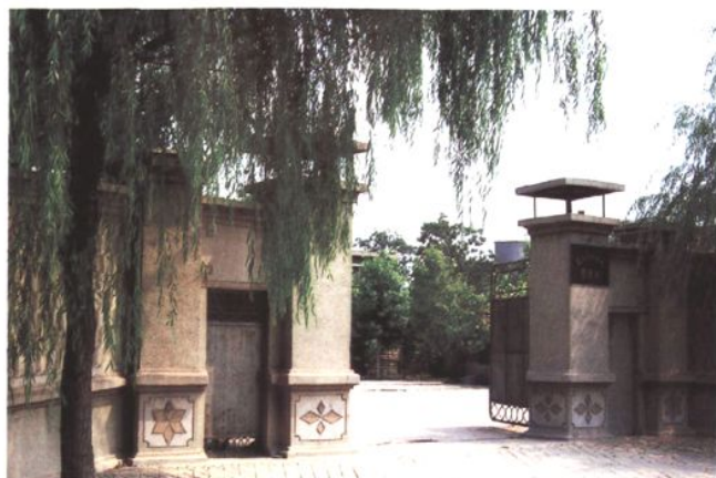
市杏林水库管理处 (2006年 摄)