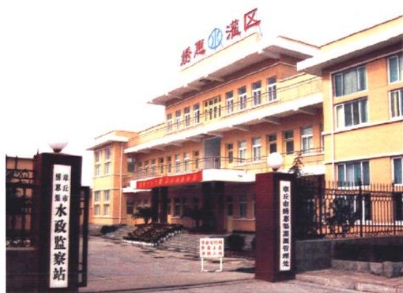
市绣惠渠灌溉管理处 (2004年 摄)