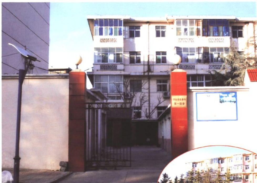
市水务局第一宿舍区 (2008年 摄)