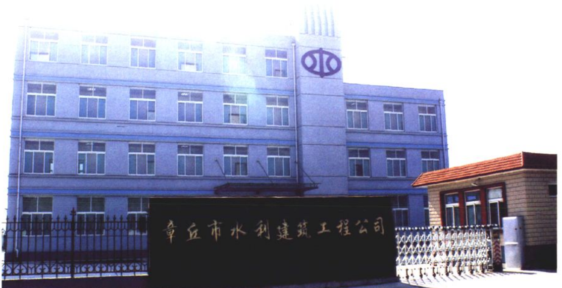
已建成的市水利建筑工程公司 (2008年 摄)