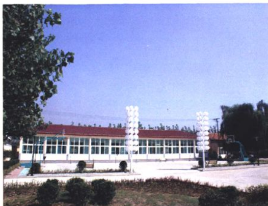
市引黄灌溉工程管理处办公区 (2009年 摄)