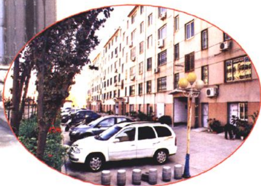
市水务局第三宿舍区一角 (2008年 摄)