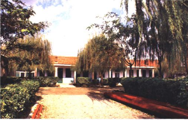
市打井队办公区 (2008年 摄)