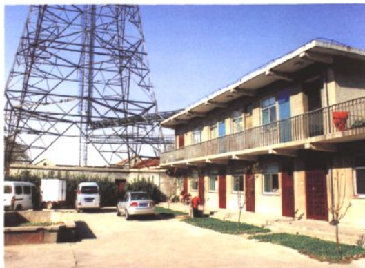
引黄济青章丘刁镇微波站 (2008年 摄)