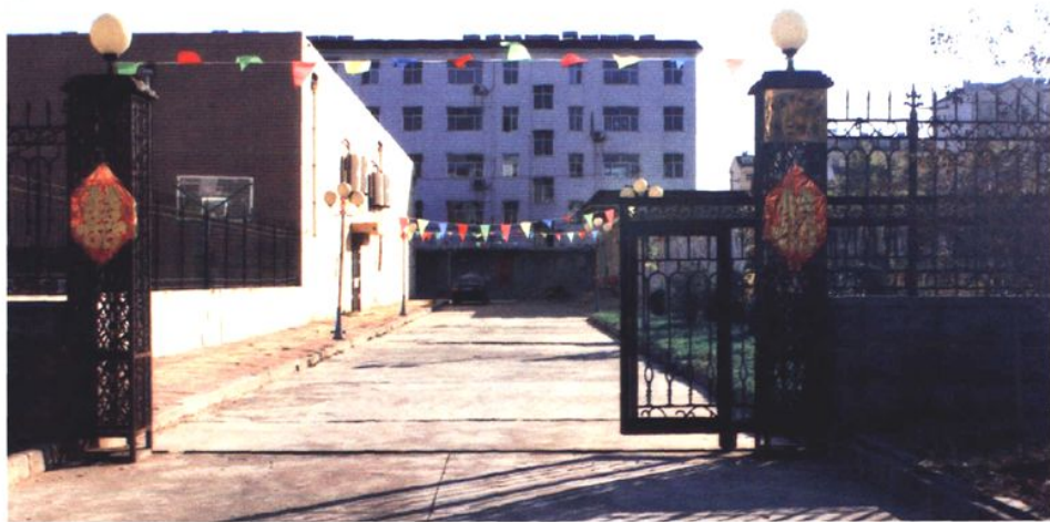
市水务局第二宿舍区 (2008年 摄)