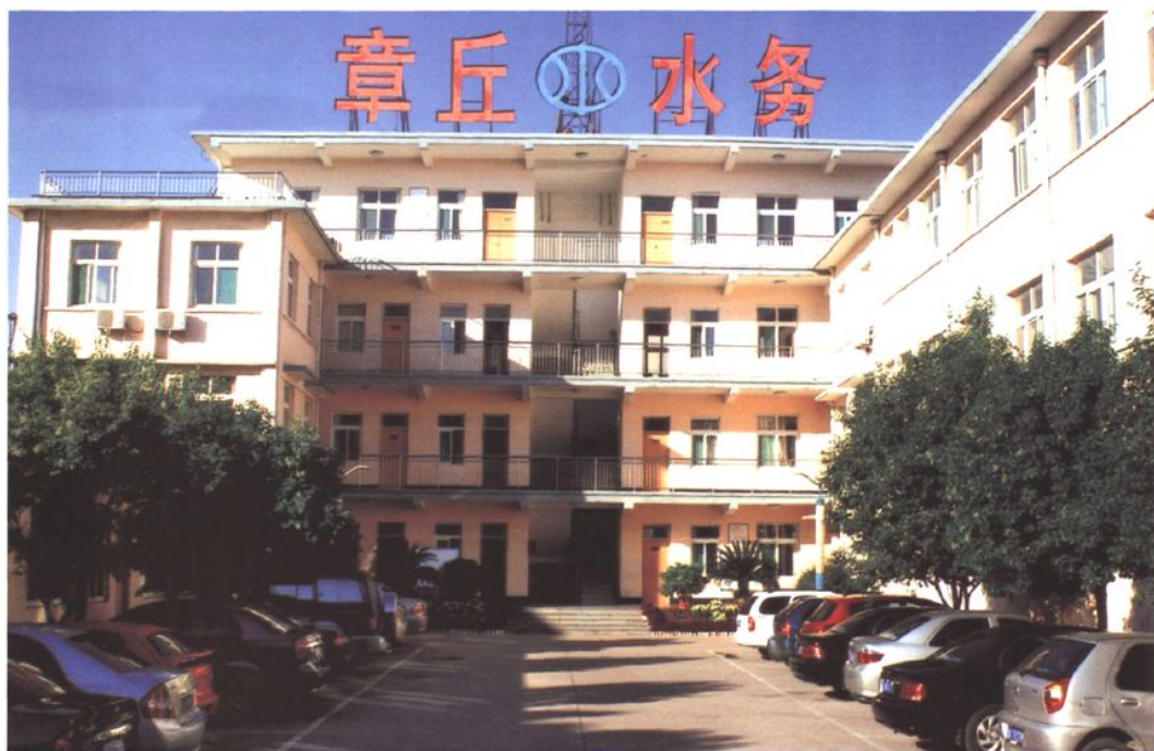
市水务局机关办公楼 (2008年 摄)