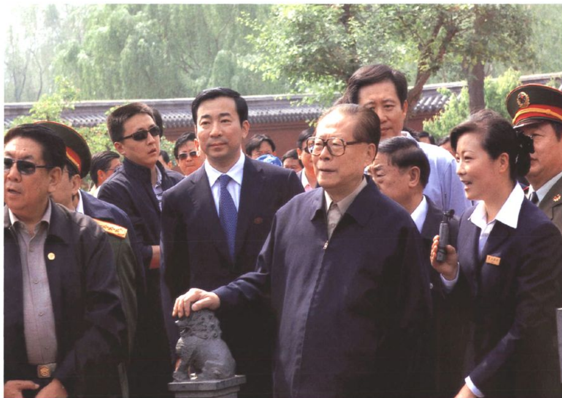
2006年5月4日，原中共中央总书记、国家主席、中央军委主席江泽民视察章丘