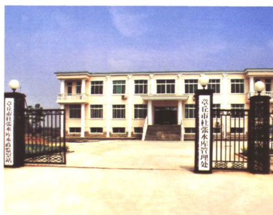
市杜张水库管理处(2007年 摄)