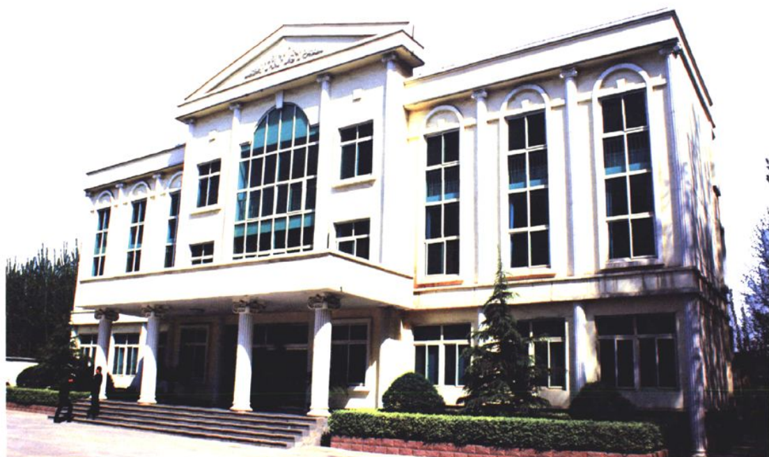
市小清河管理处 (2009年 摄)