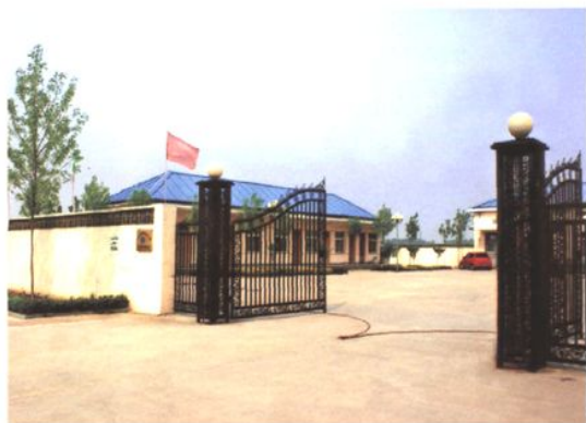
市兴泉供水有限责任公司 (2009年 摄)