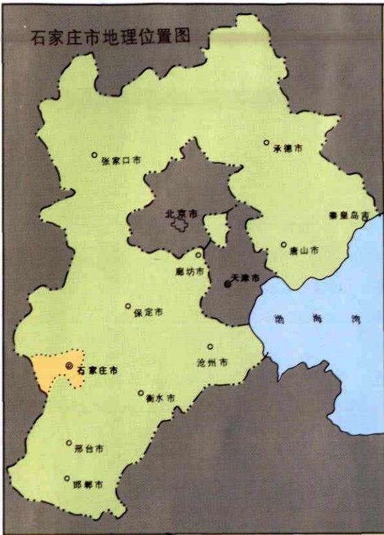
石家庄市地理位置图