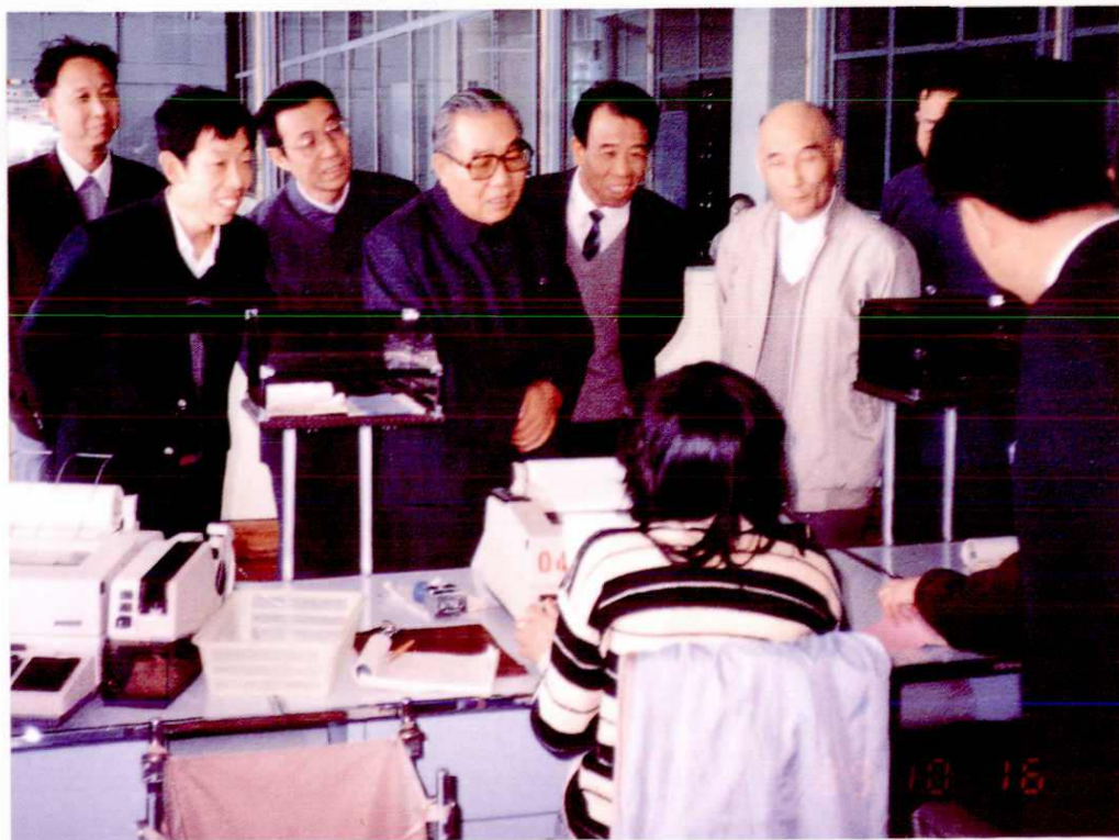
省长岳岐峰(中排左二)视察公众电报机房(1989年10月)