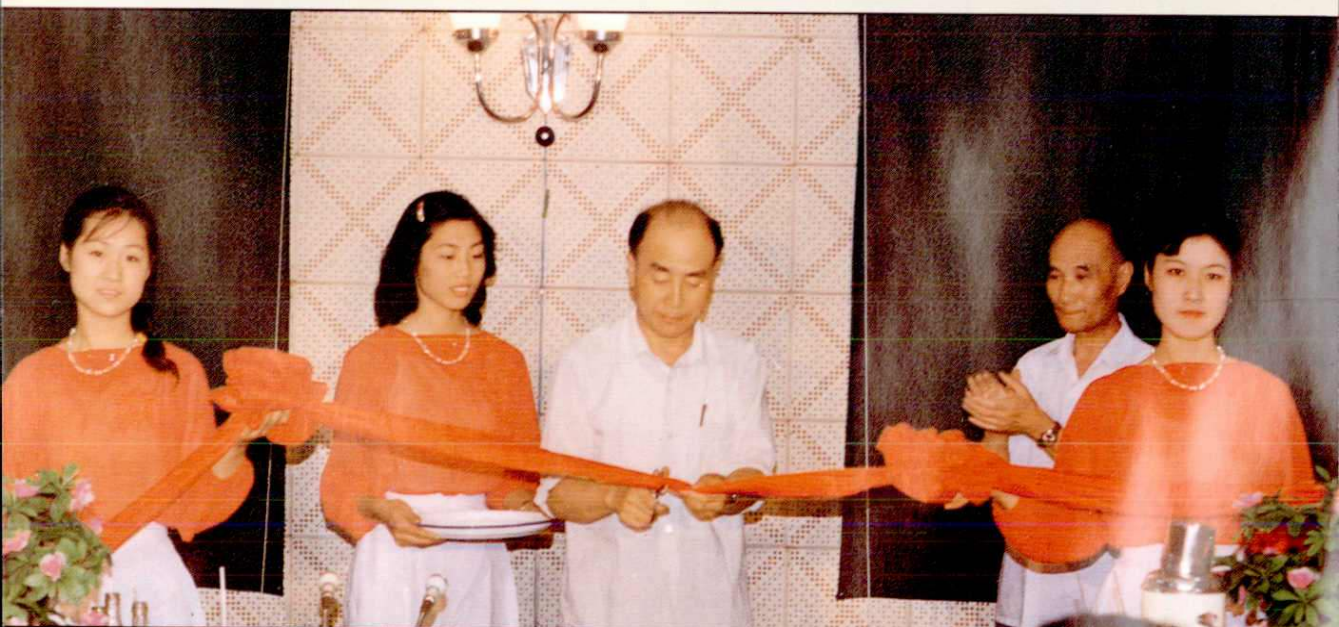
副省长宋叔华(中)为“河北长途自动电话网开通仪式”剪彩(1986年6月)