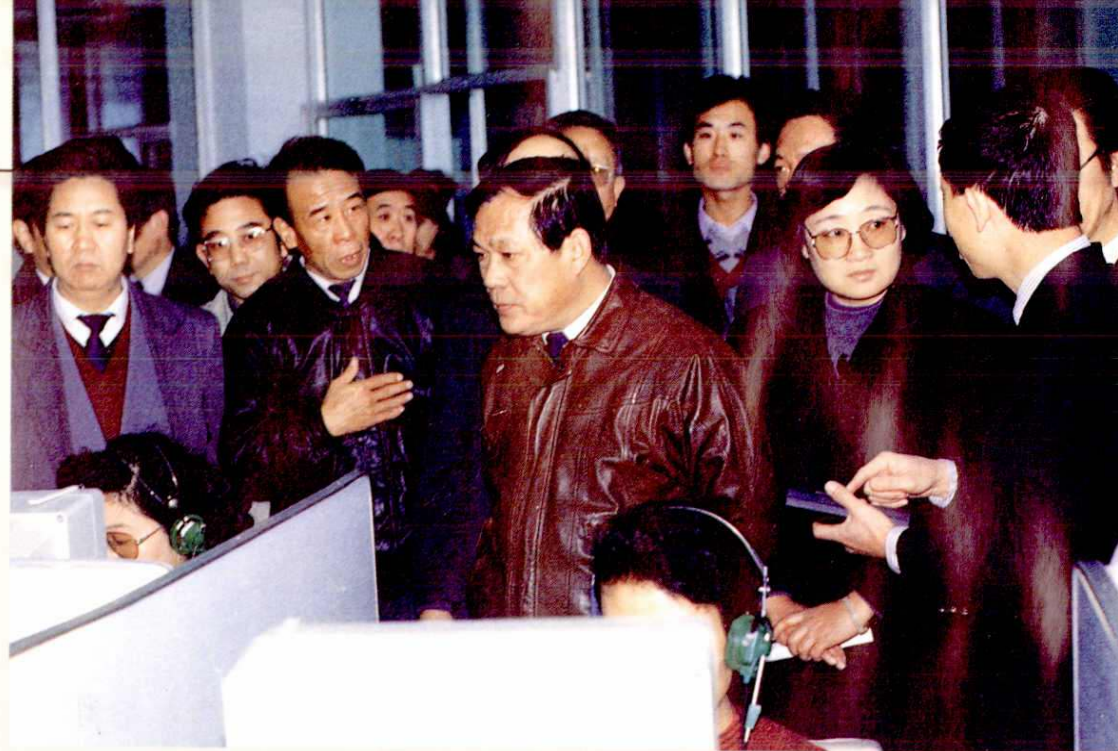
省长程维高(右三)、市委书记李海峰(右二)、市长沈志峰(左一)在省管局局长魏恩鸿(左二)陪同下视察“126”无线寻呼服务台(1991年11月)