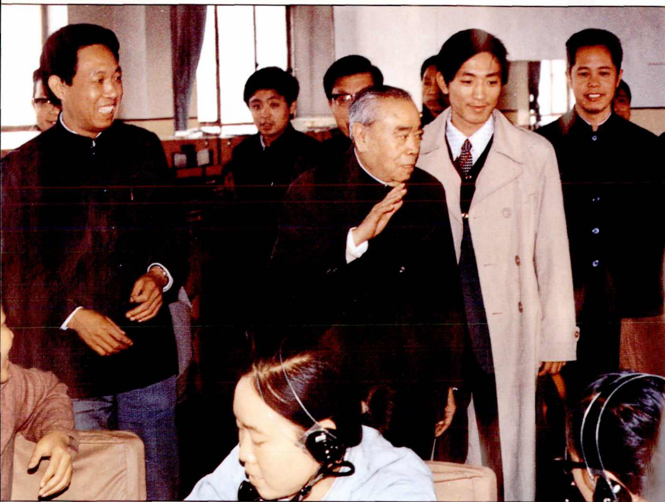
全国人大副委员长朱学范(中排左二)到长途台 看望话务员(1985年10月)