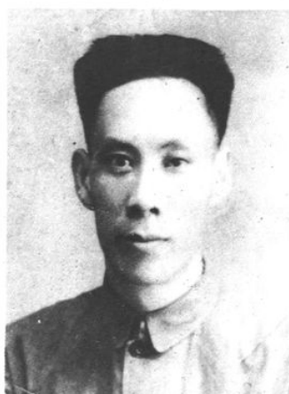
续中一 1940年10月~1943年1月，费南县抗日民主政府财政科长。