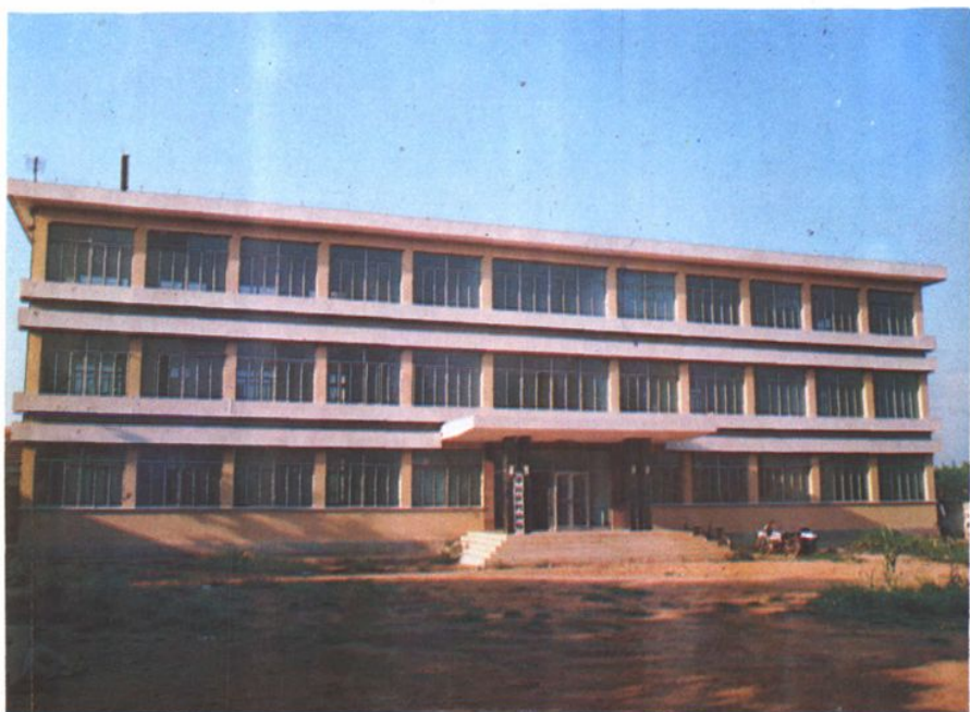
平邑县财政局办公大楼