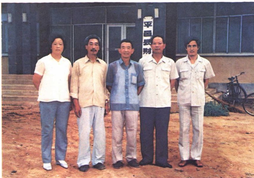
平邑县财政局领导干部合影