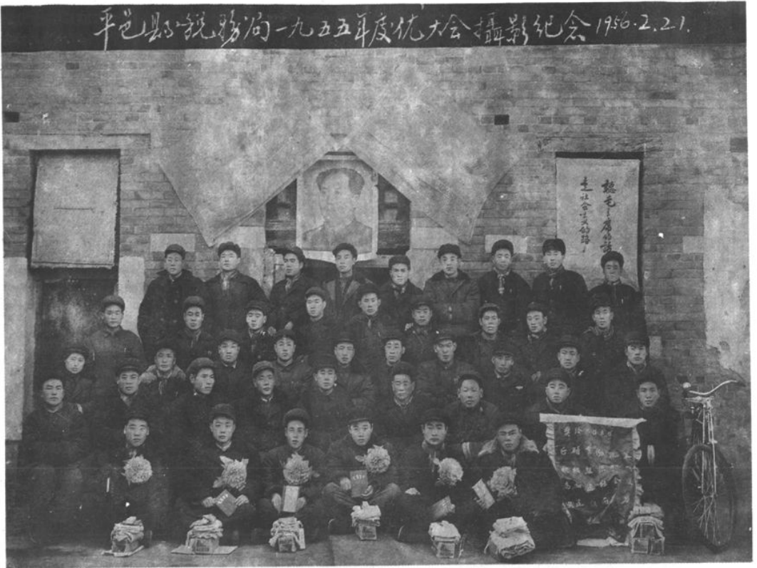
平邑县税务局一九五五年庆优大会摄影纪念