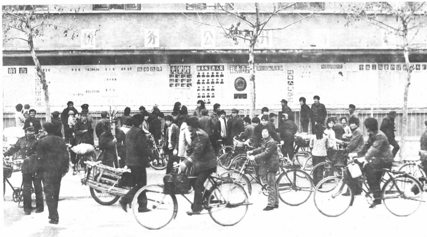
平邑 税务所公开办税