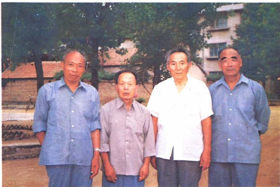
《平邑县财政税务志》编写组合影