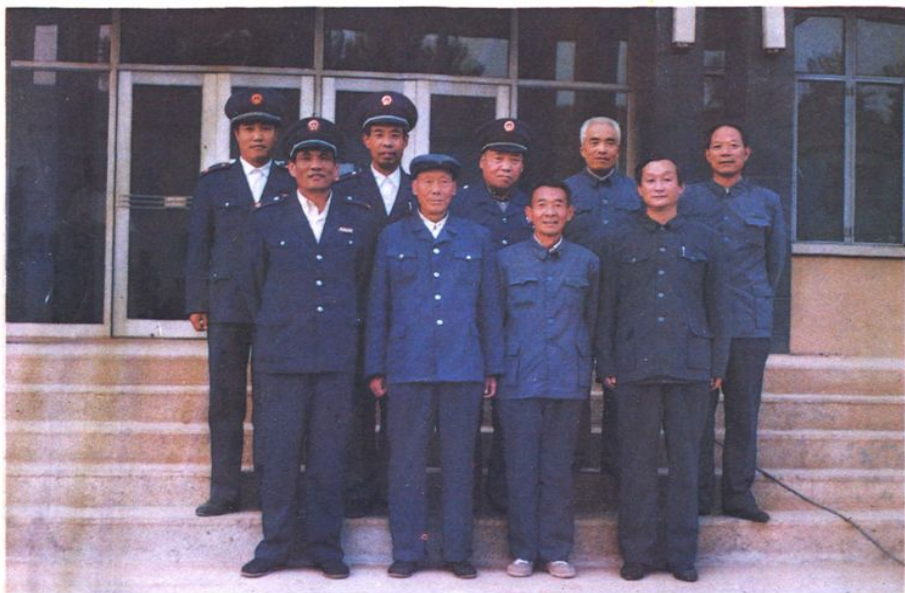
《平邑县财政税务志》编纂领导小组合影