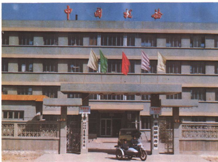
平邑县税务局办公大楼