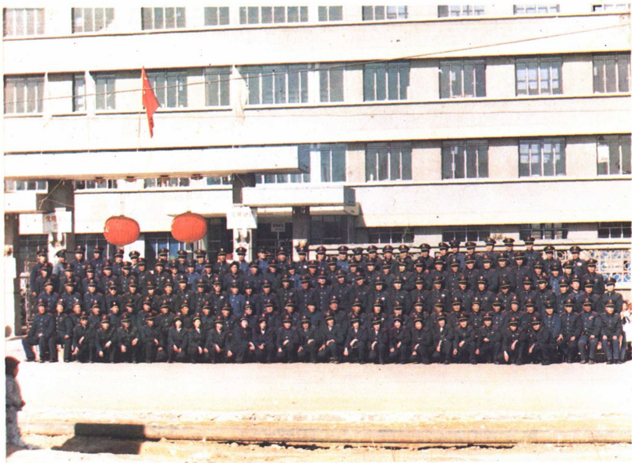
平邑县税务局全体干部合影