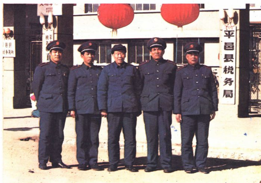
平邑县税务局领导干部合影