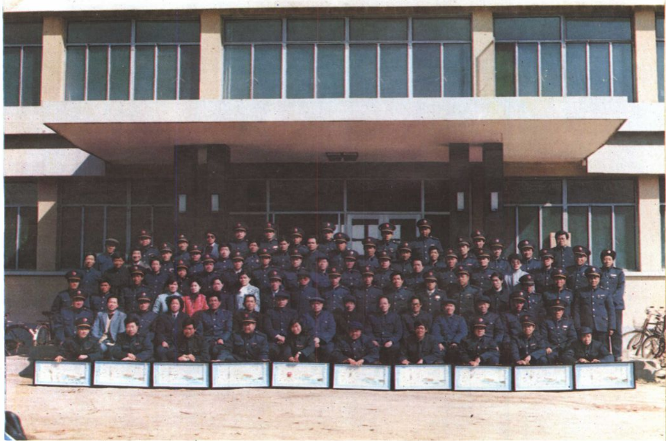
平邑县财政系统1989年表彰会合影