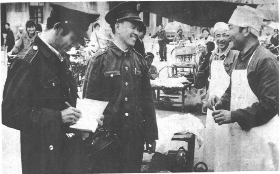
郑城税务所干部在集上收税