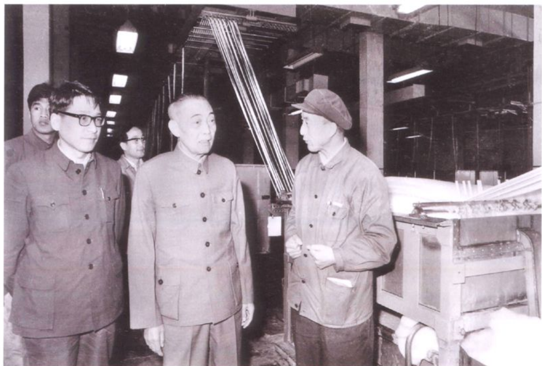
1982年4月21日，全国人大常委会副委员长李井泉（右二）视察上海石化总厂。