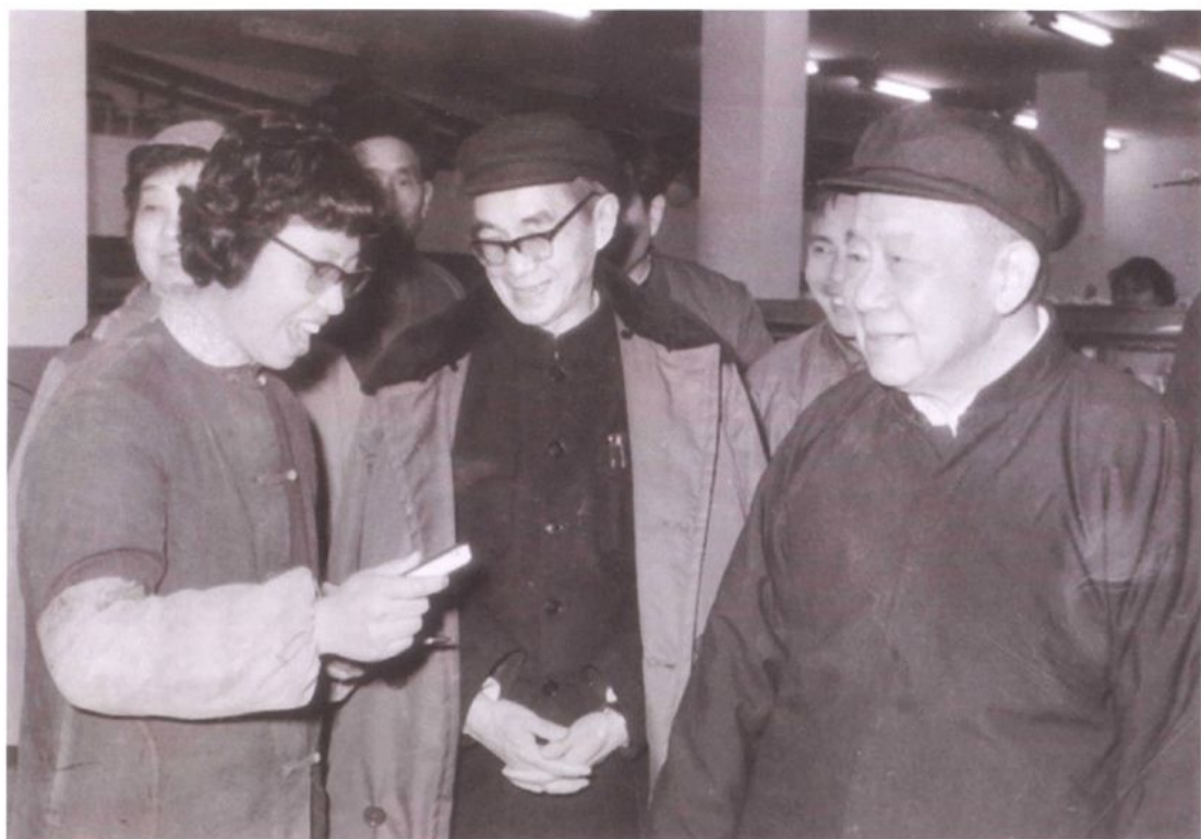
1980年2月9日，全国政协副主席陆定一（右一）在上海市委书记夏征农（右二）陪同下视察上海石化总厂。