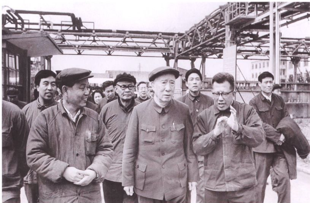
1981年3月13日，国务院副总理薄一波（前排右二）视察上海石化总厂，与总厂负责同志一起座谈，对一期工程的生产布局、引进设备的吸收消化、二期工程建设和领导班子建设等方面作了重要指示。