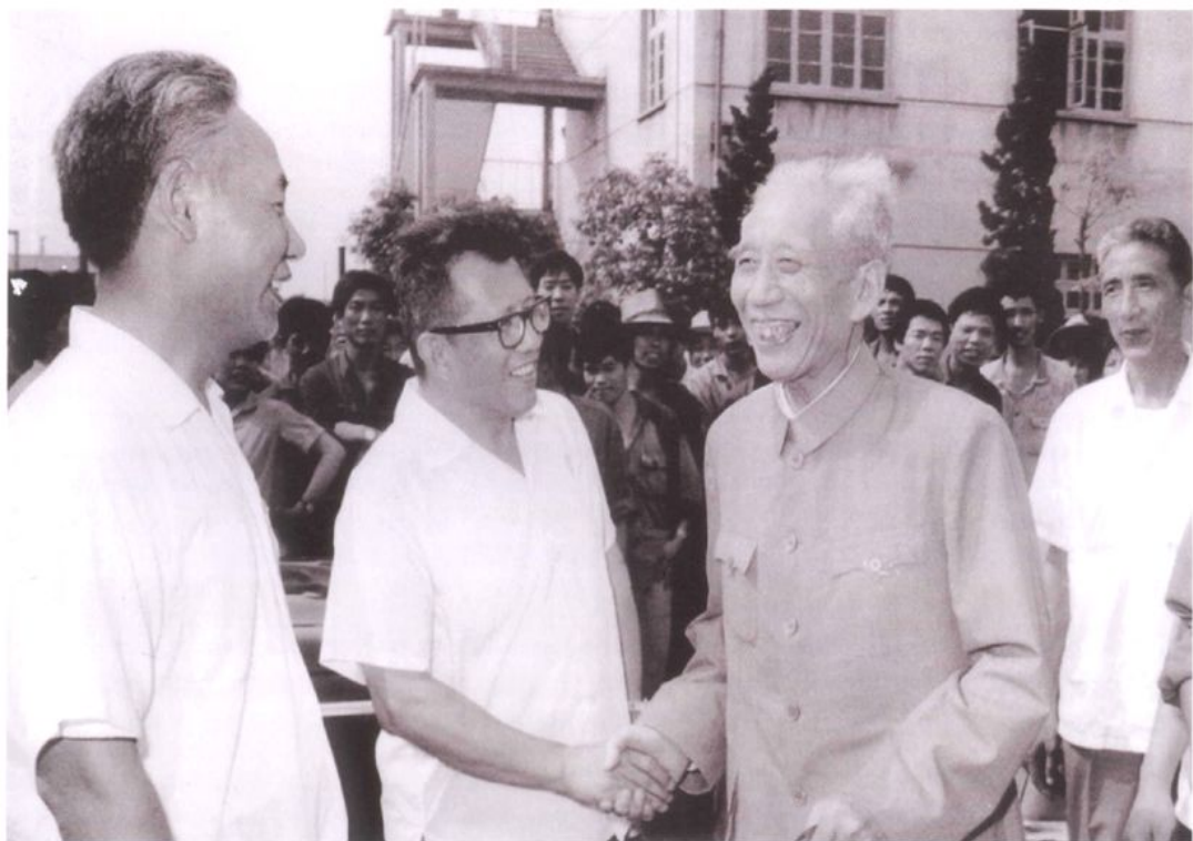
1979年7月3日，中共中央政治局委员、国务院副总理王震（左三）视察上海石化总厂。