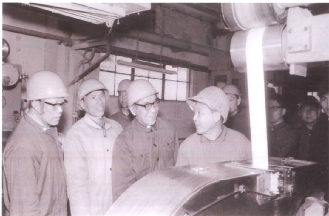
康世恩曾2次视察上海石化。1980年4月23日，国务院副总理康世恩（前排左三）视察上海石化总厂腈纶厂。1990年4月13日，中央顾问委员会常委康世恩再次来上海石化总厂，考察乙烯厂、化工二厂乙二醇装置、塑料厂聚丙烯装置及生活区。