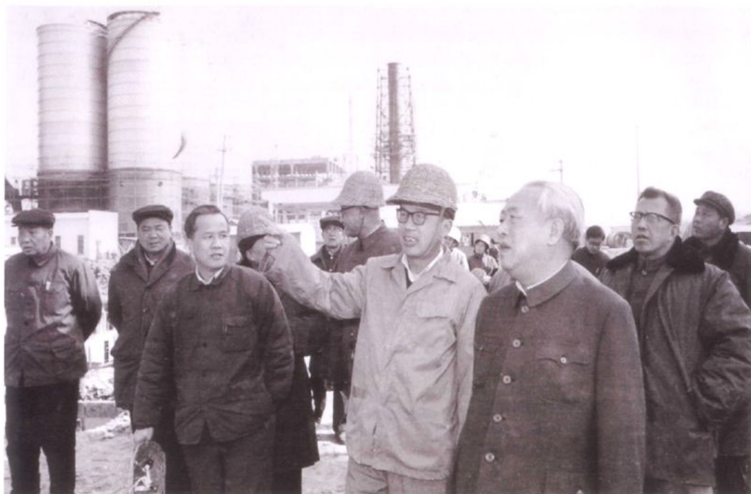
1982年1月20日，中共中央政治局委员、中央书记处书记、国务院副总理余秋里（右三）在上海市市委副书记陈锦华（左三）陪同下视察上海石化总厂化工一厂、塑料厂、腈纶厂、涤纶二厂等建设工地。