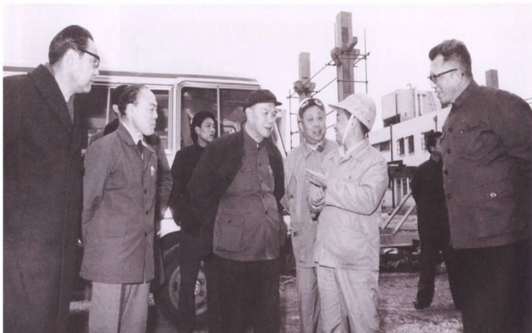
姚依林在担任国务院副总理时曾2次视察上海石化。1981年4月28日，国务院副总理姚依林第一次视察上海石化总厂。1983年1月4日，中共中央政治局候补委员、国务院副总理姚依林（前排左三）再次视察上海石化总厂二期工程，说：“前年我来是在竹棚里看到二期工程模型。今年再来这里，已经看到了现实的东西，给我留下了很深的印象。”