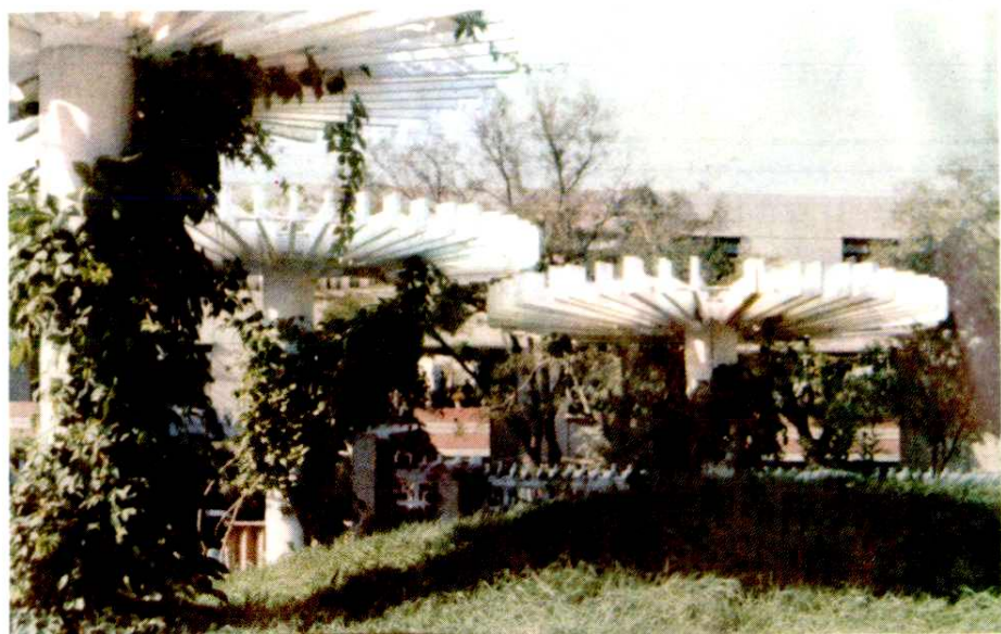
柳安新村绿化小品