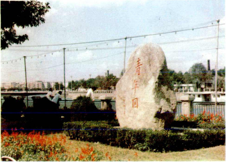
邓颖超为海河公园中的青年园题名