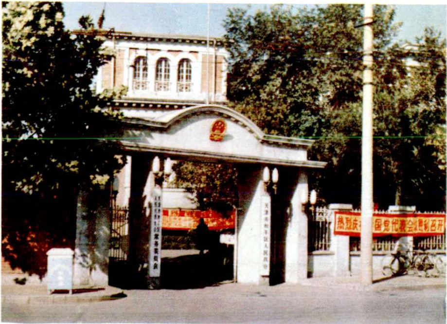
和平区人大，区人民政府