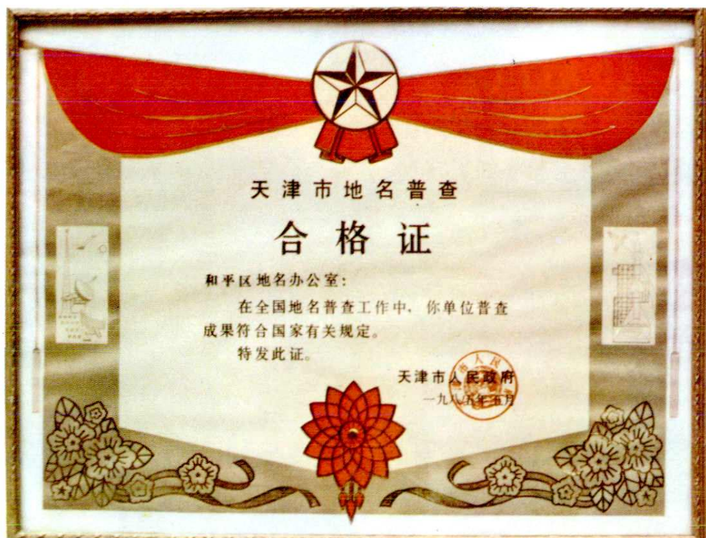
天津市人民政府颁发的 地名普查合格证