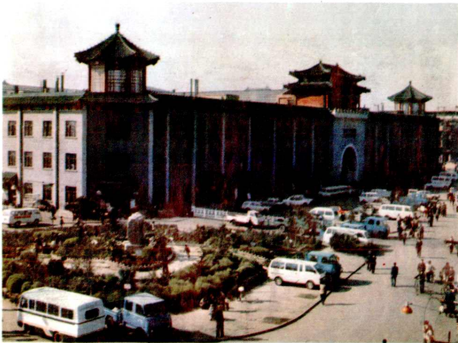
南市食品街东北侧