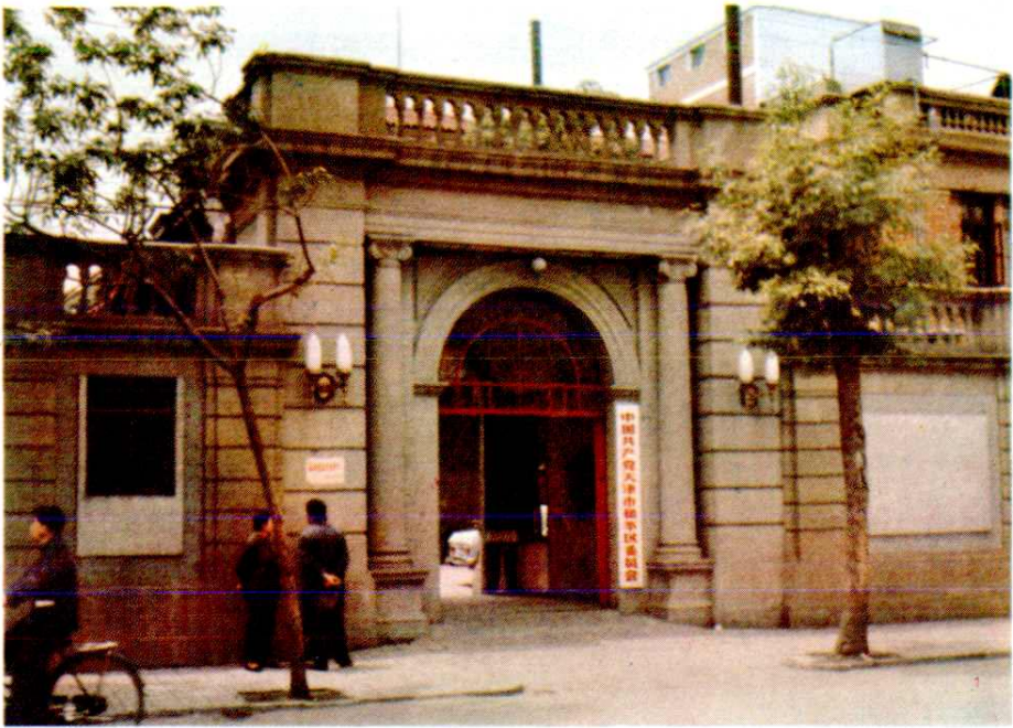
中共和平区委员会