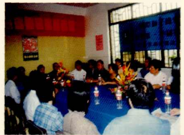
图为国际狮子总会探访团视察中医院