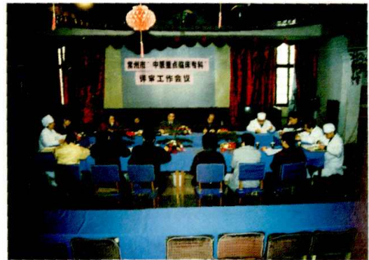
图为皮肤科创常州市中医重点临床专科评审会场