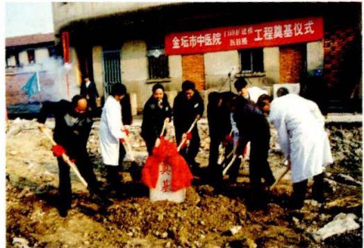
图为院领导为门诊楼、医技楼奠基