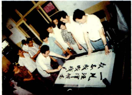
图为国家中医药管理局局长朱杰为中医院题词

7月24日，国家中医药管理局局长朱杰、省卫生厅副厅长陆萍、省中医管理局计财处处长卢晓玲、常州市卫生局局长周业俊来金坛县中医院察看灾情，听取刘志良院长关于中医院受灾情况汇报。朱杰为中医院题词：“一片汪洋催杏坛，众志成城战瘟神。”副县长陆美凤、县卫生局局长蒋午振、副局长袁文运陪同视察。