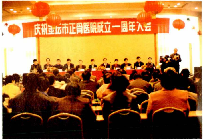
图为省卫生厅厅长周琅（中）等省、市领导出席庆祝大会