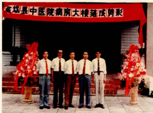
图为院领导在新病房大楼前合影

9月1日，县中医院经中国烧伤创疡科技中心批准成立“中国烧伤创疡科技中心金坛分中心”。