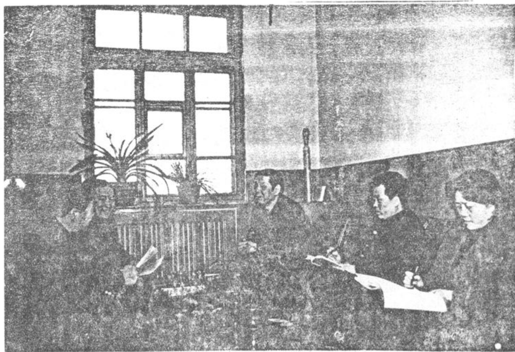
站党支部委员会在研究工作