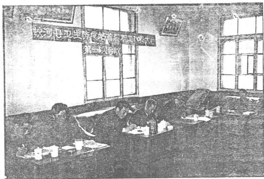
站领导在首届职代会上