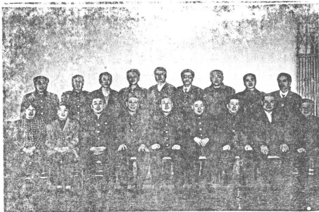
站务委员会、党支部委员会、工会委员会全体成员