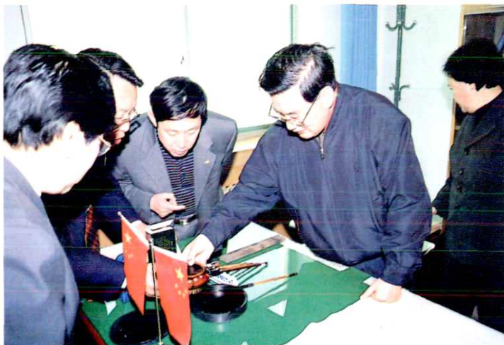
国家审计署审计长李金华来延安视察审计工作时，为《延安地区审计志》题词