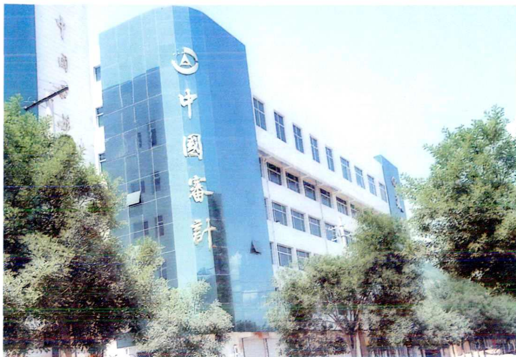
延安地区审计局办公大楼