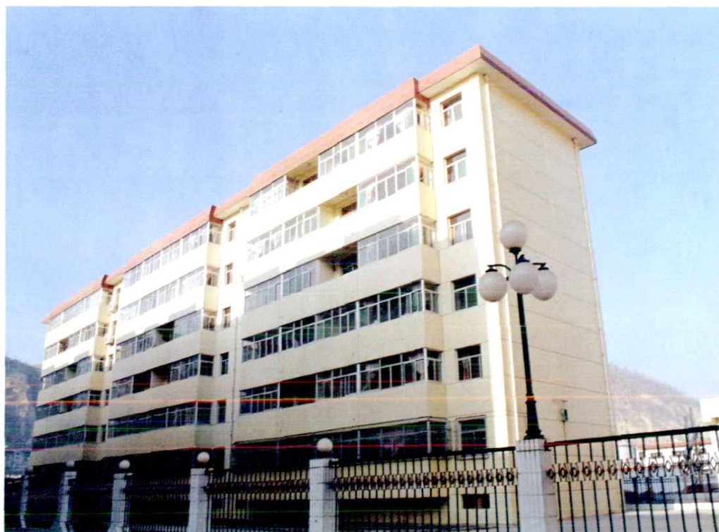
延安地区审计局职工住宅楼