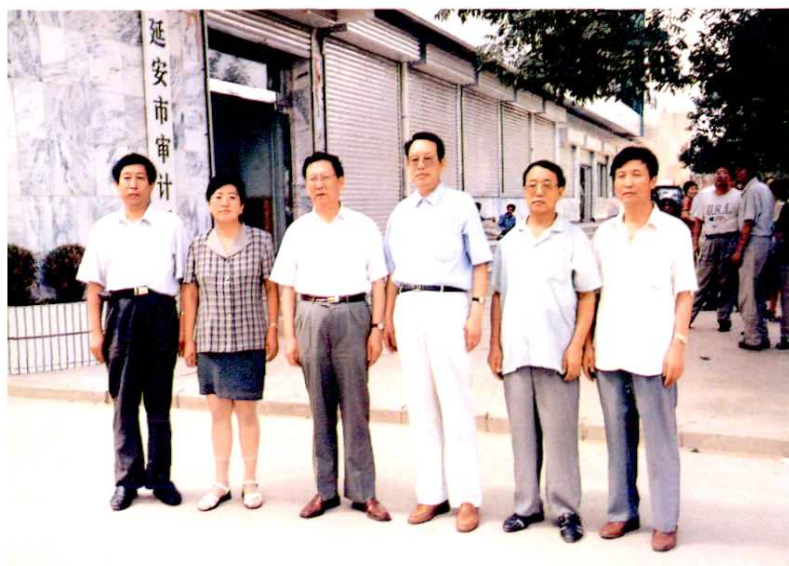
2000年7月29日，国家审计署副审计长翟熙贵（左起第3人），来延安视察工作时与局领导合影