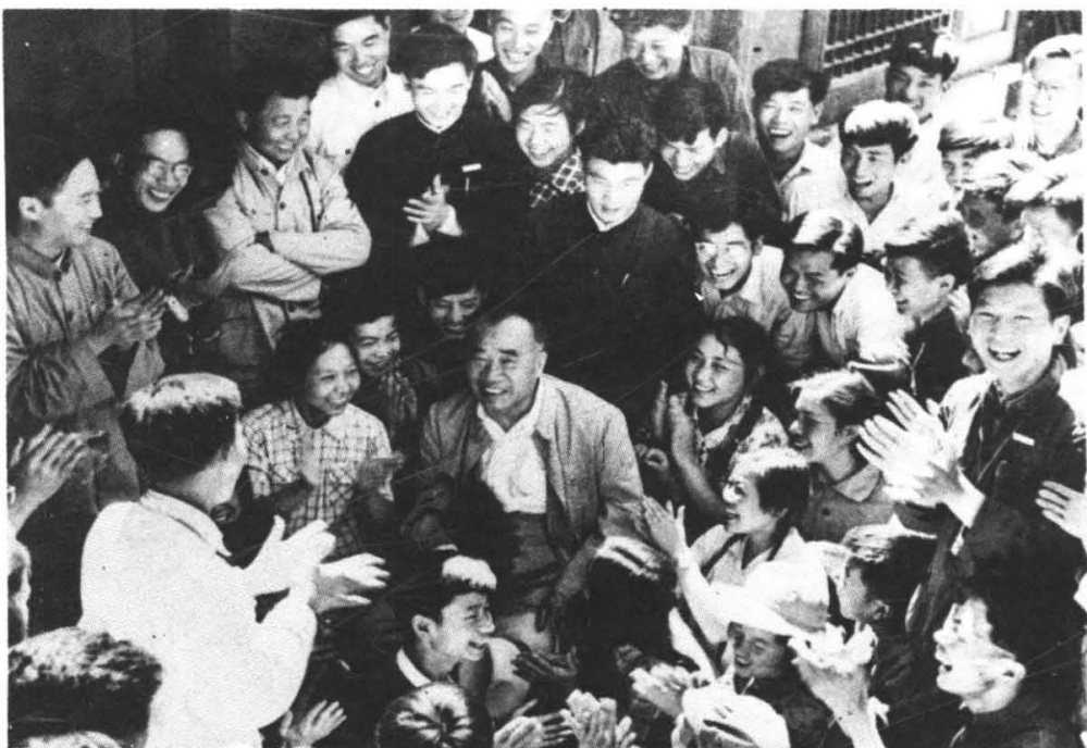
朱德同志和我校 在兴隆山实习的师生 在一起